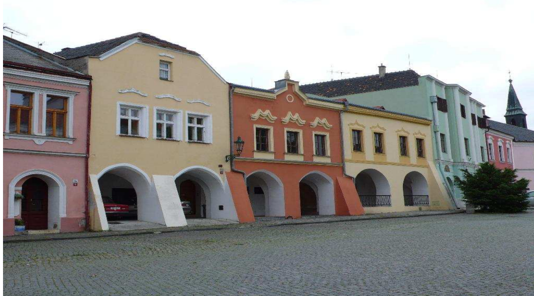
Obrázek 1: domy na Horním náměstí [18]