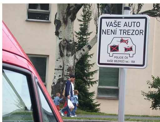
Obrázek č. 5: Ukázka umístění informačních cedulí „Auto není trezor“

K upozorňování řidičů se využívá informačních cedulí s logem akce na různých místech, především na parkovištích ve městech a před nákupními centry.