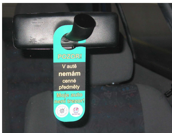
Obrázek č. 6: Ukázka závěsu

Na projektu, který odstartoval v roce 2000, spolupracovala preventivně informační skupina s Mezinárodní policejní asociací IPA. Celkem bylo za 50 000 Kč vyrobeno přes 8 000 ks závěsů. Akce byla načasována do období předvánočních nákupů a byla spuštěna v rámci teritoria správy Jihomoravského kraje (na 14 okresech JmK a také na okrese Vsetín). Část závěsů byla také využita při kontrolách na parkovištích před nákupními centry, kdy je řidiči obdrželi přímo z rukou policejních hlídek, část potom bude občanům k dispozici na preventivně informačních skupinách jednotlivých okresních (městského) ředitelství Policie ČR.