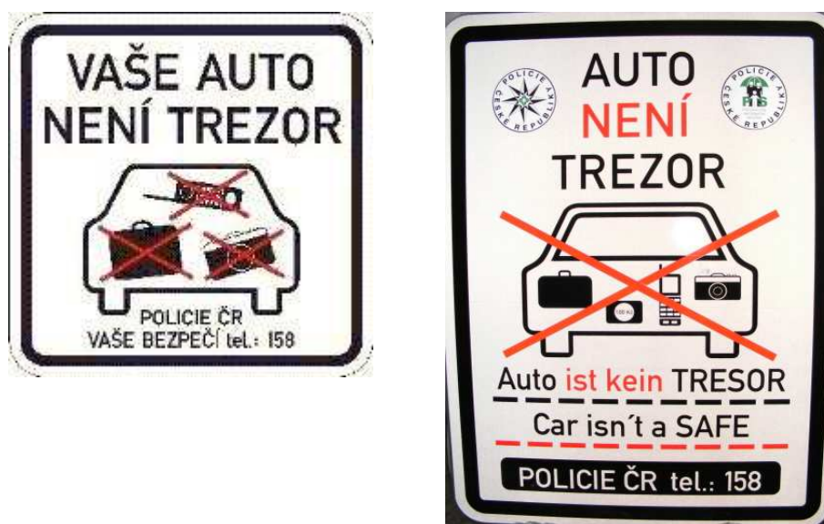
Obrázek č. 4: Ukázka loga projektu „Auto není trezor“

K upozorňování řidičů se využívá informačních cedulí s logem akce na různých místech, především na parkovištích ve městech a před nákupními centry.