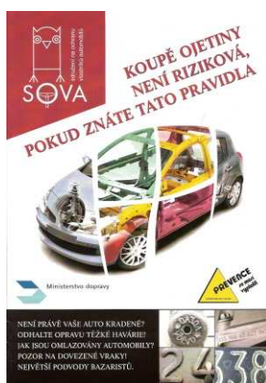
Obrázek č. 2: Publikace Koupě ojetiny není riziková, pokud znáte tato pravidla

Dalším informačním počinem v prevenci proti krádeži motorových vozidel a krádeží věcí z automobilů je informační brožurka Policie ČR „Zabezpečte svá vozidla!“.