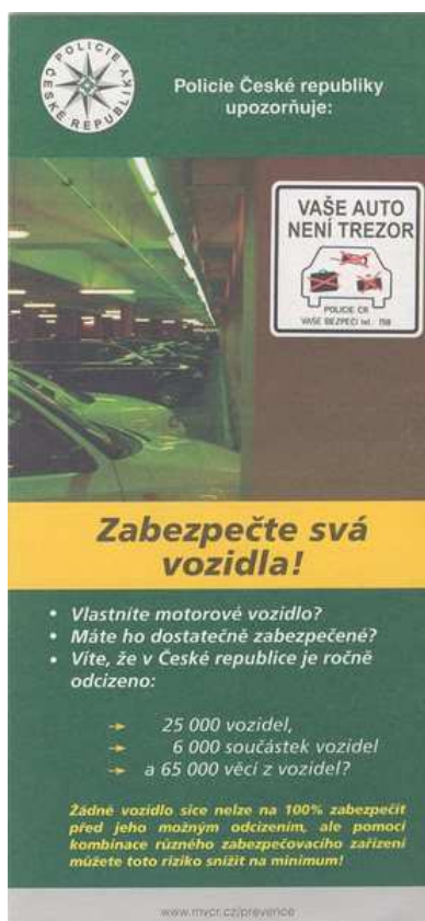
Obrázek č. 3: Brožurka „Zabezpečte si svá vozidla!“

Dalším informačním počinem v prevenci proti krádeži motorových vozidel a krádeží věcí z automobilů je informační brožurka Policie ČR „Zabezpečte svá vozidla!“.