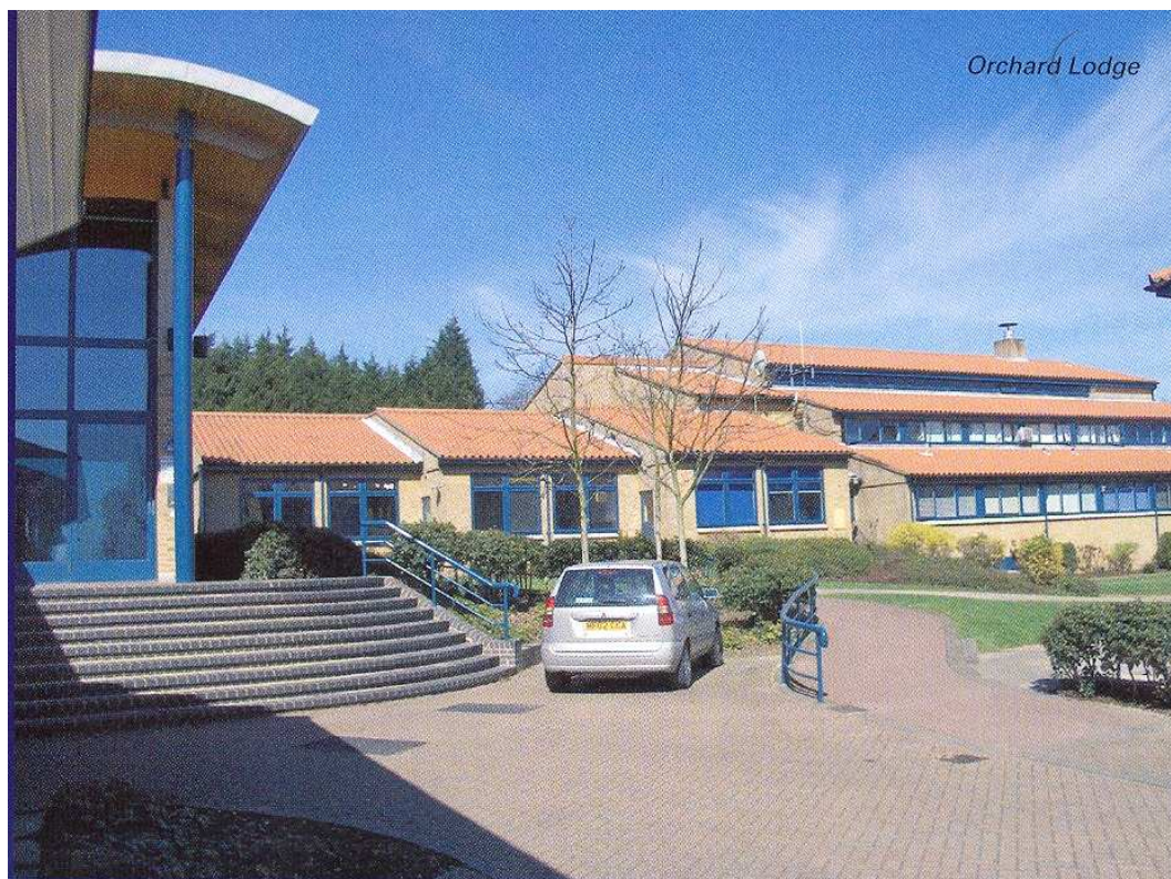
Příkladem zařízení pro mladistvé v Anglii je věznice v londýnské čtvrti Orchard Lodge. (Interní materiály Institutu vzdělávání VS ČR)