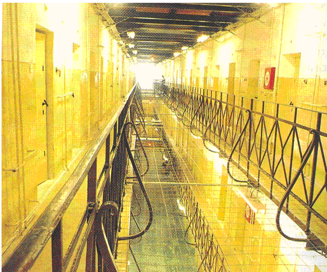
Nitra - Chrenová jediný ústav zajišťující výkon trestu odnětí svobody žen všech věkových skupin i výjimečného trestu na Slovensku.