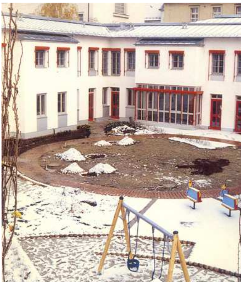
Věznice v Aichachu, pohled na část oddělení výkonu trestu matek s dětmi. (Interní materiály Institutu vzdělávání VS ČR)