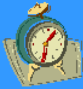
Schéma vykázaní - lhůty