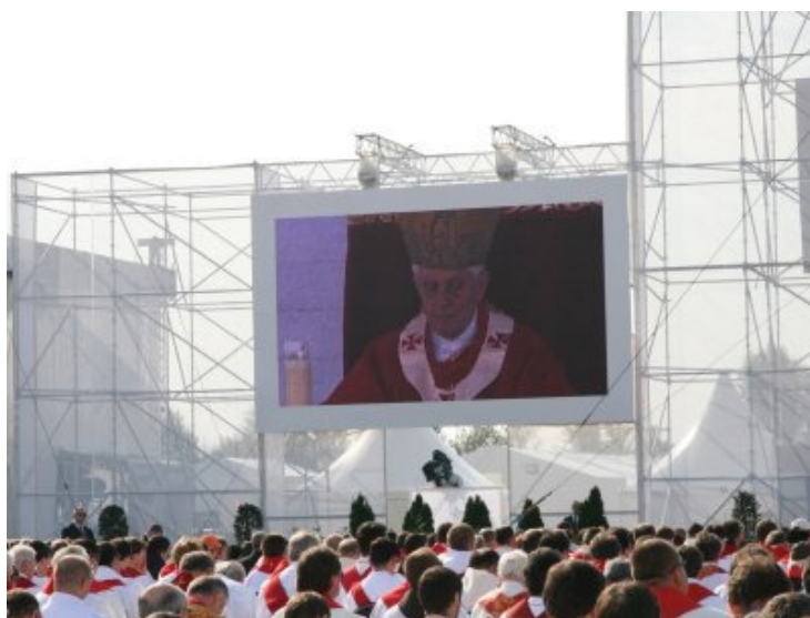
Obrázek 16 – Benedikt XVI. během kázání na Proboštské louce

Papež dorazil do Staré Boleslavi před devátou hodinou ranní. Jeho první zastávkou byla bazilika sv. Václava. Než do ní vstoupil, pozdravil se středoevropským hejtmanem Davidem Rathem, místním starostou a duchovními. V bazilice se pomodlil před Nejsvětější svátostí a poté si prohlédl místo, kde byl údajně zavražděn patron české země. Se sv. Václavem souvisel i jeho následující úkon, šel uctít jeho lebku do krypty baziliky.