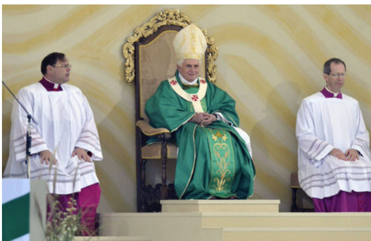
Obrázek 15 – Benedikt XVI. v Brně