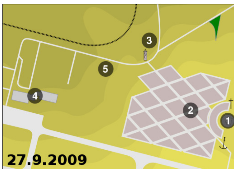
Obrázek 13 – Schéma setkání v Brně - Tuřanech

Protože se předpokládala na mších v Brně a Staré Boleslavi vysoká účast, byly organizátory zavedeny místenky. Ty byly rozdávány zdarma, jejich úkolem bylo zlepšit orientaci poutníků na prostorách setkání.