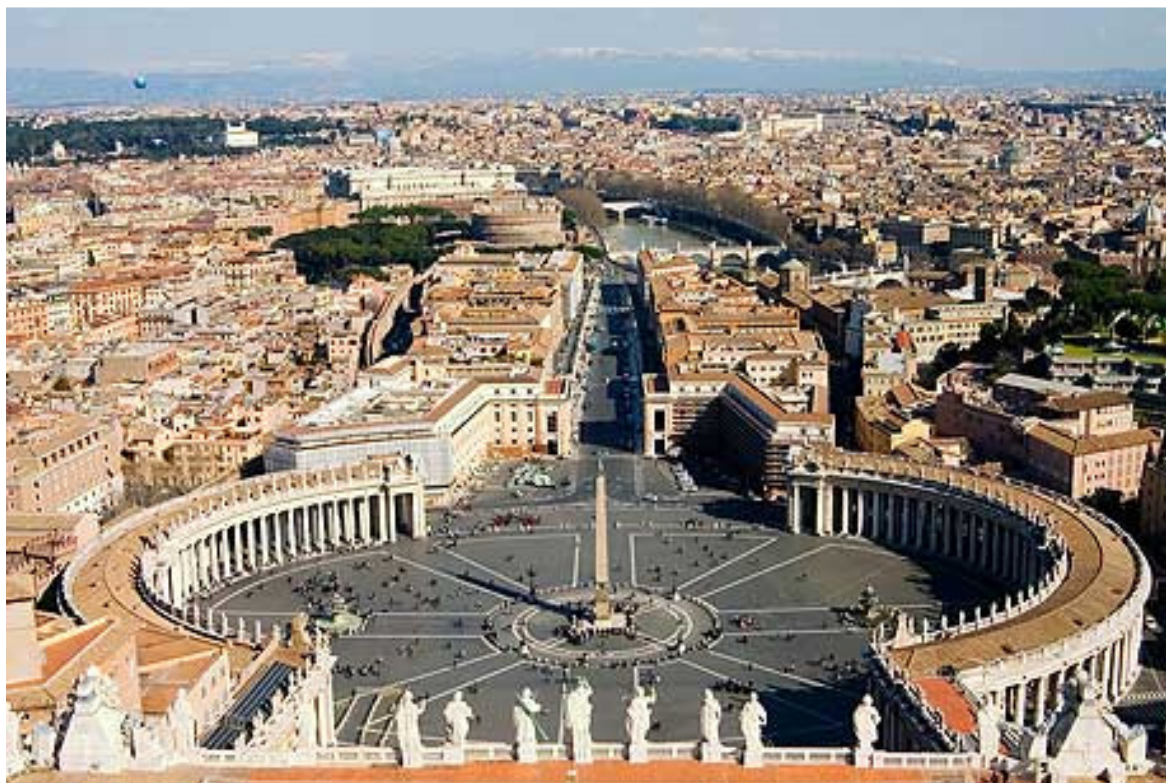
Obrázek 1 – Náměstí sv. Petra

Katolická církev je jedním z pilířů západní civilizace. Po 2000 let své existence byla centrem školství, vědeckého a ekonomického pokroku. Většina hodnot a norem současné civilizace je také převzata z křesťanství. Ve středověku byly církevní zákony univerzálními, což přispělo k jejich adaptaci v Evropě i jinde na světě.