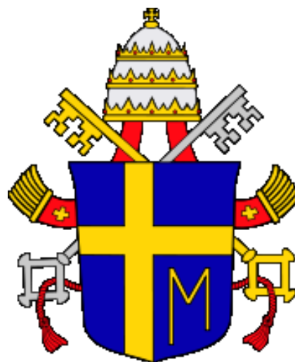
Obrázek 8 – Erb Jana Pavla II

Významný byl také jeho politický vliv. Mnozí lidé mu přisuzují podíl na pádu komunistických režimů ve východní a střední Evropě. Lech Walesa (vůdce Solidarity, polského protikomunistického hnutí) tvrdil, že Jan Pavel II dal organizaci odvahu k mírovému odporu. (6)