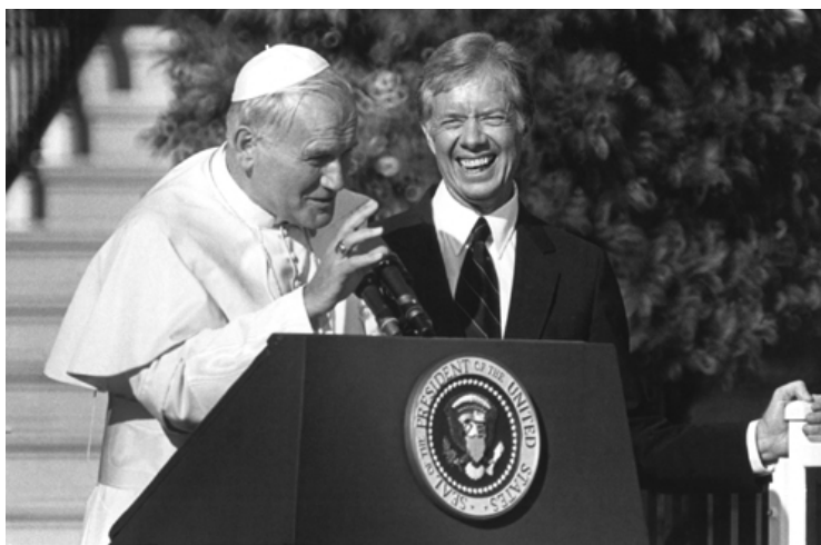
Obrázek 5 – Jan Pavel II a Jimmy Carter

V roce 1979 se stal prvním papežem, který navštívil Bílý dům. Byl přivítán tehdejším americkým prezidentem Jimmy Carterem, (6)