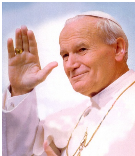
Obrázek 7 – Jan Pavel II.

Po smrti Jan Pavla I. se Karol Wojtyła ve svých 58 letech stal papežem. Jako své nové jméno si zvolil Jan Pavel II. po svém předchůdci. Byl to první neitalský papež od roku 1522 a nejmladší od roku 1846. V úřadu přežil dva atentáty, jeden pravděpodobně zinscenovaný KGB, druhý odpůrci Druhého vatikánského koncilu. První se odehrál na náměstí