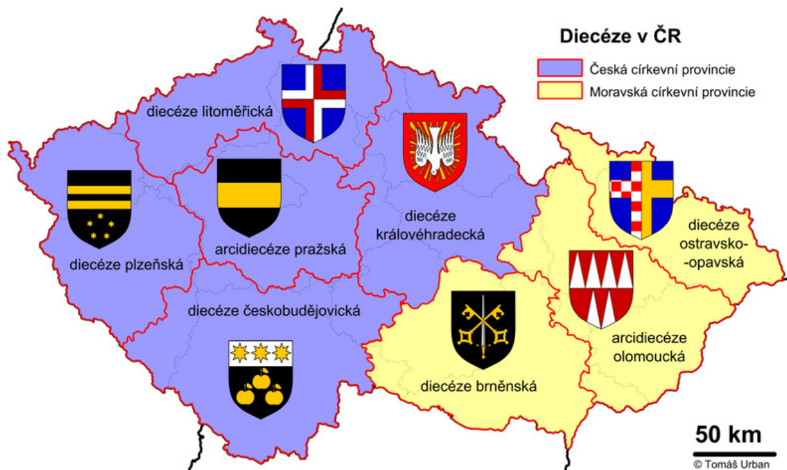
Obrázek 3 – Přehled diecézí v ČR

V České republice má dlouhou tradici nejen Římskokatolická církev, ale i odboj proti ní. I přesto jsou katolíci v Česku nejrozšířenější náboženskou skupinou. Působí zde v rámci osmi diecézí sdružených do dvou církevních provincií, v jejichž čele stojí arcibiskupové.