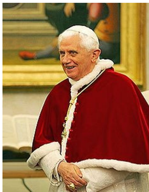
Obrázek 9 – Benedikt XVI.