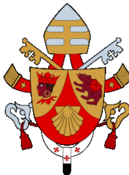
Obrázek 10 – Erb Benedikta XVI.