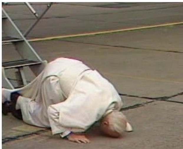
Obrázek 6 – Jan Pavel II. po příjezdu do ČR

Atmosféru z první apoštolské návštěvy pravděpodobně už nikdy nebude možné zopakovat. Je pravda, že Česko předtím navštívili papežové Klement VIII. v roce 1588 a Jan XXIII. v roce 1929, to ale bylo ještě před jejich zvolením do úřadu. Jan Pavel II. tehdy přišel na pozvání Václava Havla a kardinála Františka Tomáška. Česká a Slovenská federativní republika se tak stala po Polsku druhou zemí východního bloku, kterou papež navštívil. Jeho příjezd tehdy prezident Havel označil