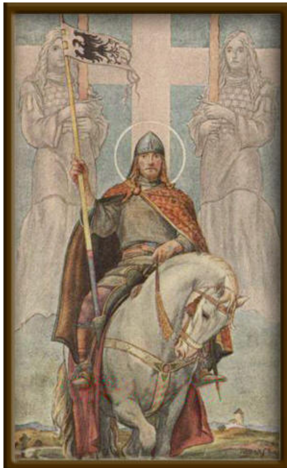
Obrázek 12 – Sv. Václav

Je zvykem, že Vatikán oficiálně oznámí návštěvu papeže, až když jsou všechny přípravy ukončeny, takže oficiálně byla návštěva oznámena až 30. května. To bylo učiněno při příležitosti cesty prezidenta Václava Klause do Říma. (16)