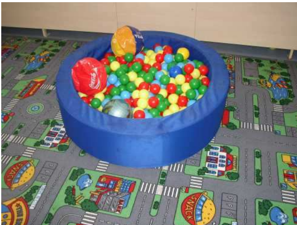
Obrázek 4 Dětský koutek ve specializovaném oddělení pro matky s dětmi