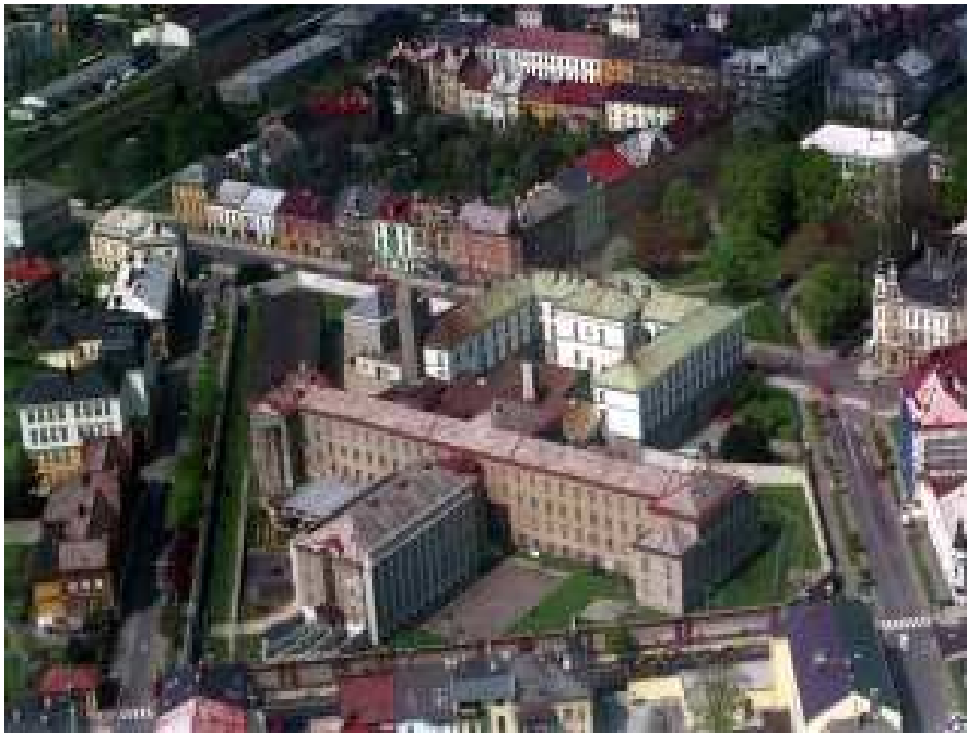
Obrázek 5 Letecký snímek objektu Olomoucká opavské věznice