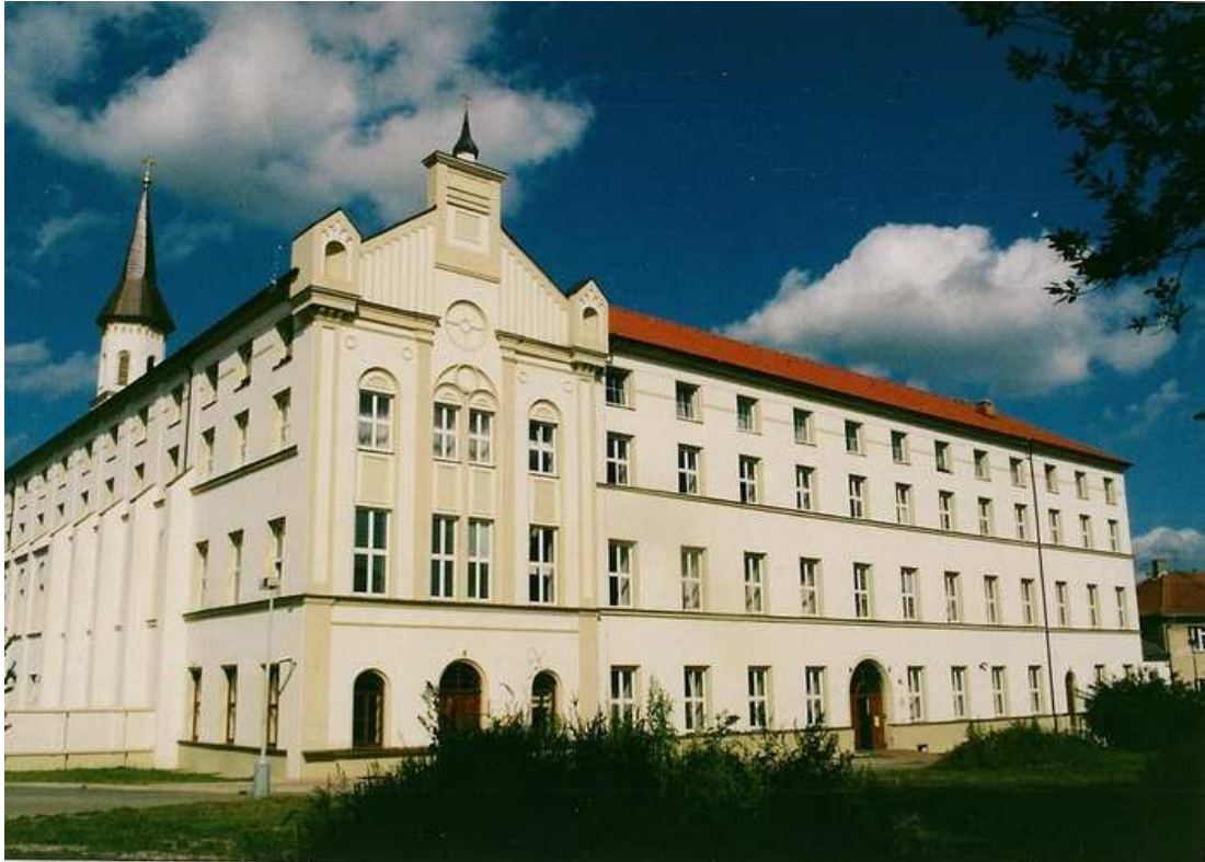
Obrázek 1 Domov Sv. Karla Boromejského v Praze - Řepy