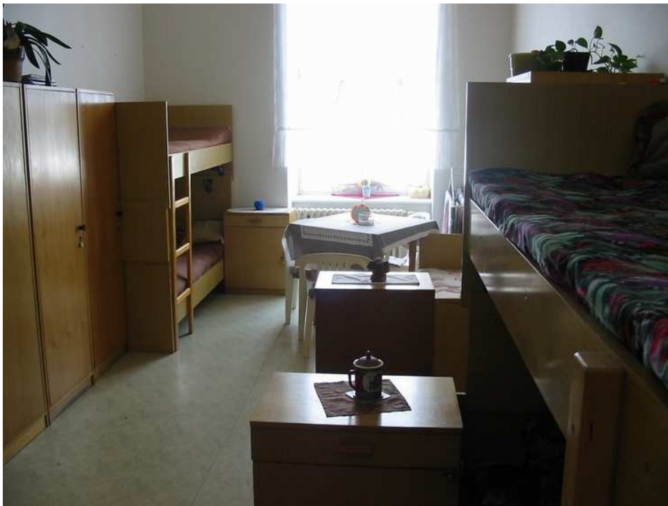
Obrázek 2 Pokoj odsouzených žen v domově Praha – Řepy