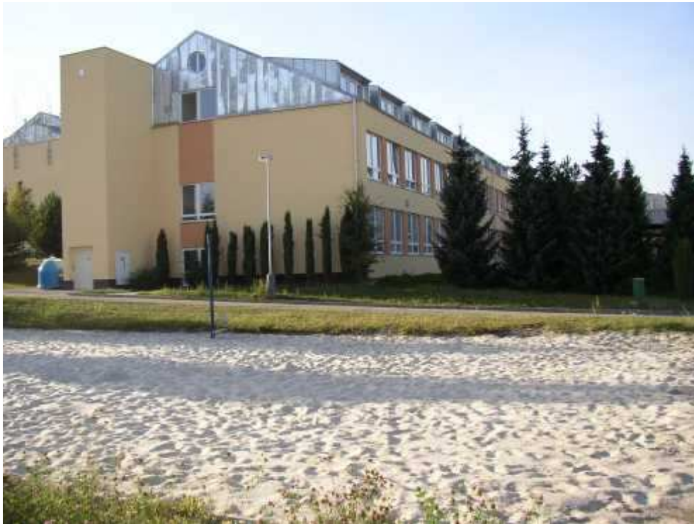
Obrázek 3 Věznice Světlá nad Sázavou