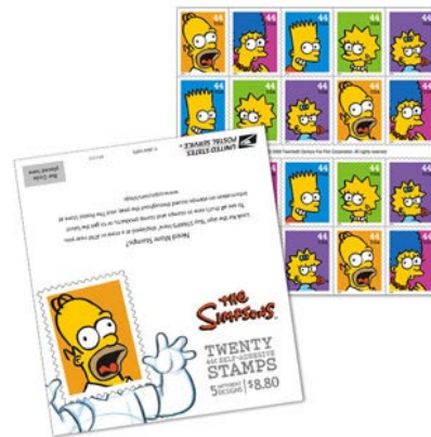
Výročné poštové známky