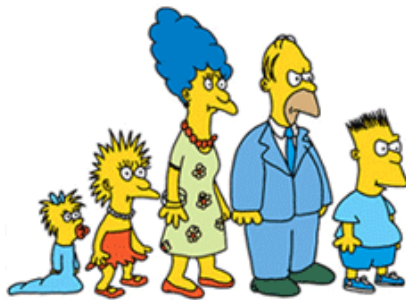
Prvotný vzhľad (sketch)