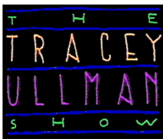
Logo The Tracey Ullman Show