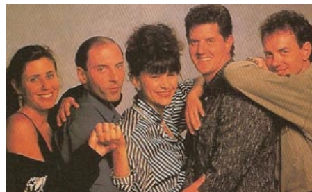
Predstavitelia Tracey Ullman Show