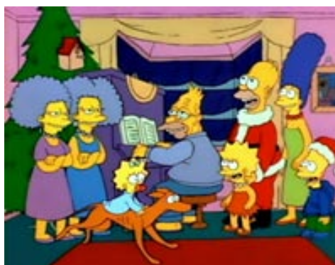
Ukážka z prvého dielu Simpsons Roasting on an Open Fire (Vianoce u Simpsonovcov)