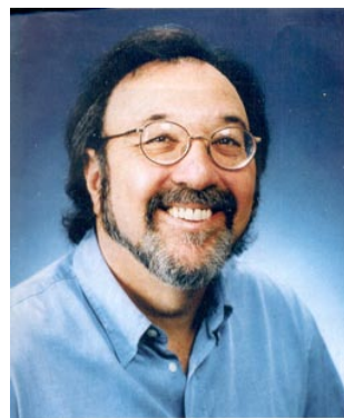
James L. Brooks