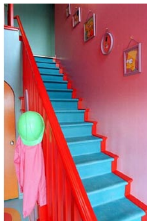
Ukážky z reálného domu postaveného podľa seriálového