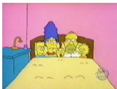
Ukážky z prvého sketchu Good Night (Dobrá noc)