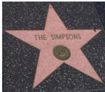
hviezdu na Chodníku slávy v Hollywoode