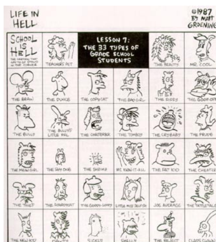
Postavičky z časopisu Life In Hell