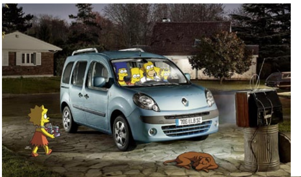
Ukážka z reklamy na Renault Kangoo