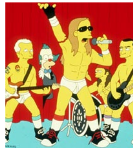
Red Hot Chili Peppers