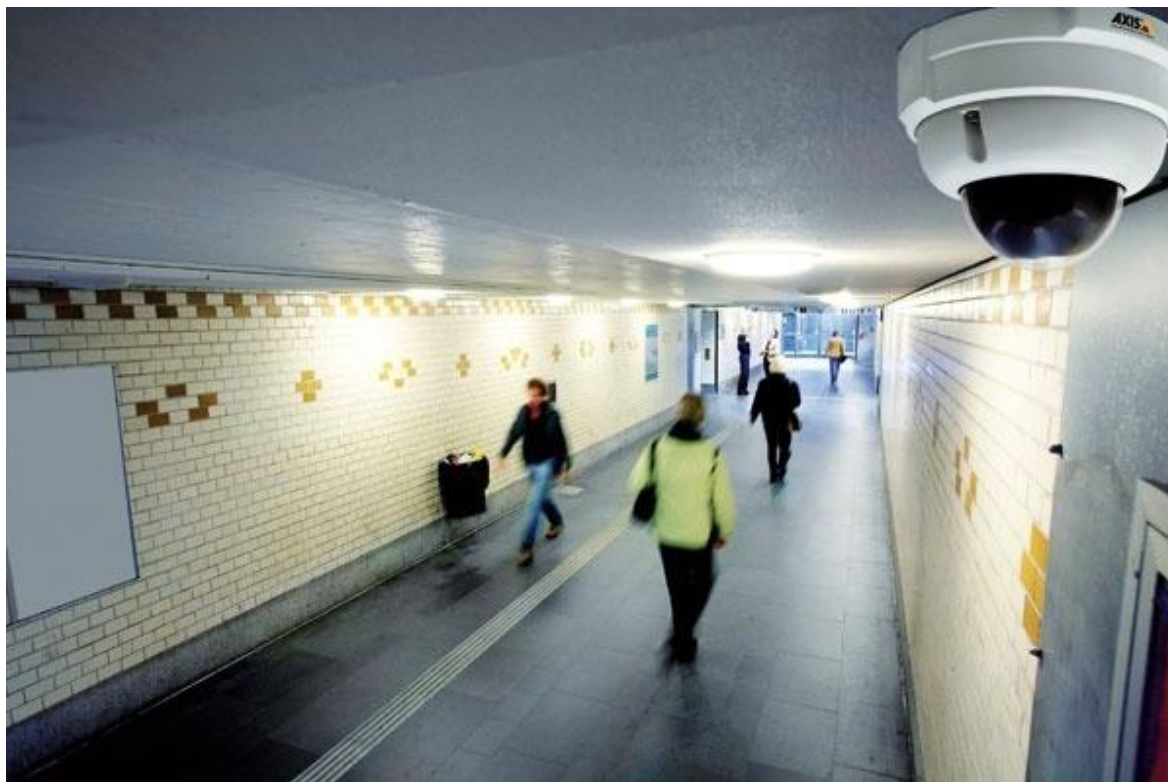
Obrázek 6: Moderní síťové kamery používané ve všech podmínkách.

Monitoring v Polsku je považován za služby z oblasti fyzické ochrany. Podle „IMS Research“ prognózy, obsažené ve zprávě, Globální trh zařízení CCTV a video monitoringu – vydání 2008, do roku 2012 celosvětový trh síťových kamer dosáhne více než 2,5 miliard dolarů. Také v Polsku roste trend migrace z analogových systémů monitoringu (CCTV) na nové typy IP řešení. To vyplývá nejen s následků globálního trendu podporované vytváření sítí, ale hlavně z plánovaných v Polsku, mnoha investici do infrastruktury, které se týkají mimo jiné s organizaci Euro 2012.