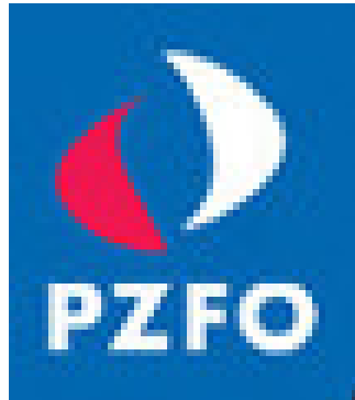
Obrázek 5: Logo Polského Sdružení Bezpečnostních Firem

Polské Sdružení Bezpečnostních Firem v Unii Polských Komor je od 2009 roku. Hlavním cílem PZFO je ochrana práv a reprezentace zájmů členů odborů pracovníků v úřadech státní správy, u orgánech místní samosprávy, protivládních principech a u dodavatele. [16]