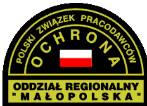
Obrázek 4: Logo Polské Komory Zaměstnavatelů, „OCHRANA“