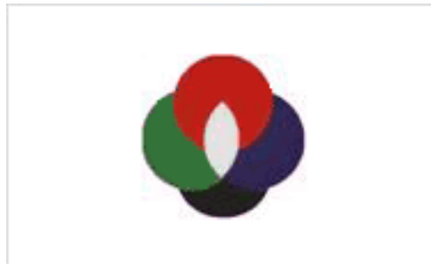
Obrázek 1: Logo Národní Asociace Výrobců, Techniků a Instalační Zabezpečovacích Systémů „POLALARM“