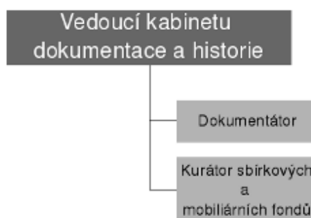
Organizační schéma Kabinetu dokumentace a historie

Úkolem kabinetu je zejména vyhledávat, získávat a evidovat (katalogizovat) písemné dokumenty, obrazové materiály a jiné reálie, dokumentující historii českého vězeňství, tyto uchovávat, využívat při výuce posluchačů Institutu vzdělávání a poskytovat je k dalšímu využití. Kabinet spravuje a doplňuje sbírkový fond dokumentující vývoj zacházení s vězni na území České republiky, instalovaný v Památníku Pankrác a zabezpečuje jeho využití ke studijním a pietním účelům v rámci Vězeňské služby, meziřesortní a mezinárodní spolupráce. Kabinet se podílí na vědeckovýzkumné činnosti v oblasti historie vězeňství a penologie a na prezentaci výsledků formou publikační činnosti, odborných seminářů a konferencí v rámci Vězeňské služby, meziřesortní a mezinárodní spolupráce (Nařízení generální ředitelky Vězeňské služby č. 43/2000).