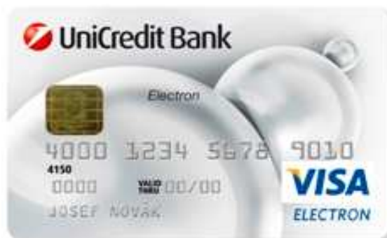
Obr. 6. Platební karta VISA Elektron [22]