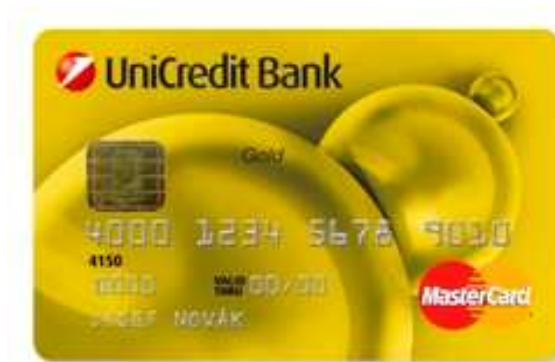
Obr. 12. Platební karta MasterCard Gold [22]