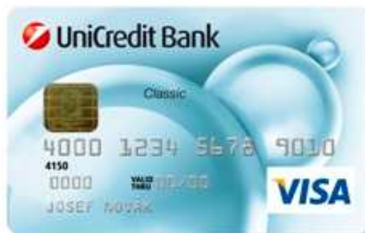
Obr. 5. Platební karta VISA Classic [22]