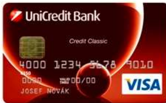
Obr. 10. Kreditní karta VISA Classic [22]