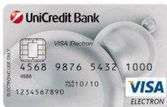
Obr. 4. Platební karta VISA Elektron [22]

Mezi povinné prvky Expresního Konta patří běžný účet v CZK a Karta EXPRES (Visa Electron), která je vydaná ihned po podpisu smlouvy.