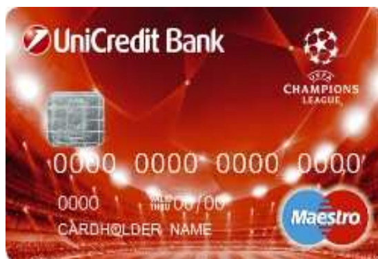
Obr. 7. Platební karta Maestro [22]