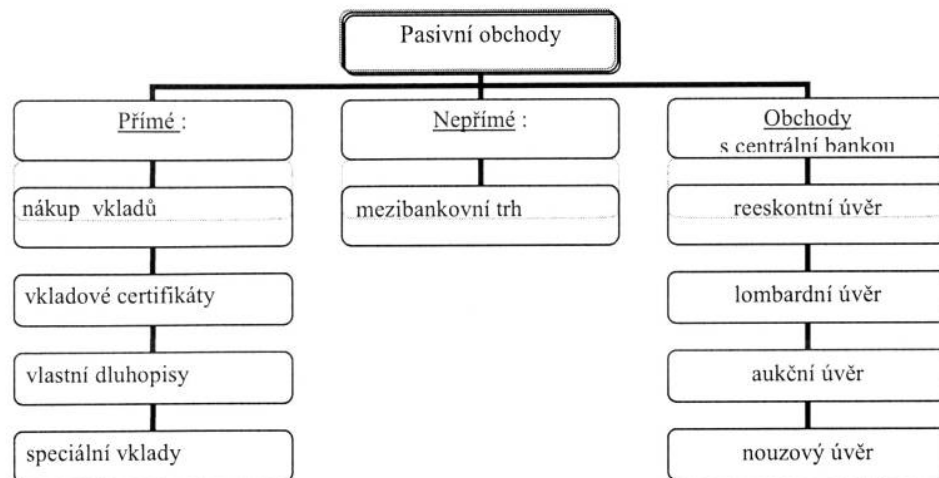
Obr. 1. Pasivní bankovní obchody [19]