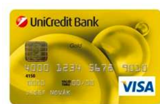
Obr. 11. Platební karta VISA Gold [22]