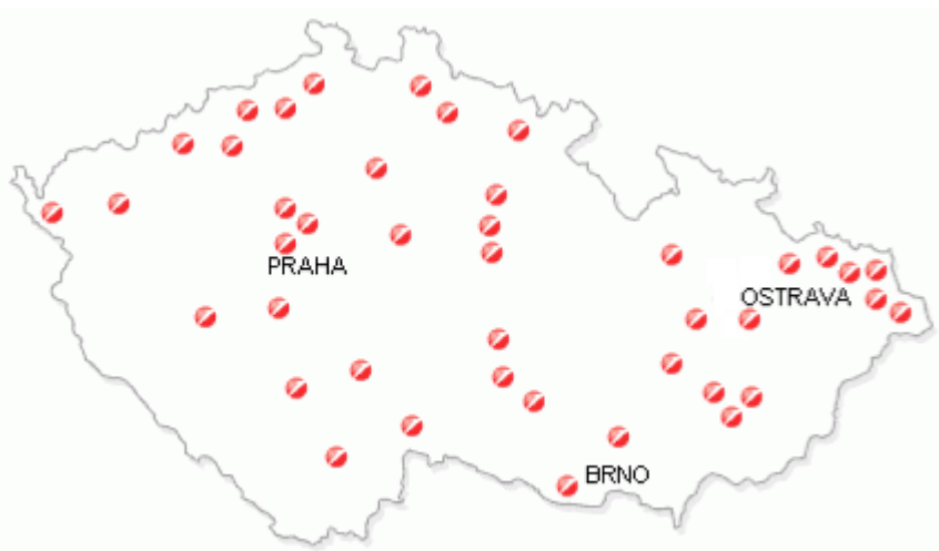
Obr. 3. Pobočková síť [22]

V České Republice je v současné době 74 poboček a jejich počet se neustále rozrůstá. Během prvního čtvrtletí 2011 se plánuje otevření dalších 3 obchodních míst.