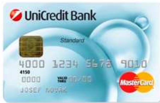
Obr. 9. Platební karta MasterCard Standard [22]