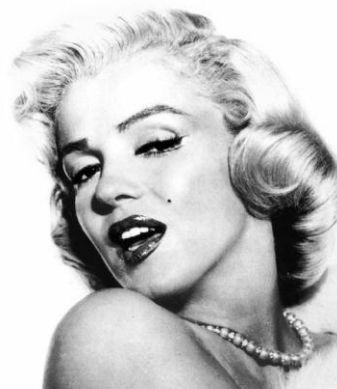
Obrázok 6.: Marilyn Monroe