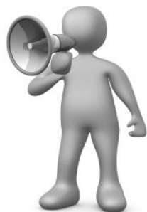
Obrázok 8.: propagácia

Marketingová stratégia sa vytvára už v prípravných fázach, keď sa producent rozhoduje o obsadení hlavných tvorivých pozícií vo filme. Tu mám na mysli nielen režisérske a kameramanské pozície, ale tak isto aj hviezdne obsadenie, ktoré znamená takmer istý úspech medzi divákmi. Mnohí milovníci filmov sa najprv pozerú kto film režíroval alebo kto stvárnil hlavné postavy a na základe toho sa rozhodnú. Či na film zídu aj do kina.