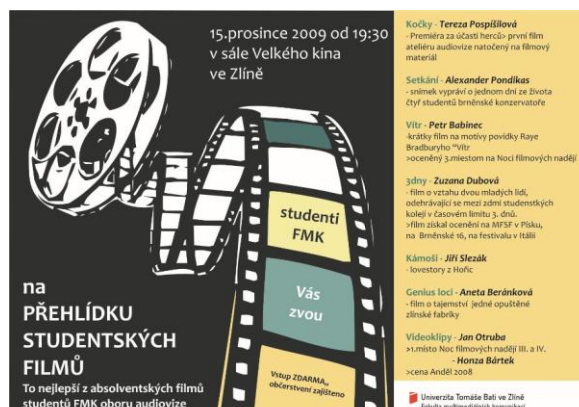
Obrázok 17.: ukážka pozvánky na premiéru

Po skončení premiéry sme zozbierali vopred pripravené anketové lístky a do nasledujúceho dňa som ich vyhodnotil. V ankete sme sa pýtali na najlepšie filmy premiéry a chceli sme zistiť koľko zo zúčastnených bolo z akej fakulty a podobné štatistické informácie (obr. 18).