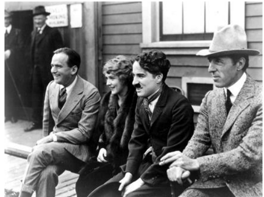
Obrázok 4.: štvorica zľava: Fairbanks, Pickford, Chaplin a Griffith.

(1912), ktorú založil distribútor a prevádzkovateľ kín William Fox, spoločnosť Metro-Goldwyn-Mayer vznikla spojením produkčných spoločností Metro Pictures Corporation a Goldwyn Pictures. Ďalším gigantom boli bratia Warneroví, ktorých spoločnosť s názvom Warner Brothers pohltila First National a Vitagraph. Spoločnosť RKO koncom 50. a začiatkom 60. rokov zanikla v prospech televíznej tvorby. Päťicu najproduktívnejších produkčných spoločností uzatvára Paramount, ktorá oficiálne vznikla v roku 1927 a 1935 bola premenovaná na Paramount Pictures. Táto slávna päťka bola monopolom, ktorému patrilo viac ako 90% svetovej filmovej produkcie a nie nadarmo bola nazývaná „The Big Five Studios“. [16]