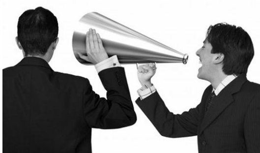
Obrázok 13.: komunikácia

Kameňom úrazu často býva nedostatočná komunikácia a to nielen medzi hlavnými profesiami navzájom, ale aj medzi produkciou filmu a vedením školy. Podľa študentov by sa malo stať pravidlom, že by produkční podávali pravidelné správy, v ktorých by stálo, aké majú plány na najbližšie obdobie a ako sa im podarilo splniť plány z minulého. Tieto správy by zahŕňali dlhodobé a krátkodobé plánovanie a taktiež by boli študenti hodnotení za dodržiavanie vopred určených termínov.