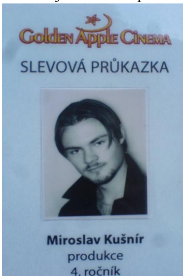
Obrázok 21.: ukážka študentského preukazu do kina

Ako to už medzi študentmi býva, často som pomáhal spolužiakom na ich malých, či veľkých projektoch len tak ako šofér alebo pomocník výpravy. Myslím, že takéto nakrúcania dajú človeku z produkcie možnosť nahliadnuť na túto prácu z iného uhla.