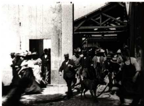
Obrázok 1.: ukážka z filmu „Odchod z Lumierových Tovární“

História filmovej produkcie je taká stará ako je film samotný. Jeho počiatok datujeme na koniec devätnásteho a začiatok dvadsiateho storočia. Pri jeho zrode stál Thomas Alva