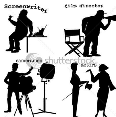
Obrázok 7.: filmový štáb

Najdôležitejšou osobou v produkcii filmu je producent alebo výrobca audiovizuálneho diela. Ten je pri zrode myšlienky a zabezpečuje hlavné funkcie vo výrobnom procese. Vo väčšine prípadov sú to výrobné štúdiá, no nájdu sa aj jednotlivci. Producent spravuje všetky práva, ktoré sú potrebné na výrobu filmu. 5 [8, s. 216]