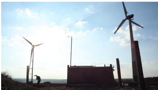
Obrázok 19.: ukážka z filmu Mlýn

Od začiatku tohto projektu som bojoval s nedostatkom financií na jeho realizáciu. Z fondu nám bola poskytnutá len polovica potrebného rozpočtu. Film som dofinancoval vďaka štedrým sponzorom, ale aj veľmi ochotným ľuďom z mesta Potštát, kde sme realizovali nakrúcanie.