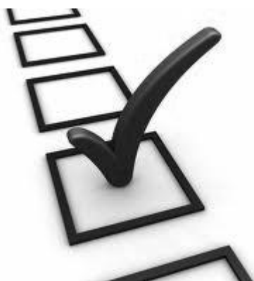
Obrázok 11.: prieskum

Do prieskumu som zahrnul šesť študentov ateliéru audiovizie a animácie, ktorí na škole pôsobia viac ako tri roky a za tú dobu mali možnosť a priestor sa dokonale oboznámiť s priebehom produkcie na ateliéry. Respondenti boli študentmi nielen produkcie, ale