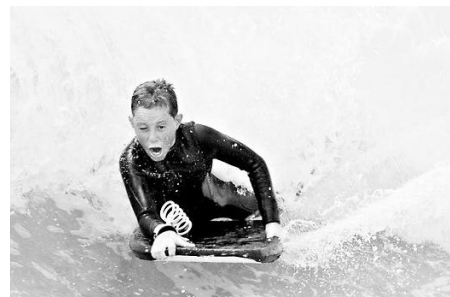
Obrázok 10.: nadšenie

Často som sa pri študentských projektoch stretol s prvotným zápalom do projektu, no ako náhle sa objavili prvé komplikácie a potreba riešiť rôzne problematické situácie, ktorým sa nedalo predísť v prípravách 26 , nadšenie opadlo a produktivita práce sa rapídne znížila.