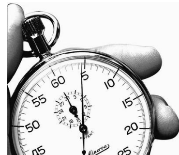
Obrázok 14.: časový manažment

Jednou z najfrekvencovanejších výhovoriek študentov je, že nemajú dostatok času, aby mohli urobiť to alebo tamto, lebo práve robia niečo iné. Potom sa stáva, že daná osoba časom začne na všetky požiadavky odpovedať rovnako, že jednoducho nemá čas a nestíha. A keď sa pozrieme na výsledky, často ich nevidíme.