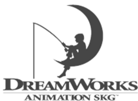
Obrázok 5.: Logo DreamWorks

niekedy prevahu, nad menami a tradíciou samotných produkčných spoločností, čo sa prejavilo odchodom Spielberga z Universal a založením DreamWorks SKG (obr.5).