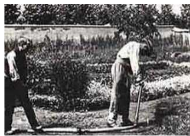
Obrázok 2.: z filmu „Pokropený kropič“

Ďalším významným filmom je „Pokropený Kropič“ (obr.2) je to prvý filmový gag, ktorý otvoril cestu nielen komédii, ale aj hranému filmu.