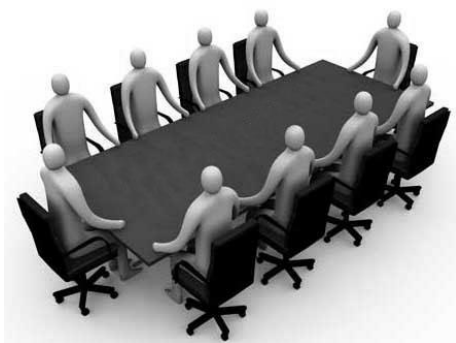
Obrázok 9.: výber tímu

Správny výber štábu by som podčiarkol ako problém číslo jedna. Tento bod zahŕňa ako výber hlavných profesií, tak aj následný výber asistentov a pomocných funkcií. Na začiatku tohto procesu stojí producent ako iniciátor. Svojich asistentov si väčšinou vyberá každá hlavná profesia zvlášť.