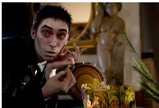
Obrázok 20.: ukážka z nakrúcania projektu „Azrael a Jack“

Slovo dalo slovo a dohodli sme sa na výrobe nášho spoločného magisterského filmu na motívy hororovej poviedky amerického spisovateľa. Spočiatku sme mali v pláne nakrútiť film presne podľa poviedky, no po nekorektnom prístupe zo strany majiteľa práv 39 sme sa rozhodli točiť na motívy.