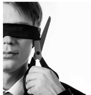
Obrázok 12.: vyhodnotenie prieskumu

Je zrejmé, že prípravám je nutné venovať vysokú pozornosť a čas. Čím lepšia príprava, tým je priebeh realizácie plynulejší a kvalita výsledného diela vyššia.