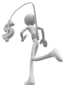
Obrázok 15.: motivácia

Existujú rôzne páky, ktorými sa dá dosiahnuť úspech a prosperita. Medzi najznámejšie patria: direktívne riadenie, autoritatívna výchova, psychický nátlak, fyzické násilie, ma-