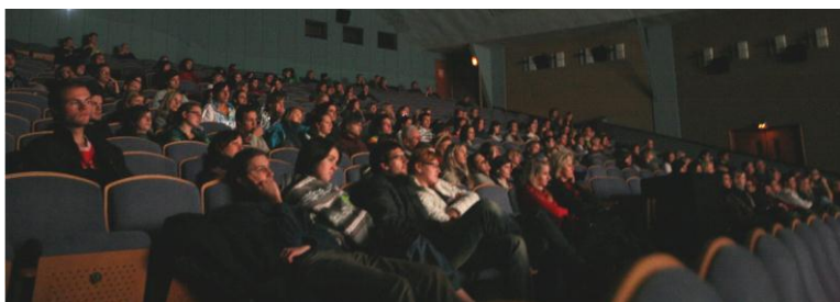
Obrázok 16.: fotografia z premiéry

Hneď po príchode na fakultu a po zoznámení so spolužiakmi som bol ako jediný produkčný magisterského štúdia oslovený spolužiačkou a režisérkou, ktorá v tom čase dokončovala svoj bakalársky film, či by som jej nepomohol s dofinancovaním a vedením dokončovacích prác na jej filme. Táto ponuka bola pre mňa výzvou a po nie dlhom premýšľaní som ju prijal.