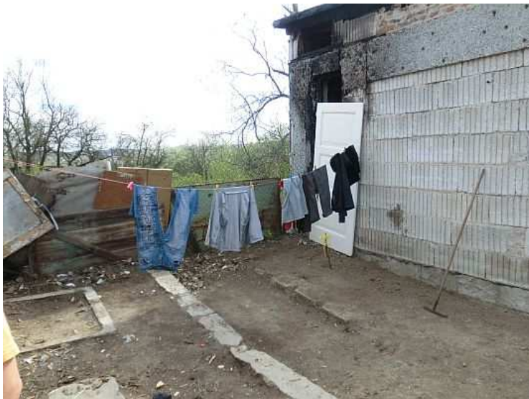
Dvorek. Foto V. Peterková, 2012.