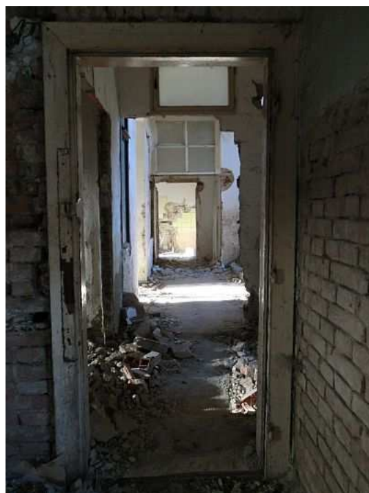
Vstup do chodby. Foto V. Peterková, 2012.