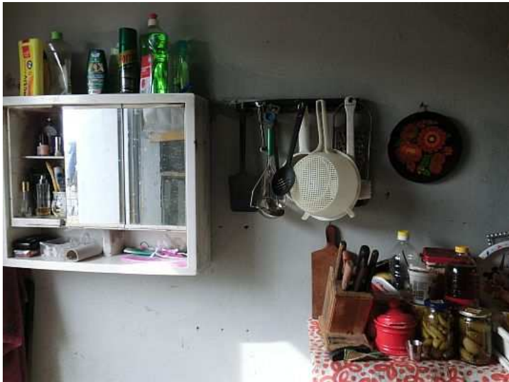
Detail části vybavení kuchyně a koutek pro hygienu. Foto V. Peterková, 2012.