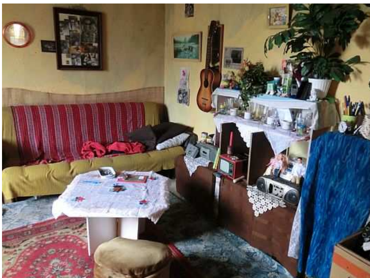
Druhá místnost – obývací pokoj a ložnice vjednom. Výměra asi 16 m 2 . Všude na stěnách visí rodinné fotografie. Foto V. Peterková, 2012.