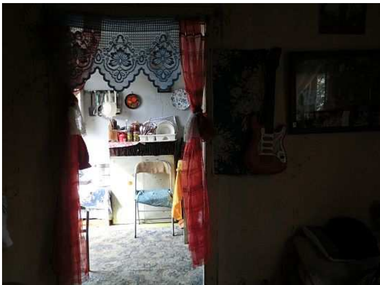
Průchod mezi oběma místnostmi – kuchyní a obývacím pokojem/ložnicí. Foto V. Peterková, 2012.