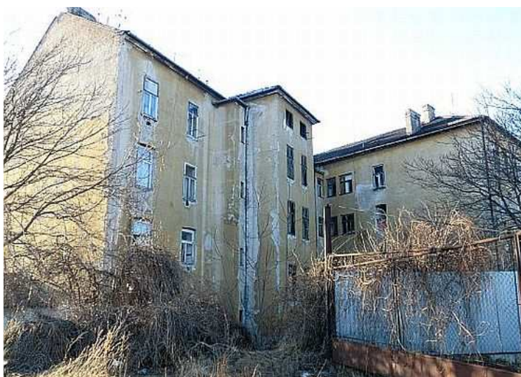
Squat v blízkosti centra Brna. Foto V. Peterková, 2012.