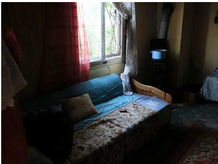
Druhá část obývacího pokoje s oknem se sušákem na prádlo a kamny v rohu místnosti. Foto V. Peterková, 2012.