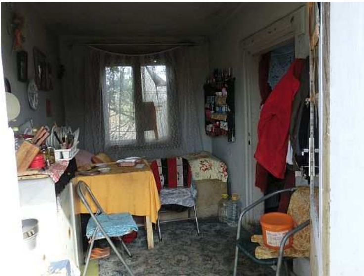
První místnost po vstupu do objektu. Slouží jako kuchyň s částí vyhrazenou pro denní hygienu. Výměra asi 8 m 2 . Foto V. Peterková, 2012.