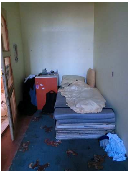
Pohled do původně zřejmě dětského pokoje výměry asi 10 m 2 . Improvizovaná postel sestává z několika kusů dveří. Foto V. Peterková, 2012.