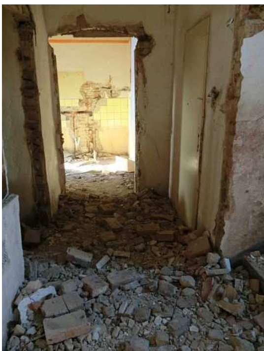
Chodba. Foto V. Peterková, 2012.