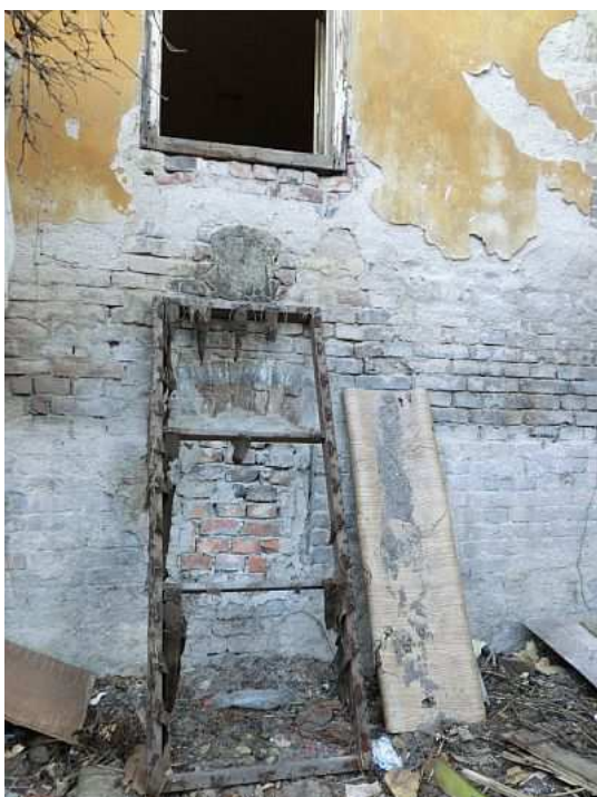
Vstup do objektu. Foto V. Peterková, 2012.