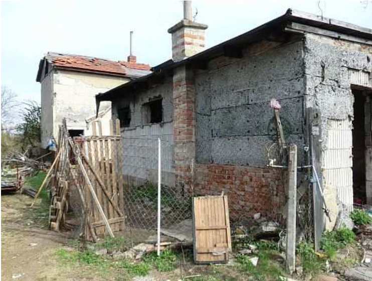
Částečně opravená, původně vypálená chata v okrajové lokalitě v rámci města Brna.