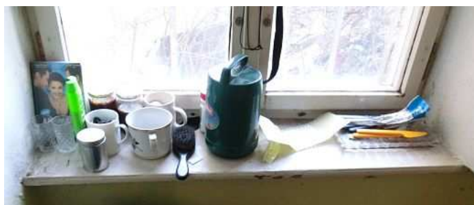
... a nezbytné předměty denní potřeby. Foto V. Peterková, 2012.