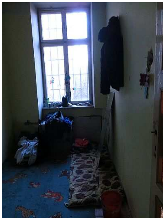
V pokoji pana Radka nechybí ani velké zrcadlo... Foto V. Peterková, 2012.