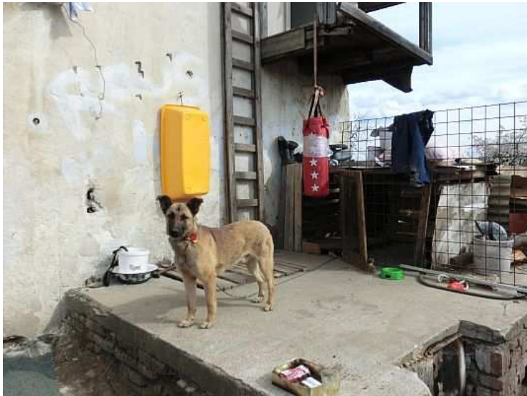
Na dvorku je kotec pro psa. Na stěně pak plastová vana pro osobní hygienu i na praní prádla.