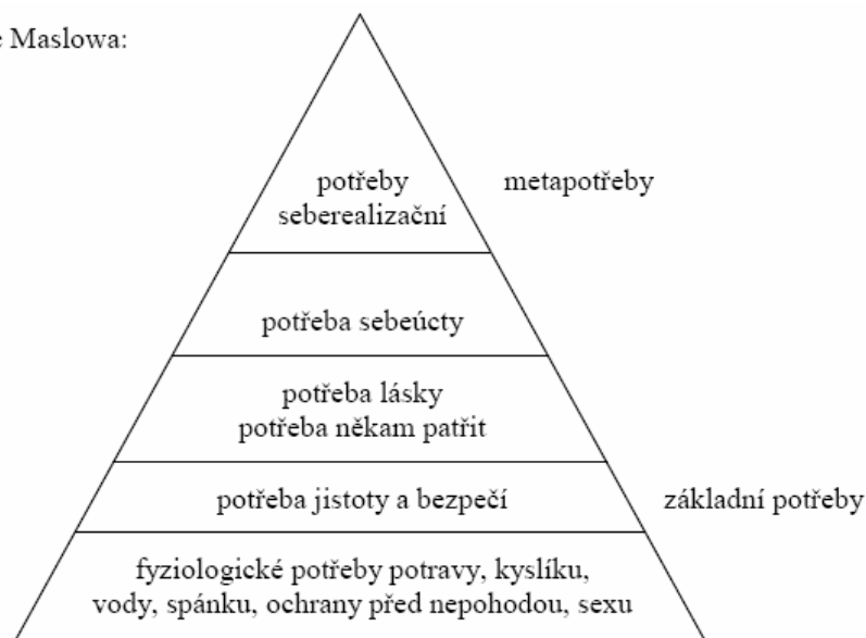
Dělení podle Maslowa:

Potřeba bydlení byla podle Bronisława K. Malinowského vždy uspokojována nejrůznějšími způsoby a vždy také v souvislosti s potřebami ostatními, nikdy tedy