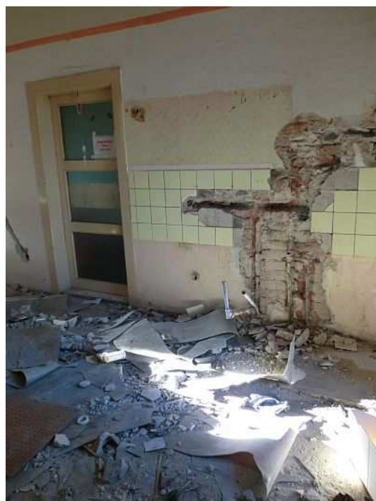
Před vstupem do pokoje, který pan Radek obývá. Foto V. Peterková, 2012.