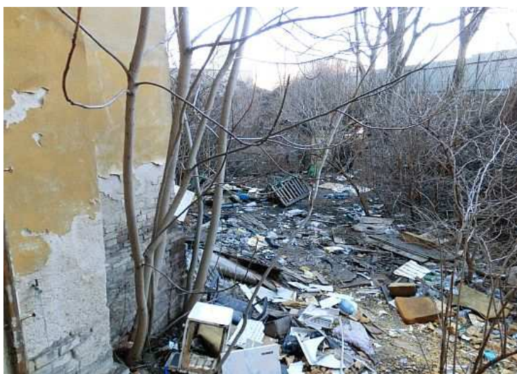
Bezprostřední okolí. Foto V. Peterková, 2012.