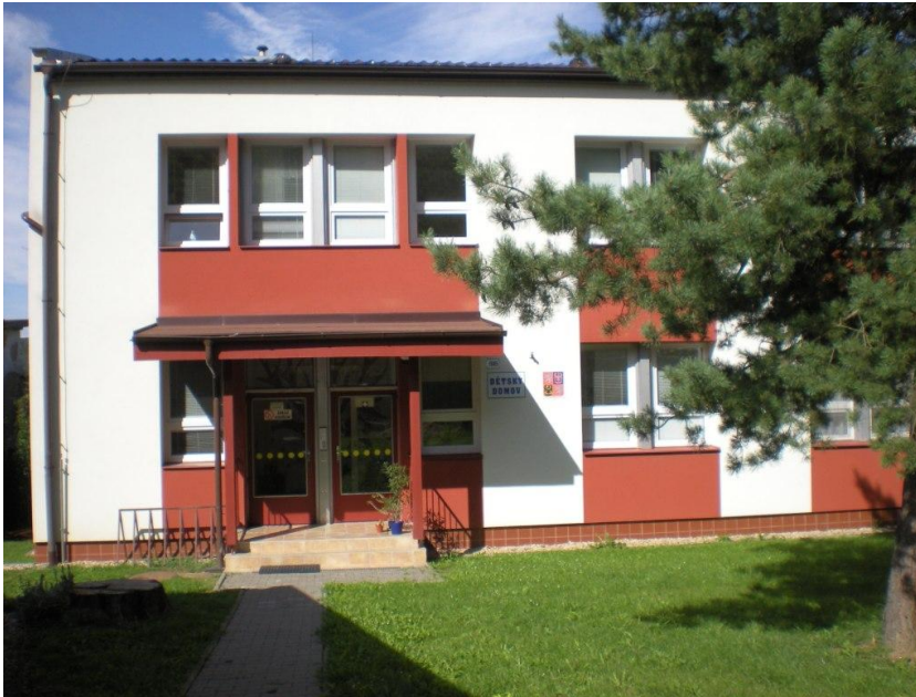
Obr. 1 – Dětský domov Tišnov