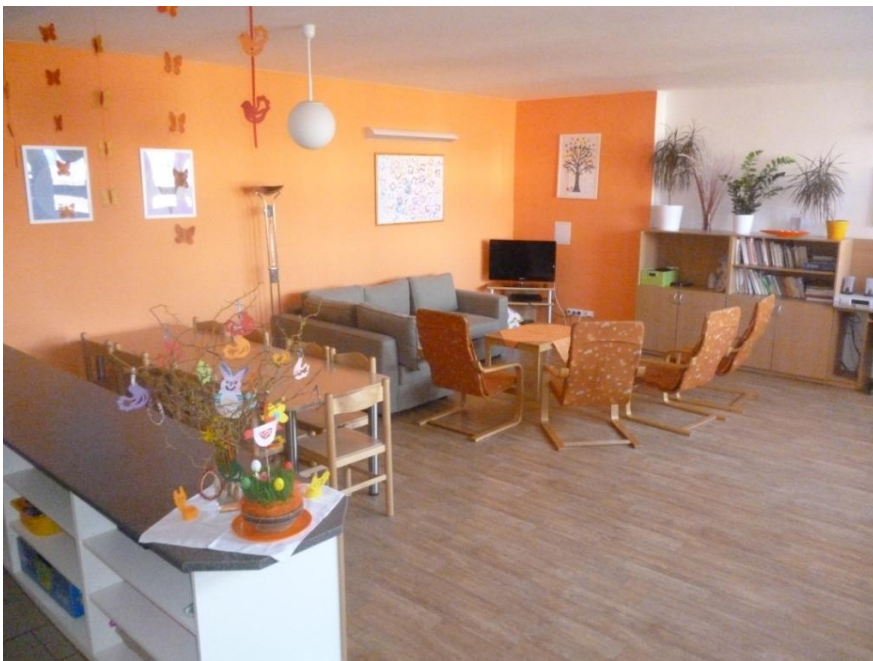
Obr. 4 – Obývací pokoj