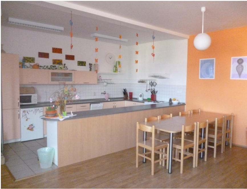
Obr. 3 – Kuchyň a jídelní stůl