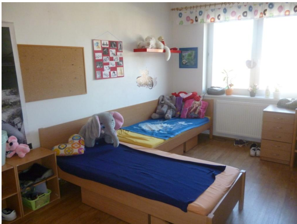
Obr. 5 – Dětský pokoj