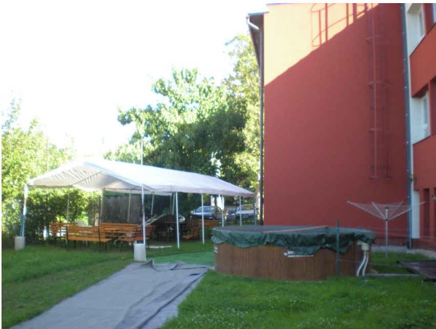
Obr. 2 – Venkovní posezení