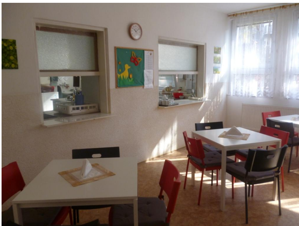
Obr. 6 – Jídelna