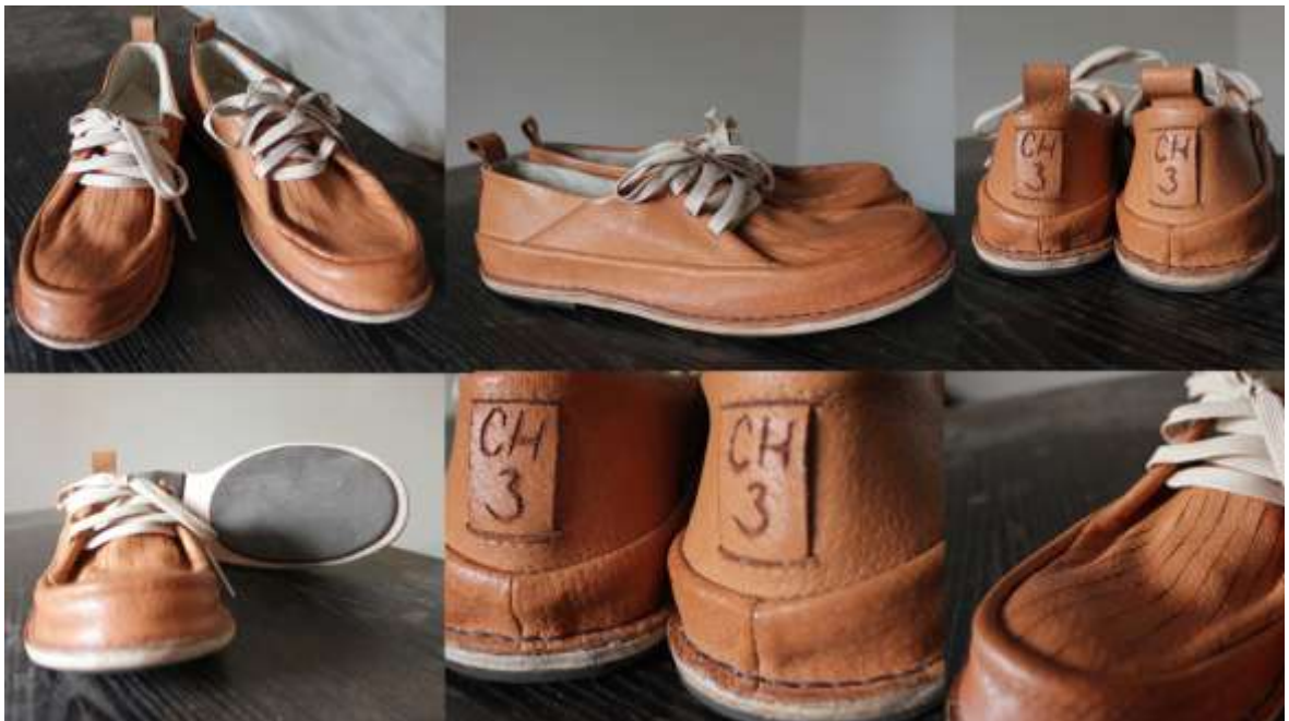
Obr. Model obuvi Ch 3