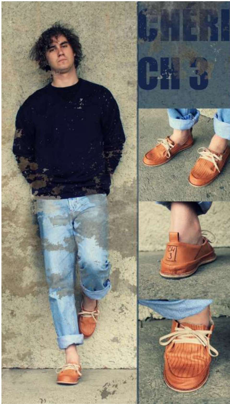
Obr. Model obuvi Ch 3