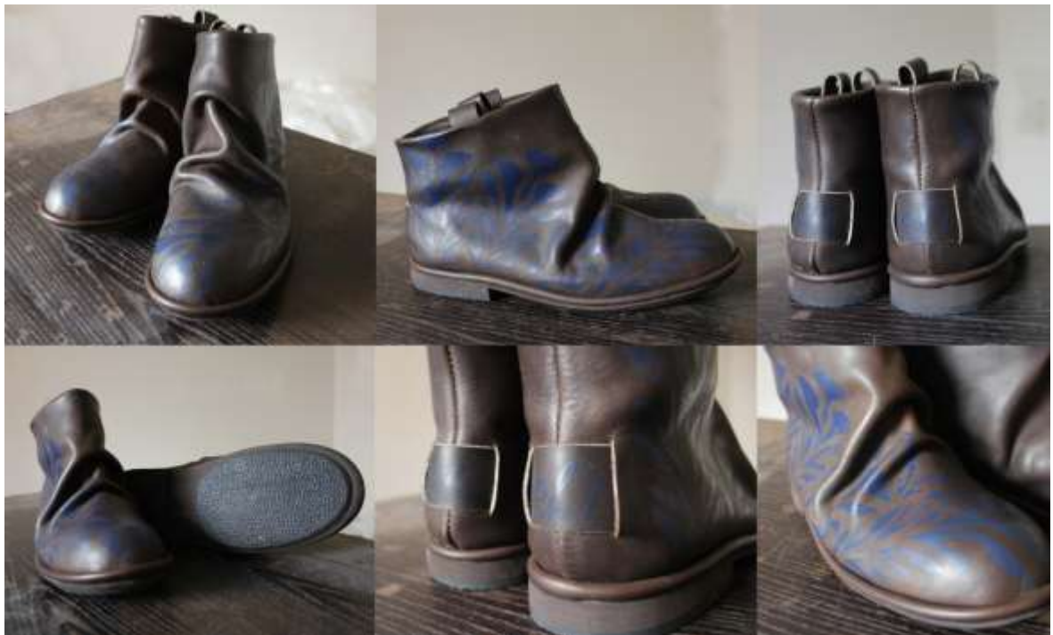
Obr. Model obuvi Ch 1