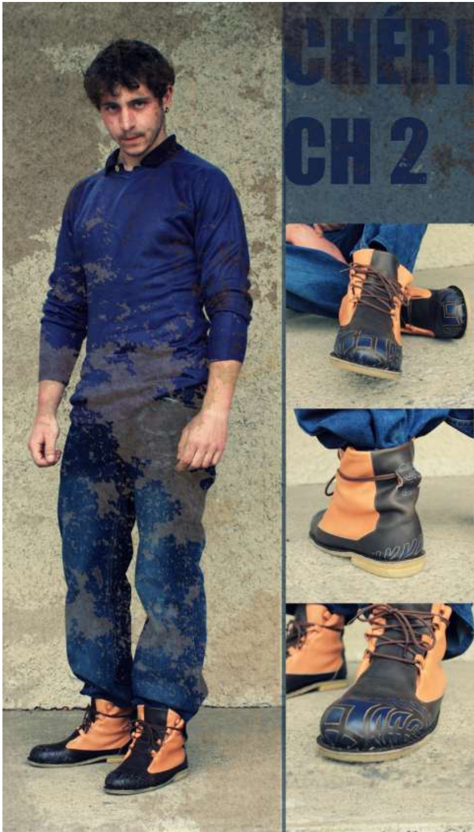
Obr. Model obuvi Ch 2