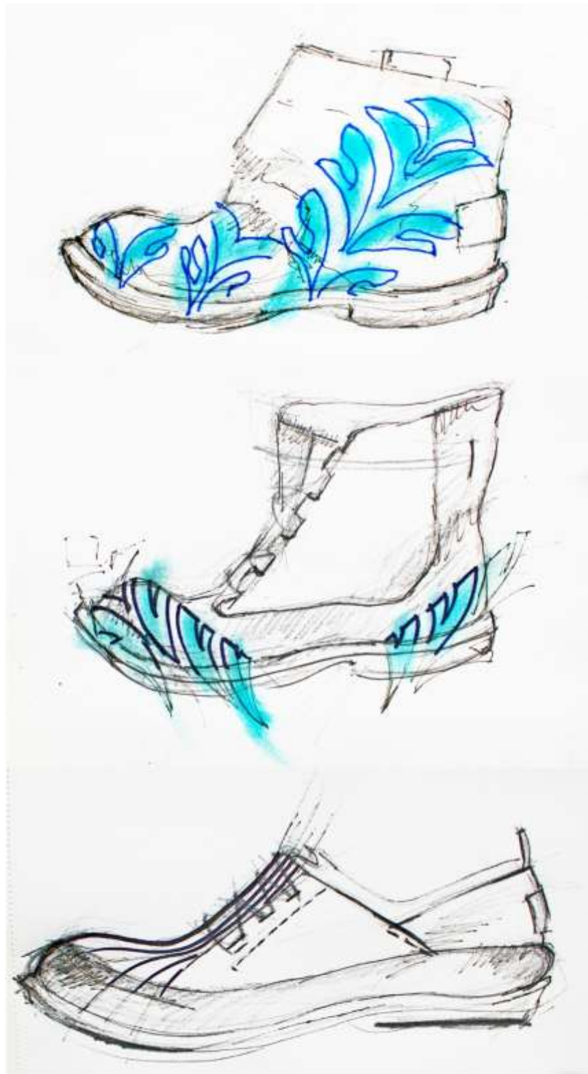
Obr. Návrhy modelů obuvi Ch 1, Ch 2, Ch 3