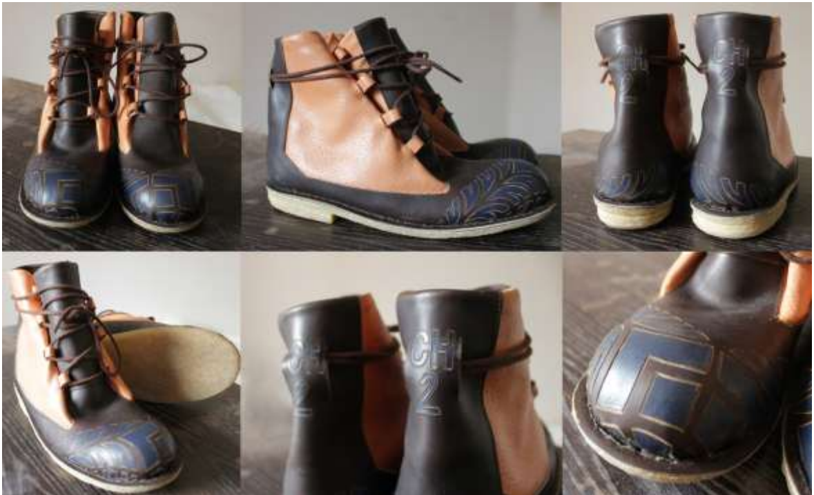
Obr. Model obuvi Ch 2