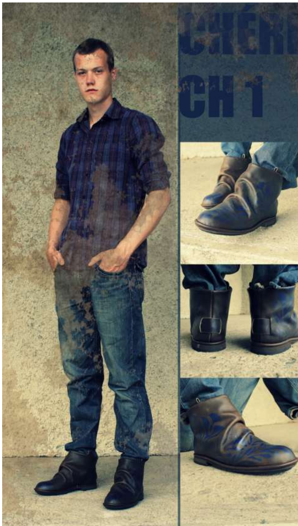
Obr. Model obuvi Ch 1