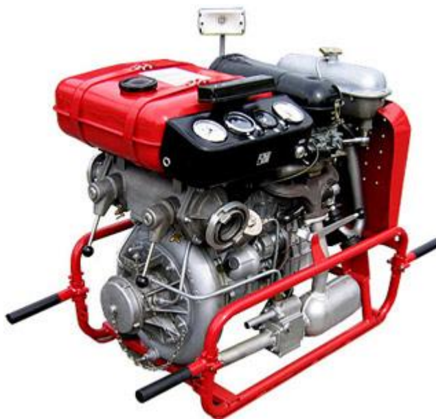
Obr. 1 – Motorová stříkačka PS12 [21]

Vyhláška č. 247/2001 Sb. uvádí, že jednotka kategorie JPO V musí být pro případ zásahu vybavena prostředky osobní ochrany a motorovou stříkačkou. Další věcné prostředky navíc jsou tedy čistě na libovůli obce. Ovšem dle názorů velitelů jednotek obcí Tučapy a Hlubočany se dnes motorová stříkačka hodí spíše pro čerpání vody a je vhodnější vlastnit cisternu, která se nejčastěji doplňuje pomocí plovoucího čerpadla. Nevýhodou stříkaček totiž je často jejich stáří (třeba i 30 let) a spolehlivost, která není 100%. Další nevýhodou je vysoká hmotnost (přibližně 200 kg) a nutnost mít zdroj vody (nejlépe rybník nebo nádrž).