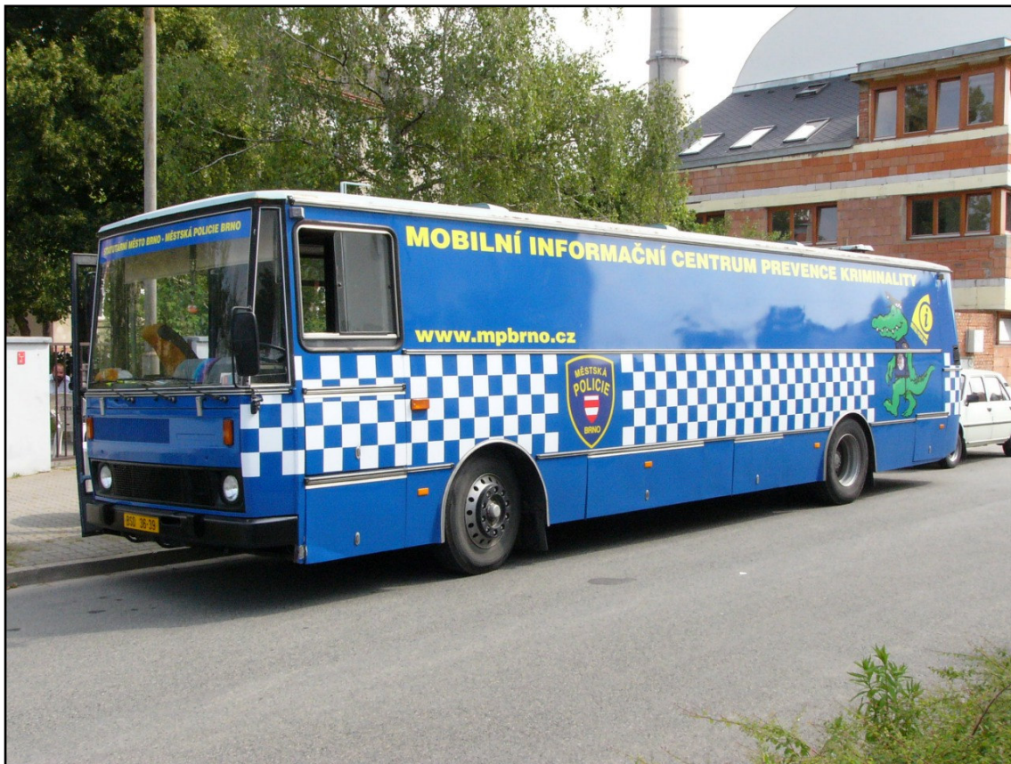
Příloha č. 2 - ilustrační foto k projektu MP Brno: Mobilní informační centrum prevence kriminality (vzhled autobusu, interiér)