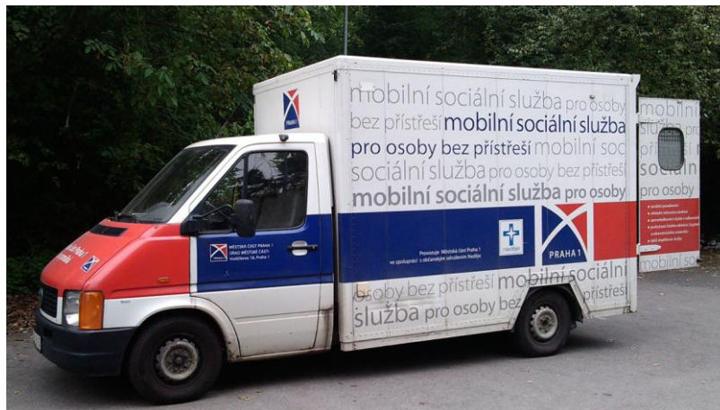
Obrázek 2 – Mobilní sociální jednotka, zdroj: L.K.

sociální politiky aktuálně přetransformován a rozšířen na pomoc lidem, kteří se náhle ocitli bez bydlení, lidem ztrátou bydlení přímo i nepřímou ohroženým, lidem dlouhodobě na ulici přežívajícími a mladé dospělé, kteří postrádají zázemí.