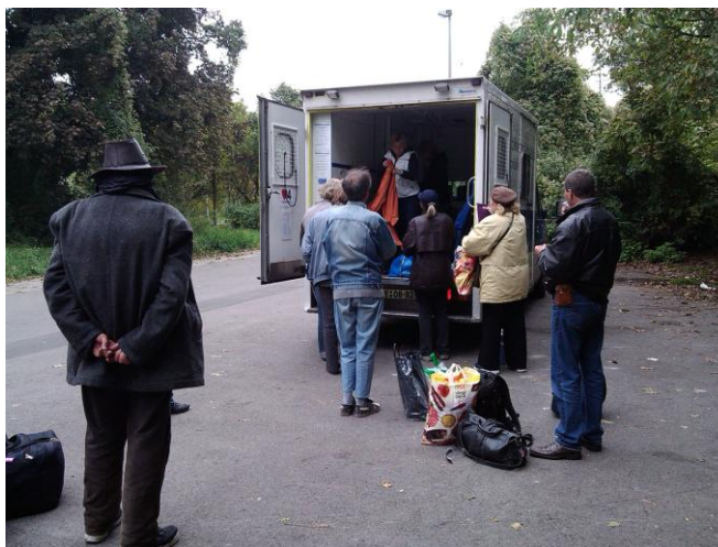
Obrázek 4 – výkon činností jednotky

místo, kde jsou opět poskytovány tyto služby. Po ukončení poskytování služeb v příslušném dni následuje kompletní dezinfekce a úklid vozu a následně jsou pracovníky jednotky zpracovány všechny vzniklé záznamy jejich sociální práce a zdravotnického ošetření, jejichž výstup je zdrojem pro vedení nutné statistiky.