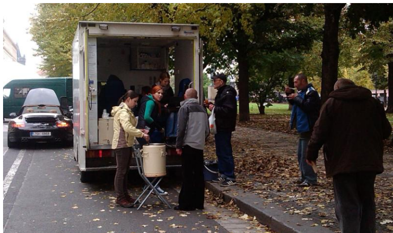
Obrázek 3 – výkon činností jednotky

ho sociálního zařízení. Neposlední funkcí pracovníků této jednotky je také monitorování a vlastní vyhledávání klientů. V rámci této funkce je zjišťován především počet bezdomovců v dané lokalitě, jejich struktura, tj. pohlaví a věk a dále je sestavován přehled poskytovaných a žádaných činností a služeb.