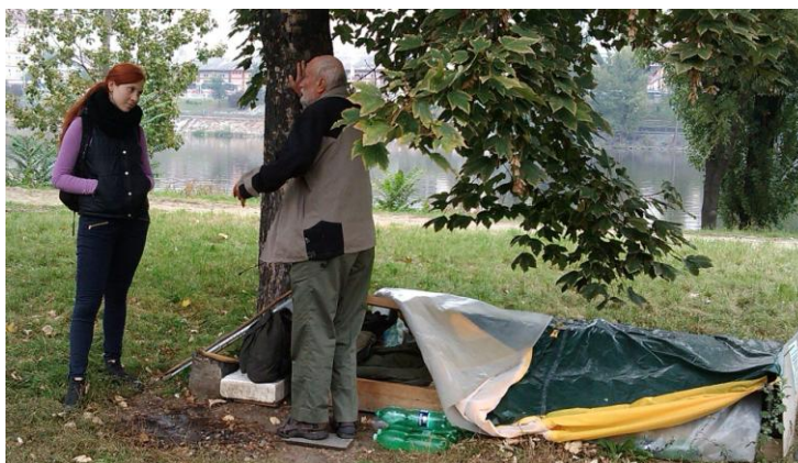
Obrázek 1 – terénní sociální pracovník

„Další metodou, která již přímo souvisí se sociální pedagogikou je streetwork, sociální pracovník pohybující se v prostředí zejména sociálně znevýhodněných skupin, především dětí a mládeže“ (Gulová, 2011, s. 58).