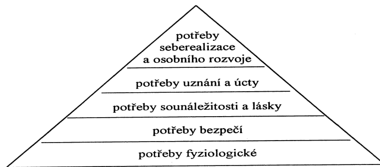
Obrázek 1.: Maslowova pyramida potřeb