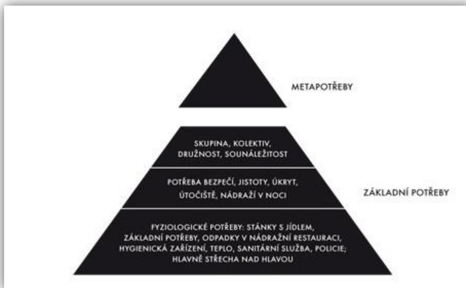
Obr. 2 Pyramida potřeb uzpůsobená potřebám bezdomovců

Pyramida potřeb, která je uzpůsobená potřebám bezdomovců, nám poté ukazuje hierarchii, kde na prvním místě je uspokojení fyziologických potřeb, následuje potřeba bezpečí a jako poslední jsou uspokojovány potřeby sociální. K uspokojení vyšších potřeb potom nedochází vůbec.