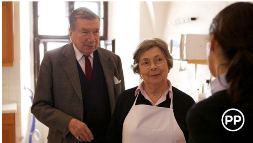
Obrázek 2 Ukázka piktogramu v televizi (Product placement na TV Barrandov, ©2008-2012)

Další podmínkou je fakt, že provozovatel musí po dobu prvních třech měsíců od zahájení vysílání pořadů s product placementem doplňovat piktogram vysvětlujícím textem, aby divák věděl, co piktogram znamená. Znění textu: „ Tento pořad obsahuje komerční sdělení ve formě umístění produktu za účelem propagace zboží či služeb. “ (Umístění produktu - product placement, 2010)