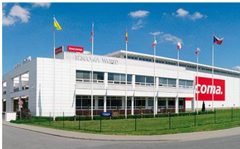
Obrázek 9 Tescoma World (Bzuket značky Tescoma, ©2011)

V roce 2001 započala stavba nového sídla společnosti, Logistického centra Tescoma WORLD. Po dokončení stavby v roce 2002, se tato budova stala světovou centrálou firmy. Stavba roku Zlínského kraje, to je titul, kterým se může pyšnit dominantní budova nacházející se v průmyslové části Zlína. V roce 2008 byla zahájena 2. etapa výstavby Logistického centra Tescoma WORLD. Kapacita tohoto centra pojme více než 30 tisíc skladových paletových míst. (O nás, © 2013)