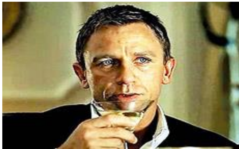
Obrázek 6 Aktivní využití produktu (When Product Placement Goes Too Far, James Bond 'Skyfall' Edition, ©2005-2013)

Produkt je aktivně využíván v rámci děje. Jedná se například o občerstvení, které je používáno hlavním hrdinou. Mobilní telefon, kterým právě telefonuje. Auto, které hlavní hrdina řídí. Jedná se o veškeré produkty, jejichž funkce je aktivně využívána.