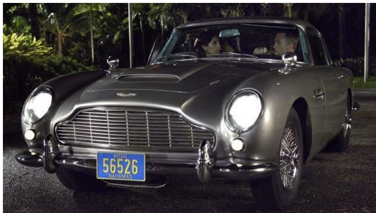
Obrázek 4 Dominantní záběr (The most unsubtle movie product placements, ©2013)

Dominantním záběrem se rozumí záběr na produkt v popředí tak, že produkt zabírá větší část televizní obrazovky a tudíž je divákem identifikovatelný.