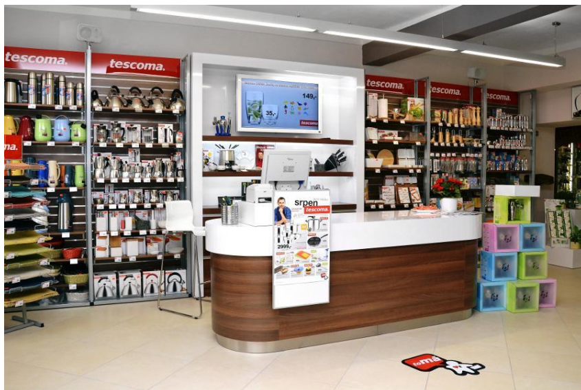
Obrázek 11 Prodejní centrum Tescoma

Veškerý koncept všech prodejních center je čistě ve vlastní režii společnosti, která určuje a vytváří design těchto prodejen. (Interní zdroj společnosti)