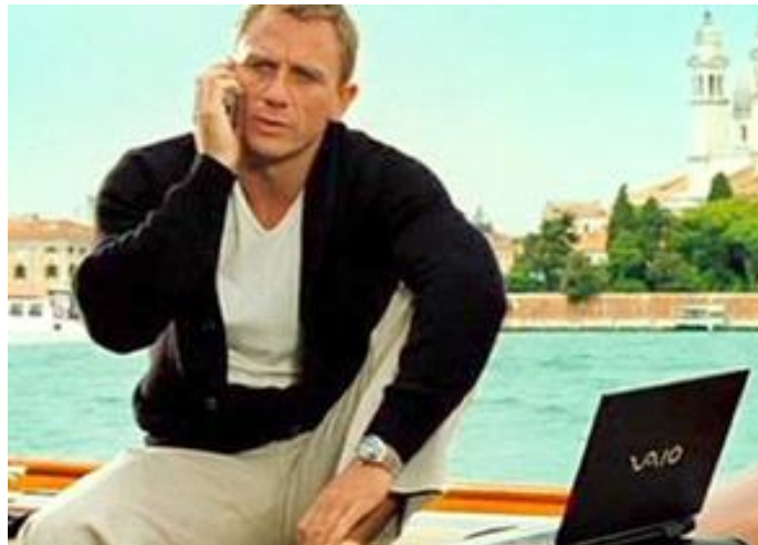
Obrázek 7 Pasivní využití produktu (James Bond, Product placement and the not-so innocent Quickie, 2011)

Produkt je součástí děje, nemanipuluje se s ním. Jako příklad můžeme použít lahev konkrétní vody, kterou má moderátor postavenou na stole. Může se jednat o budovu, obchod, domácí spotřebiče, které stojí staticky na místě. Patří sem také auto, které je zaparkováno, tudíž se s ním nehýbá.