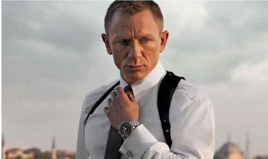
Obrázek 5 Nedominantní záběr

Jedná se o nepřímý záběr na produkt, který je v pozadí a zabírá menší část televizní obrazovky. Jeví se jako přirozená součást záběru, produkt zde neruší a některý divák ho ani nepostřehne.