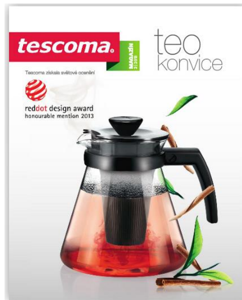
Obrázek 10 Letní vydání magazínu Tescoma

Společnost Tescoma vydává svůj vlastní magazín. Náplní magazínu jsou recepty, představení novinek společnosti a rozhovory se známou osobností. Tyto magazíny firma rozesílá svým V.I.P. zákazníkům a členům Tescoma klubu. Jsou k dispozici také v prodejních centrech Tescomy.