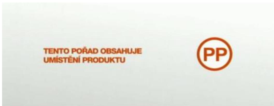
Obrázek 3 Vysvětlující text k piktogramu (Česká televize a Prima uvedly product placement do praxe, ©2005 – 2013)

Další podmínkou je fakt, že provozovatel musí po dobu prvních třech měsíců od zahájení vysílání pořadů s product placementem doplňovat piktogram vysvětlujícím textem, aby divák věděl, co piktogram znamená. Znění textu: „ Tento pořad obsahuje komerční sdělení ve formě umístění produktu za účelem propagace zboží či služeb. “ (Umístění produktu - product placement, 2010)