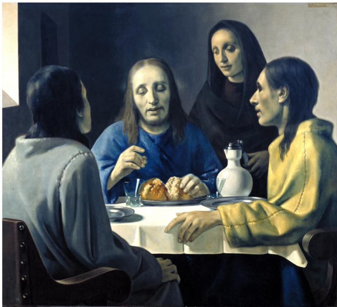
Obr. 3 Meegeren, padělek holandského mistra Jana Vermeera