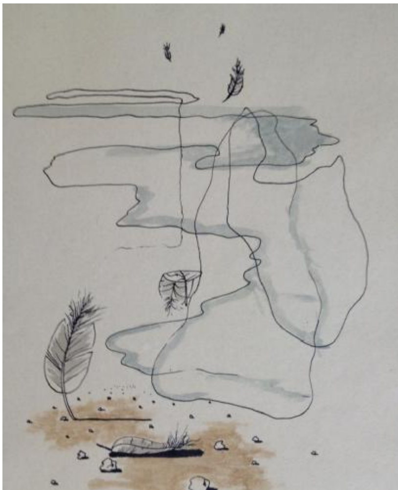
Obr. 2 Toyen, padělek nabízený organizovanou skupinou jako originál, zabavený Policií ČR ve známé kauze