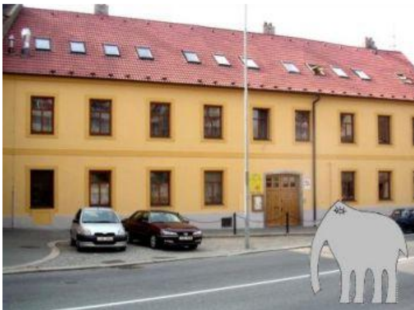
Obrázek 1: První budova školy na ulici Cyrilometodějská v Třebíči 49