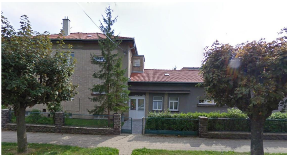
Obrázek 2: Druhá budova školy na ulici Zahradníčkova v Třebíči 50