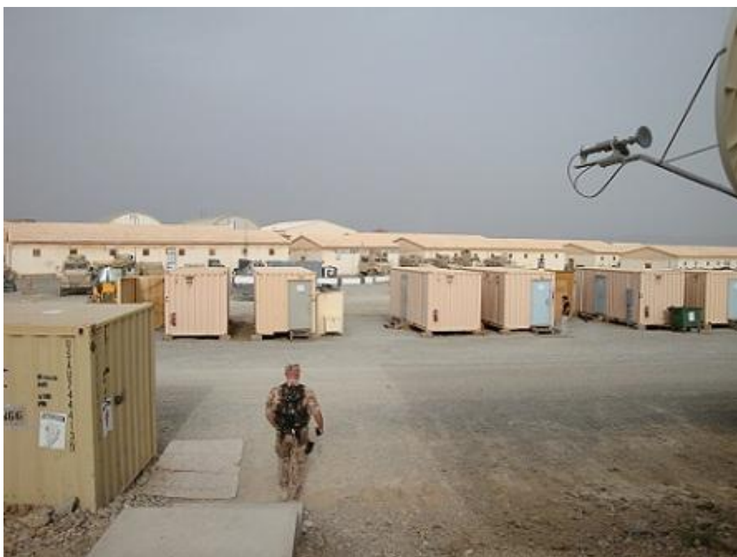
Obrázek 9 V těchto kontejnerech byly umístěny umývárny a WC