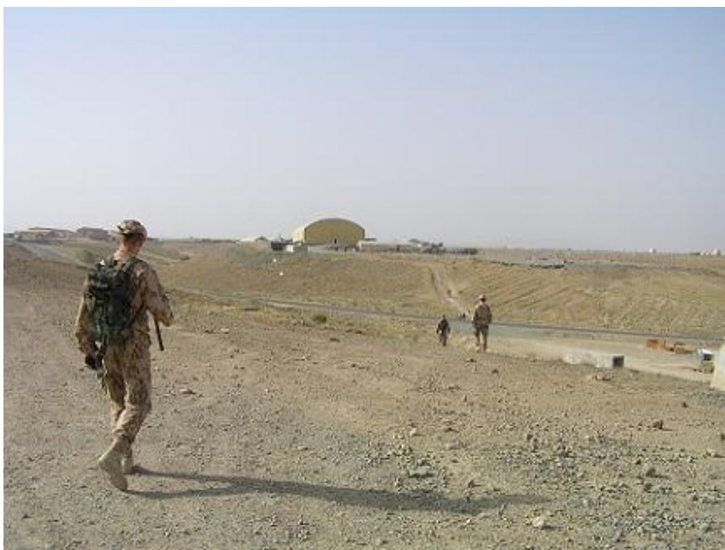
Obrázek 13 V dálce hangár HIPPO pro vrtulníky a prašná cesta k němu