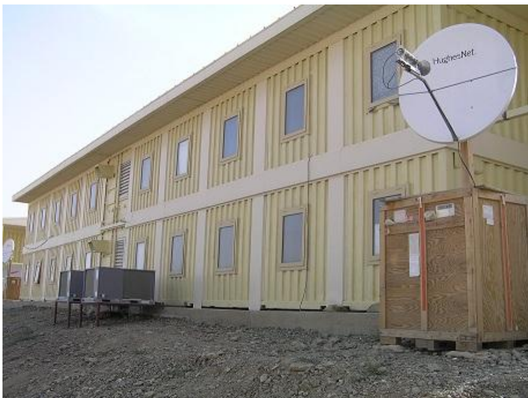
Obrázek 8 Nejluxusnější forma ubytování v Afghánistánu, Korimek