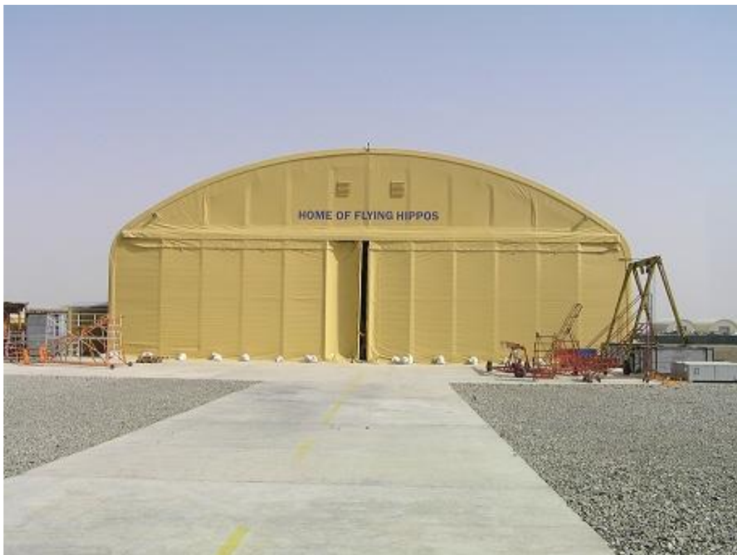
Obrázek 14 Mobilní pracoviště hangáru HIPPO pro vrtulníky