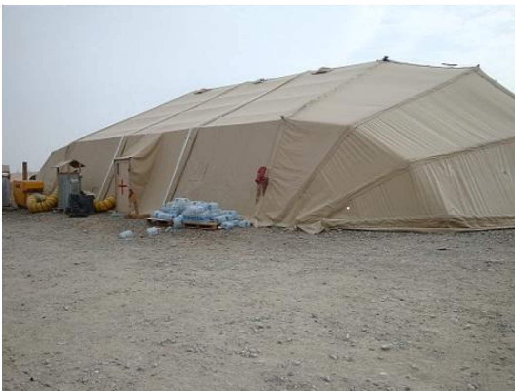
Obrázek 11 Nemocniční stan a všudypřítomná balená voda