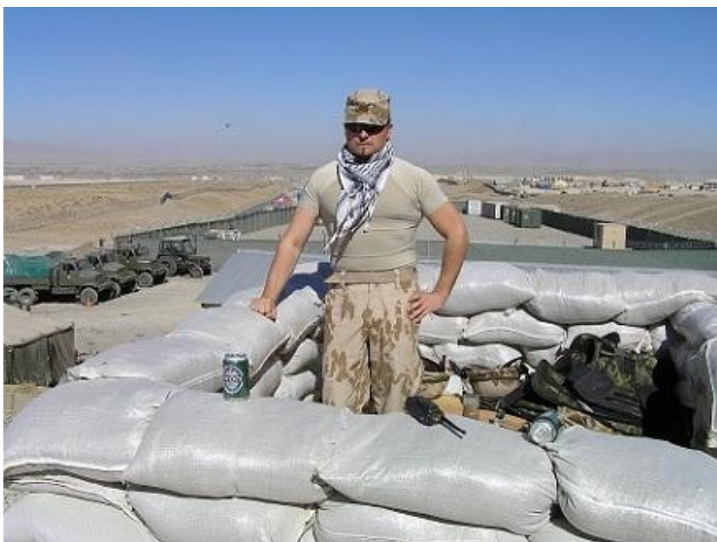
Obrázek 2 Hlídka na strážním stanovišti, Afghánistán 2011