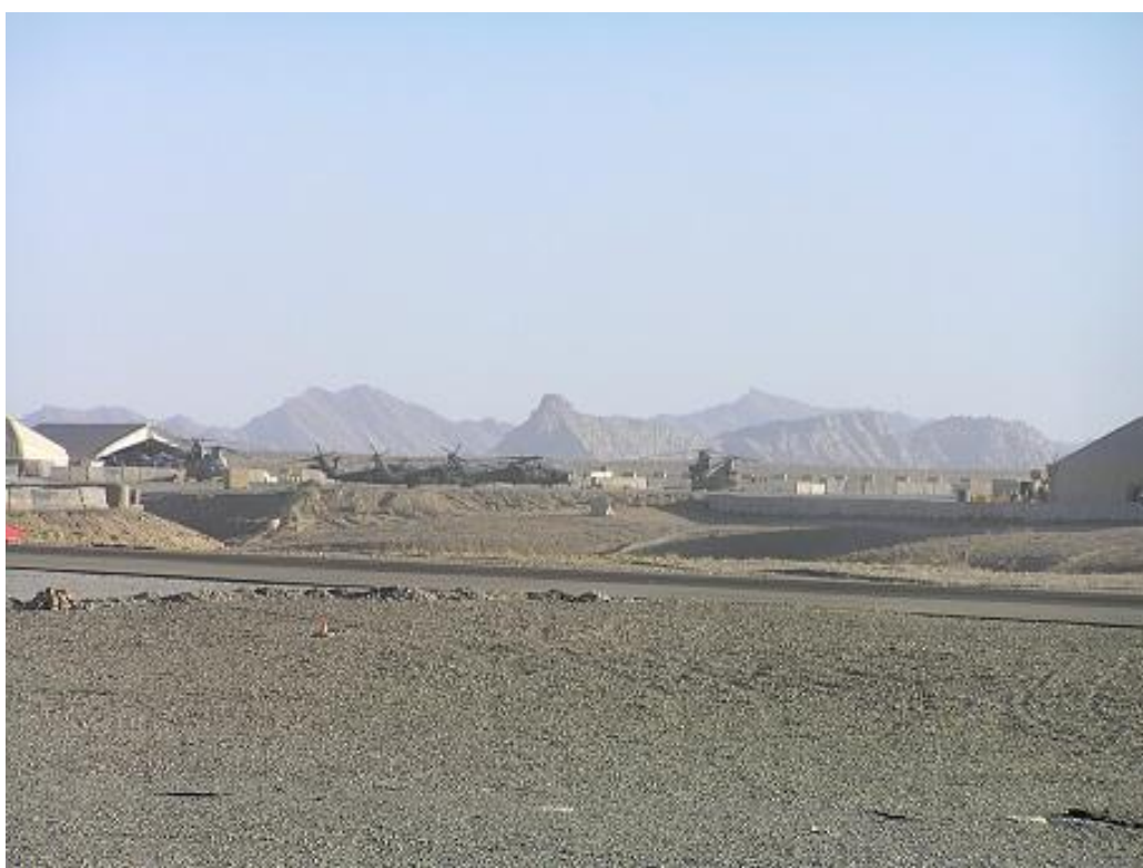
Obrázek 4 Přistávací dráha letiště na náhorní plošině v Afghánistánu