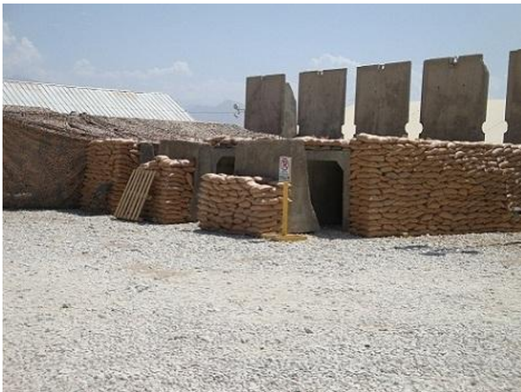
Obrázek 3 Úkryt pro vojáky při raketových útocích