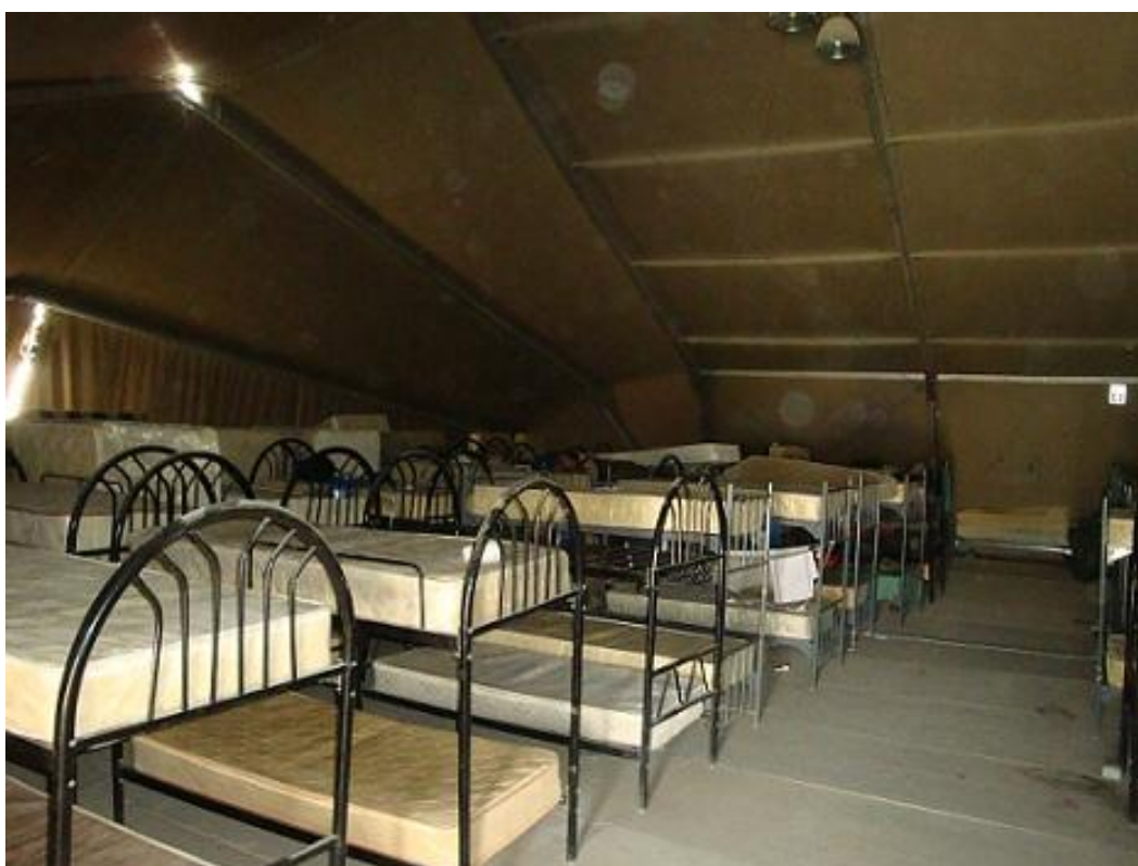
Obrázek 7 Řady patrových postelí uvnitř tranzitního stanu