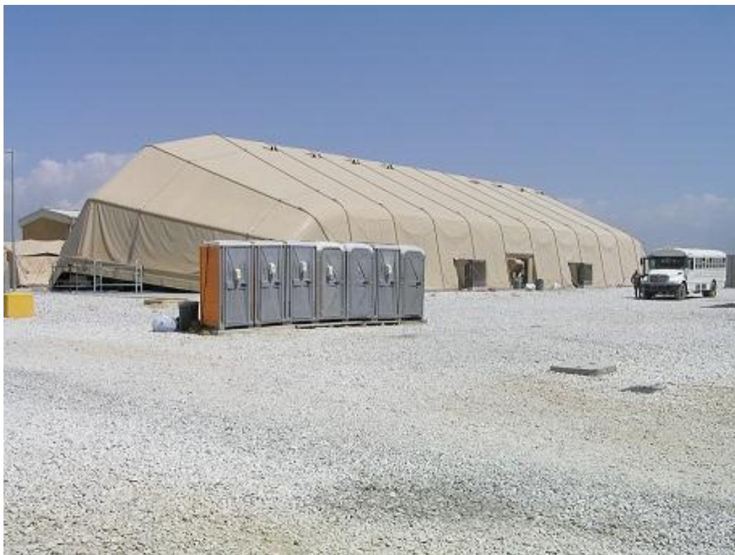
Obrázek 6 Tranzitní stan (clamshell) pro cca. 400 osob