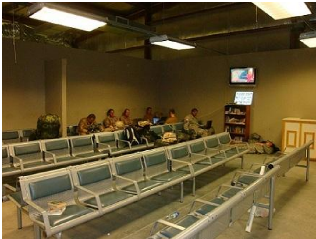
Obrázek 5 Dlouhé čekání na letadlo v odletové hale letiště