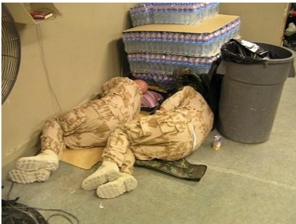
Obrázek 6 Každá chvílka klidu je vojáky přijímána s povděkem