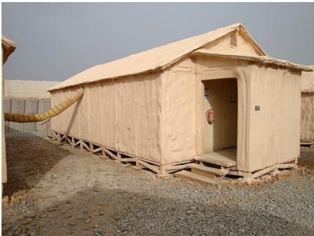
Obrázek 10 Běžná forma ubytování v Afghánistánu, B-Hutt