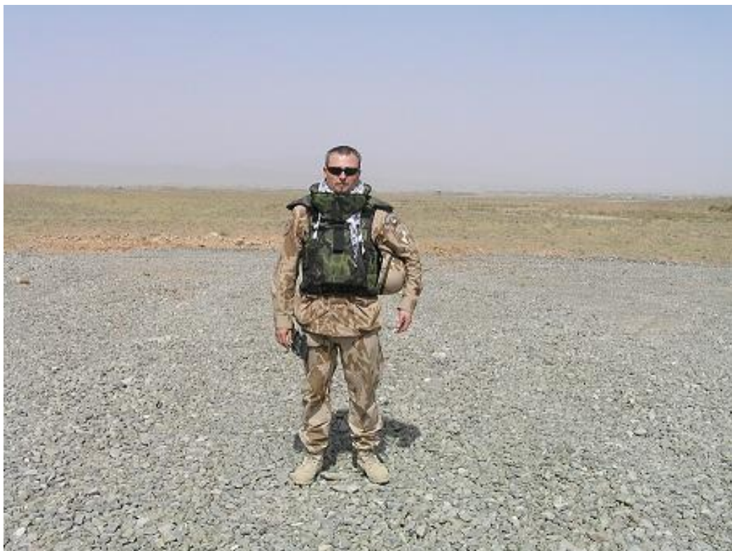
Obrázek 1 Autorova poslední mise, Afghánistán 2011