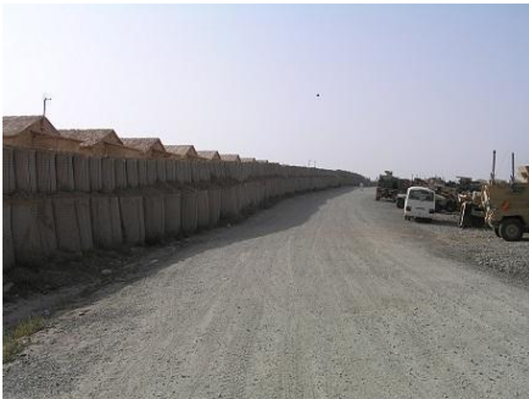
Obrázek 12 Ochranná stěna (Defend wall), chránící ubytovny