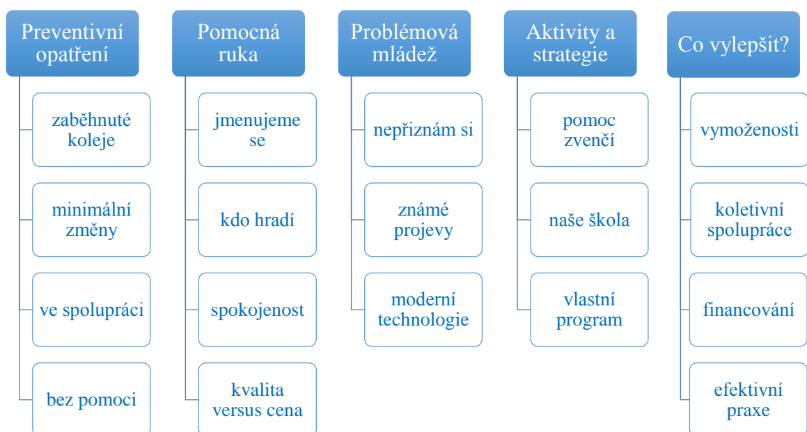
Obrázek 3: Schéma kategorií a kódů

Dále byl vytvořen seznam jednotlivých kódů, které byly na základě jejich podobnosti zařazeny do kategorií. Celé schéma si představíme níže.