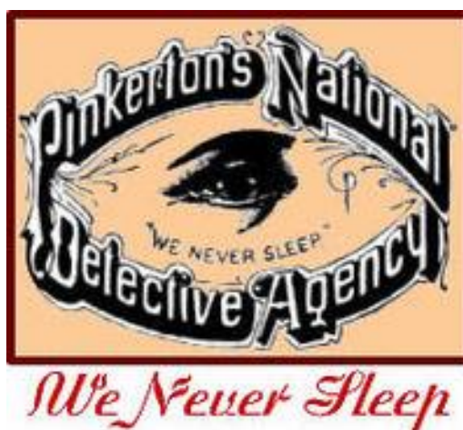
Obrázek 2 – Logo Pinkertonů

Byly to Spojené státy, které posunuly vývoj razantněji a tou osobou, byl Skot Allan Pinkerton. Pinkerton založil svou Pinkerton national detective agency v roce 1850.