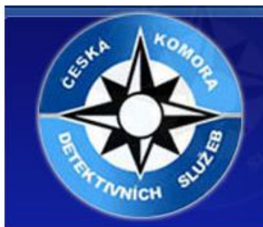
Obrázek 8 – CKDS - logo