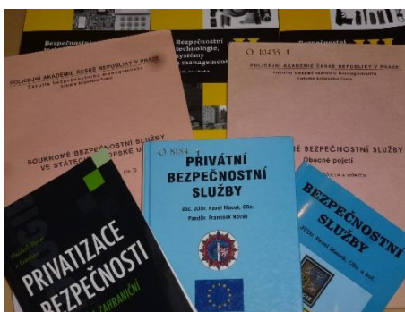
Obrázek 5 – některé z knih o soukromých službách

Předkladatel této bakalářské práce si kladl za cíl nalézt co nejvíce informací, které by mohly do budoucna pomoci dalším při zorientování se v oboru. Hledání se samozřejmě vztahovalo na vydané knihy, na studentské práce i na informace existující pouze v elektronické podobě na internetu. Nakolik se to dá uskutečnit je otázkou, ale přehled vychází z knihoven, internetových vyhledávačů i z rad lidí z oboru.