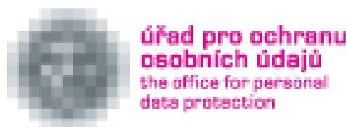
Obrázek 11 – UOOU - logo

Často zmiňovanou slabinou nového zákona je nemožnost soukromých bezpečnostních služeb nahlížet do evidence obyvatel. Hlavním protestujícím proti této možnosti je Úřad na ochranu osobních údajů.