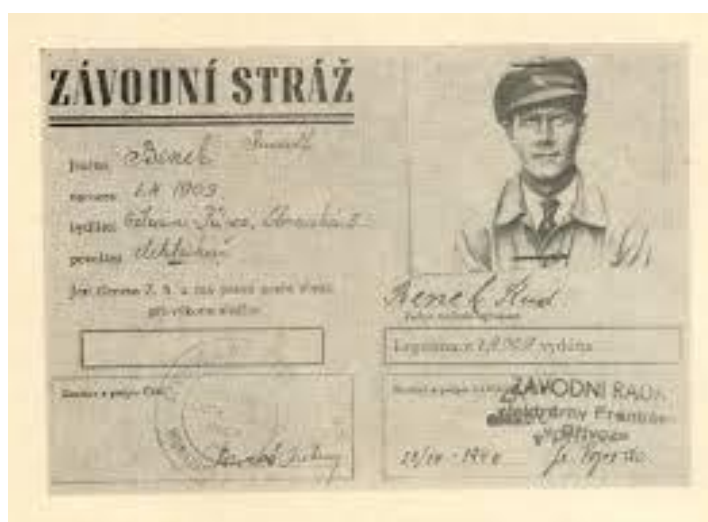
Obrázek 4 – Závodní stráž

Únor 1948 znamenal obrovský zlom ve vývoji státu a tím i v soukromém podnikání, o existenci soukromých bezpečnostních služeb se tedy rozhodně nedalo ani uvažovat. Zajímavou otázkou je, zda vzniklé Lidové milice a ozbrojené závodní stráže můžeme počítat mezi soukromé bezpečnostní služby. Lidové milice asi ne, to byla ozbrojená složka jedné politické strany, ale závodní stráž jednoho konkrétního podniku, muži určeni k ochraně areálu, zboží v něm, případně chránící know-how? Zde by se o pseudo-soukromé služby jednalo, výplatu dostávali od vedení firmy, ale na druhou stranu, majetek byl „všech.“