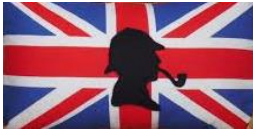
Obrázek 12 – Sherlock Holmes

V praktické části, v porovnání jednotlivých zemí z hlediska existence zákona o soukromých bezpečnostních službách, se ukázalo, že Velká Británie nemá zákon o SBS.