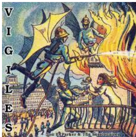
Obrázek 1 - Vigiles

Starověký Řím je tedy doba, kdy vznikají první jednotky, které slouží ochraně a obraně osob, které nejsou zřízeny státem, ani obcí, ale jsou soukromé a za odměnu se nechávají najmout tím, kdo zaplatí. Nazývají se Vigiles.