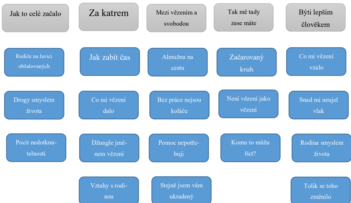
Obrázek 1 Schéma kategorií a kódů

V následující kapitole se budeme dále zabývat analýzou dat, jež byla získána pomocí polostrukturovaných rozhovorů s opakovaně odsouzenými vězni. Metodou analýzy dat je pro účely našeho výzkumného šetření zvoleno otevřené kódování, kdy byly nejprve v textu barevně označeny jednotlivé kódy a následně pak vytvořeny i kategorie. Pro lepší přehled jsme vytvořili níže uvedené schéma.