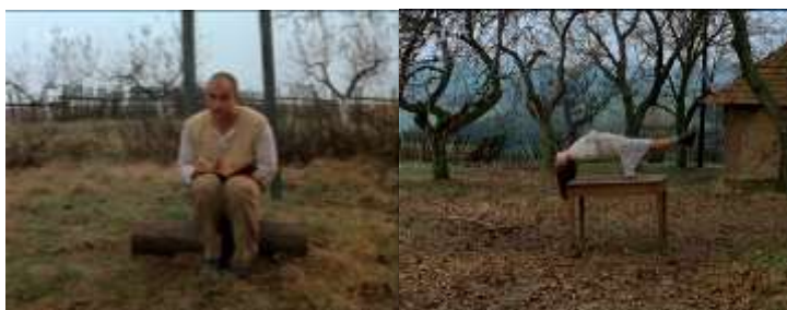
Obrázok 27 Sloboda žiť

každú jednu udalosť, ktorá prichádza. Dokonca ani Helenine vznášanie sa nad stolom mu nepríde zvláštne. Sám povie: „Však ona lieta“. Utvrďuje diváka v tom, ako bolo povedané v diagetickom komentári, ktorý prednáša Jakub na začiatku kapitoly: „Pomaly ma učí chápať všetky veci nepochopiteľné v našom svete reálnom.“ Prostá sloboda žitia. Pozerať sa na svet pozitívne a myslieť na to, že chcem žiť naďalej. Nečudovať sa nemožným veciam, ale brať ich možnými. Len tak slobodne žiť. A to posledný záber filmu neskutočne vystihuje.