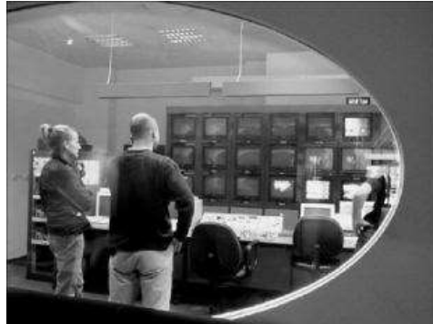
Obrázok 7 Posledné zábery zo štúdia TV

zbieralo, že bolo potrebné dobrzdiť, vymáčať sa v tom a znova ísť.“ 15