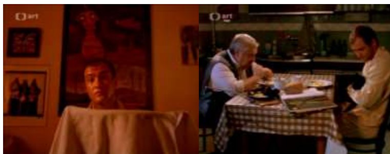
Obrázok 11 Záhada – Výzva k dobrodružstvu