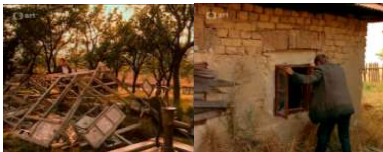
Obrázok 12 Záhrada – Odmietnutie výzvy

Zažíva ďalšie nástrahy. Vtáci poletujúci v interiéri chatky, diery v streche (vymýšľal excelentný nápad, stavia si hrnce na miesta, kde tečie voda po daždi), nie veľmi pohodlná posteľ. Ale aj nepohodlná posteľ naberá svoj význam. Jakubovi sa po toľkej snahe objaví pred očami jeho prvá odmena. „Budú objavené tiež zápisky tajomné,“ a tak sa stane. Jakub pred spaním odhaľuje pod vankúšom drevenú pokladnicu, v ktorej sa nachádza denník. „Když odhalí některý fascinující detail, jeho zájem vzroste.“ 23 Denník je dostatočne fascinujúci detail na to, aby Jakub pokračoval v „hľadaní cesty“. Ešte k tomu, keď Jakub otvorí denník a vidí, že sú slová písané naopak. Zaujíma sa o to, ako všetky riadky prečítať. Nerozumie tomu, no necháva sa viesť svojím inštinktom. Táto rekvizita (denník) ho presvedča natoľko, že sa rozhodne prespať v chatke.