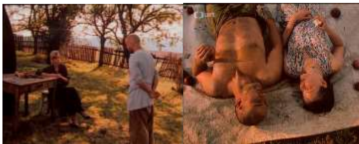
Obrázok 22 Konečný prínos

Milovanie s Helenou je tým konečným prínosom. To, aké mal Jakub predstavy pri rozhovore s otcom, bolo len istým úletom (mysliac možné vrátenie sa k Tereze). On úprimne túžil po Helene. Túžil ostať na záhrade, nájsť si peknú dievčinu a byť s ňou šťastný. Ale hlavný hrdina postupne dosahuje ďalší cieľ, len sám o ňom ani nevie. Totižto nevedome sa stáva omnoho skúsenejším, než predtým. Takže sa dá považovať za dospelého človeka. Dlho musel odolávať Helene, aby ho k sebe pustila, ale vďaka gestu umývania nôh sa mu to podarí. Apropo motív alebo gesto umývania nôh nabralo svoj význam práve tým, keď stretol sv. Benedikta, ktorému umýval nohy ako prvému. V danej scéne s Helenou sa znova o to pokúša. A po tomto akte má divák možnosť sledovať nevídanú romantickú scenériu, kde sa Helena s Jakubom zamotajú do veľkej bielej látky a spoločne sa prevaľujú takmer po celej záhrade. Z toho plynie jasná hrdinova premena. Na záhradu prichádza Tereza s celou rodinou a Jakub dáva najavo, že ju poriadne ani nepozná. Je presvedčený o premene a toho sa drží. Chce ostať na záhrade a byť s Helenou.