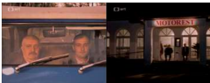
Obrázok 21 Zbožnenie

Podarí sa ďalší kúsok z Fun and games. V krčme sa syn s otcom až tak odviažu, že ich vyhodia počas spevu a tanca španielskych piesní. Stále sedia na stoličkách a štyria mocní chlapi ich vyvedú von pred krčmu. Skvelý a veľmi vtipný moment.