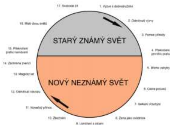
Obrázok 9 Campbellov štrukturálny skelet