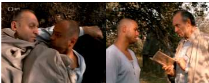
Obrázok 24 Záchrana zvonku

ho hrdiny a stane se tak uvěřiteľnejším a pro diváka lépe ztotožnitelným.“ 39 Jakub je tým istým príkladom. Nie že by divákovi odporoval, naopak. Divák sa s ním viac stotožní a verí mu. K tomu všetkému napomáha spomínaný Wittgenstein, ktorý je sám o sebe Záchrana zvonku. Prichádza z neznámeho miesta podobne ako predchádzajúci Mentori vo filme. A poučuje ho o daných problémoch, životných skúsenostiach. No a vďaka týmto poučeniam sa Jakub musí rozhodnúť vrátiť späť. Je donútený a tlačенý do niečoho, kam sa mu pravdepodobne veľmi nechce. Ale trojité poučenie od Mentorov je dost' silné na to, aby nabral silu a poradil si v živote sám. Jakub už nemá žiadnu inú možnosť. Musí sa vrátiť do reality s novým uhl'om pohľadu. Dokonca ponúka Wittgensteinovi jeden strom, aj keď od neho zo začiatku chcel celú záhradu. A ten mu zato ponúka knihu, z ktorej citát je spomenutý vyššie.