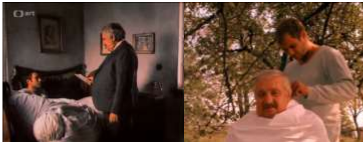
Obrázok 20 Uzmierenie s otcom

taktiež „hodí pod kosačku“. Otec začne Jakuba strihať a dej s ostrým strihom plynule prechádza do ďalšieho bodu hľadania cesty hrdinu. Jedná sa o 10. bod s názvom Zbožnenie, ktorý začína presne v stopáži 53:30 a neprerušuje sa žiadnou ďalšou kapitolou.