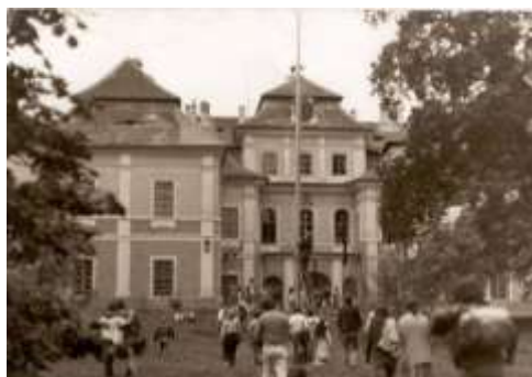
Obrázok 3 Budova školy v Čimeliciach