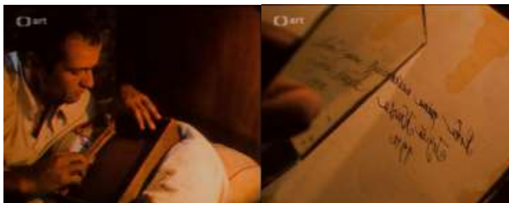
Obrázok 13 Záhrada – Pomoc prírody

Tento bod súvisí stále s druhou kapitolou samotnej snímky. Do rúk hlavného hrdinu sa dostáva magický predmet, už spomínaný denník po starom otcovi. Denník nie je veľmi nápomocný k čeleniu prekážok neznámeho sveta. Skôr sa spája s diagetickým komentárom v staroslovenčine a časom naberie svoj význam v inej rovine. V rovine vzťahovej. Taktiež sa neskôr stretne s neznámymi ľuďmi, ktorí sú mu nápomocní. Volajú sa Mentori, lenže tí prídu do príbehu v nasledujúcich kapitolách a bodoch. Aj keď o tom Campbell píše v bode Pomoc prírody, Šulík s Milkom sa zhodli, že stretnutie s Mentormi rozdelia na 3 fázy. Jakub sa stretne so svätým Benediktom, Rousseauom a Wittgensteinom postupne.