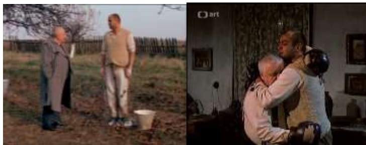
Obrázok 26 Majster dvoch svetov