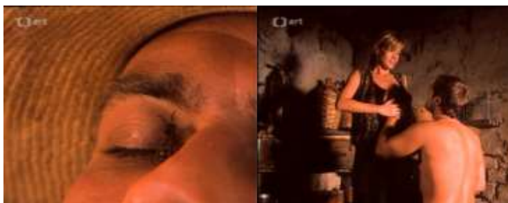
Obrázok 17 Žena ako zvodnica