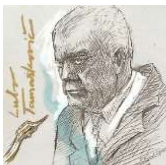
Obrázok 29 Kresba zosnulého jazzmana