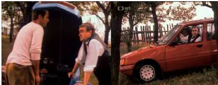
Obrázok 19 8.kapitola

zasiahne, že si uvedomí vlastný pokrok a prvé stretnutie so sv. Benediktom dáva jemu aj divákovi hlbší význam. Z ničoho nič sa objavili už dve postavy (mentori) a autori naznačujú, že príde aj tretia.