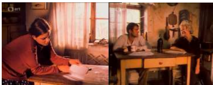
Obrázok 16 Cesta pokusov