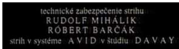
Obrázok 10 Záverečný titulok z filmu Záhada