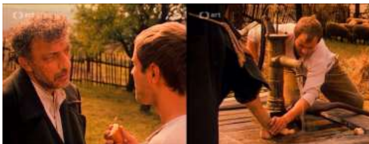
Obrázok 15 Brucho veľryby