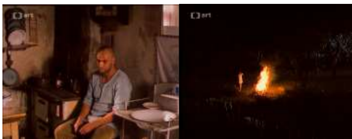
Obrázok 23 Odmietnutie návratu

V kapitole č. 10 sa nachádzajú 2 body Campbellovej teórie, takisto ako v predchádzajúcej. Tým prvým bol Konečný prínos, ktorý plynule prechádza do nasledujúceho bodu, kde si Jakub uvedomuje, že má Helenu naozaj rád. Lenže z ničoho nič mu zmizla, nevie ju nájsť. Neostáva mu nič iné, len navrátenie sa do starého sveta. Do sveta učiteľa, síce už poučený, ale bez Heleny. Zapaľuje oheň, vzniká obrovský plameň a popri tom si popíja už známu pálenku, ktorú našiel na záhrade.