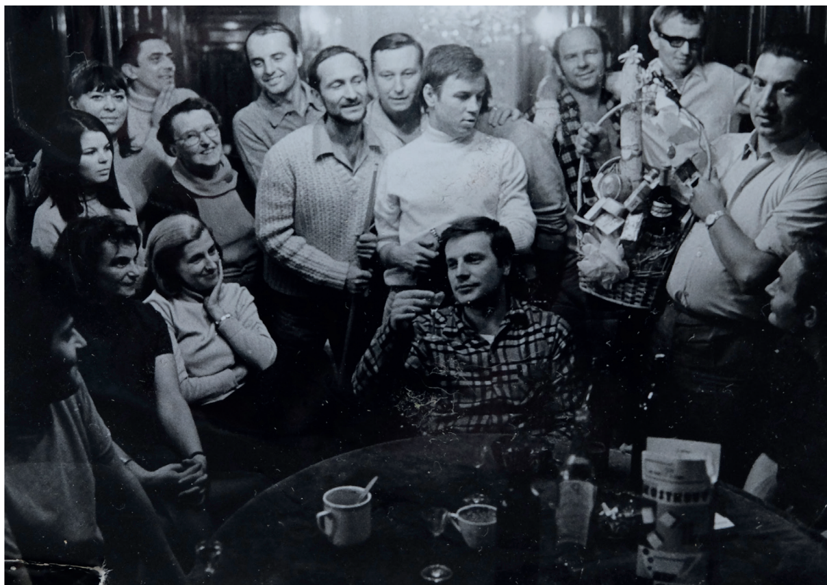
Redakce 1969