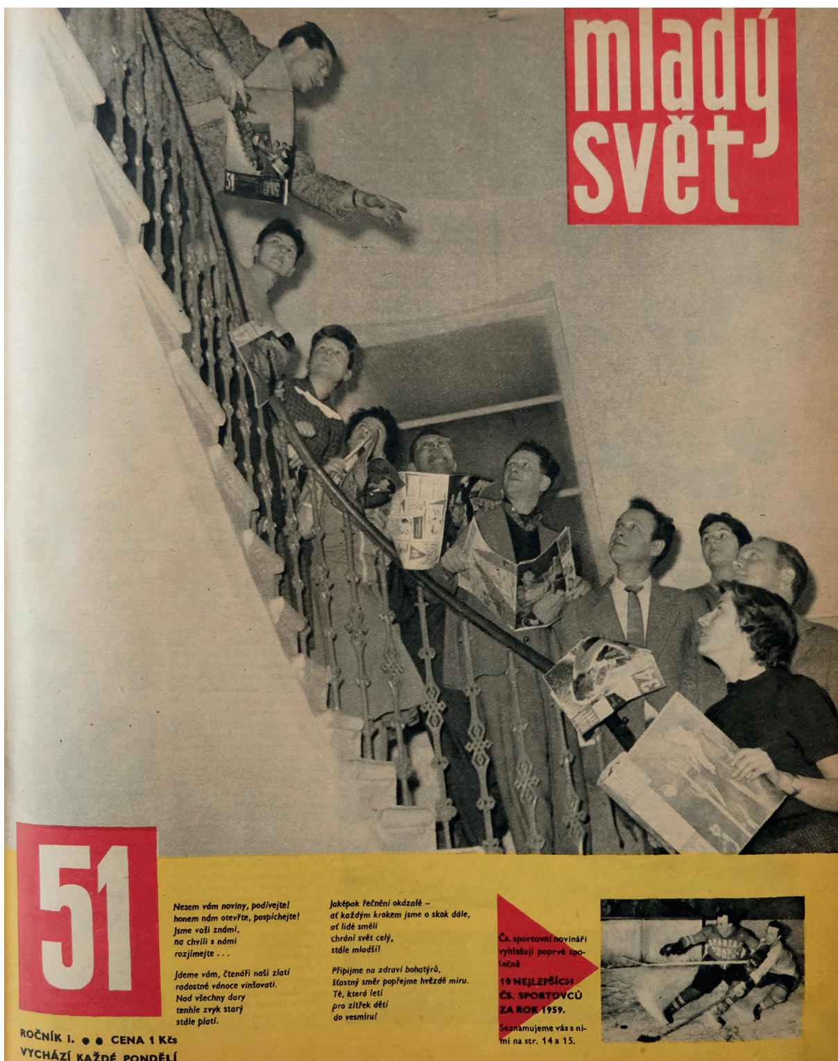
Titulní strana čísla 51/1959 se členy redakce (autor neuveden).