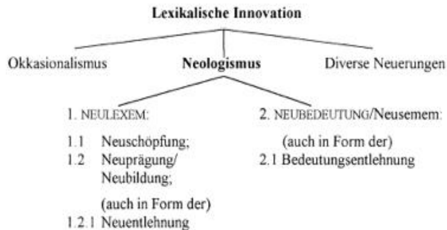
Abbildung 1: Lexikalische Innovation nach Kinne

Als nächstes möchte ich Herbergs Definition anführen: „Ein Neologismus ist eine lexikalische Einheit bzw. eine Bedeutung, die in einem bestimmten Abschnitt der Sprachentwicklung in einer Kommunikationsgemeinschaft aufkommt, sich ausbreitet, als sprachliche Norm allgemein akzeptiert und in diesem Entwicklungsabschnitt von der Mehrheit der Sprachbenutzer über eine gewisse Zeit hin als neu empfunden wird.“ 5 Der Begriff wird hier auf die gleiche Art und Weise definiert, wie auch bei Kinne.