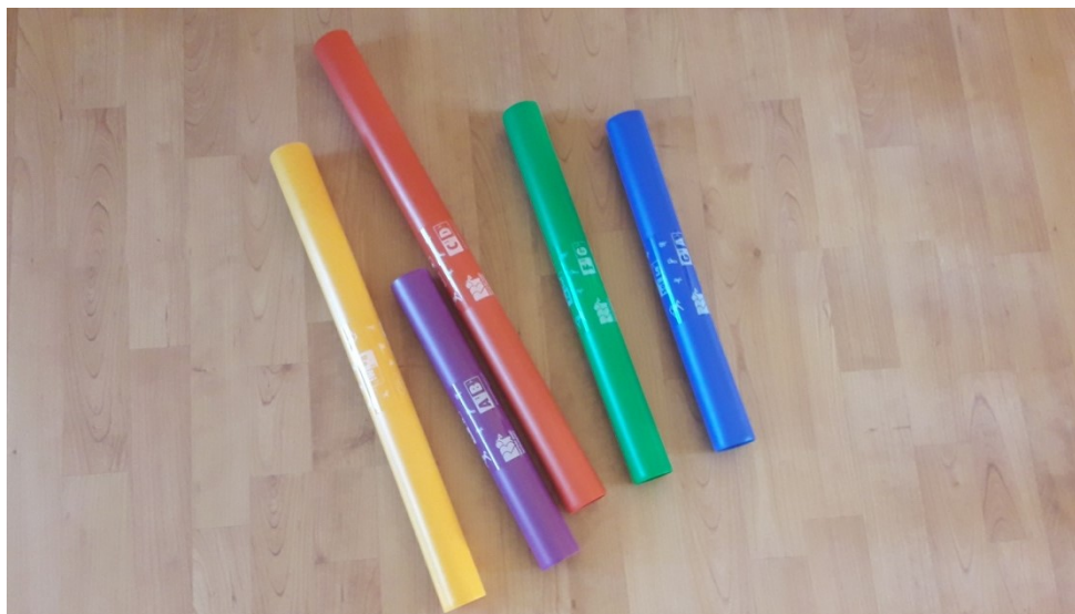
Obrázek 6 Boomwhackers