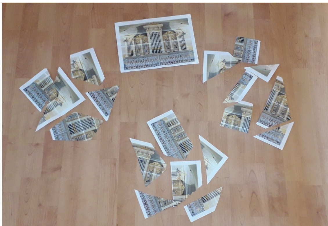
Obrázek 5 Puzzle

Jakmile jsem usoudila, že už si děti vyzkoušely všechny aktivity, které chtěly, jsem práci začala ukončovat. Když jsme se všichni shromáždili zpátky v prostoru u varhan, zazpívali jsme si ještě dvě vánoční písničky, které měly děti perfektně nacvičené z vánoční doby. Na závěr jsem s dětmi zopakovala názvy části varhan, poděkovala jsem za jejich aktivitu a doprovodila je ven z kostela.