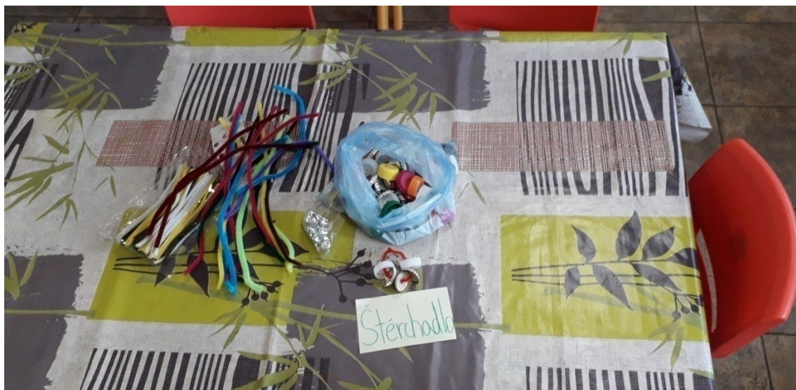
Obrázek 1 Štěrchadlo - pomůcky

Doporučený postup: Připravíme si různé typy proděravěných vršků. Následně začneme vršky navlékat na chlupaté drátky. Každý si musí vyzkoušet, jak je tam dávat – jak je natočit, protože podle toho nástroj zní. Není také dobré, aby byl drátek plný úplně. Po naplnění drátku se musí navzájem konce drátků do sebe stočit.