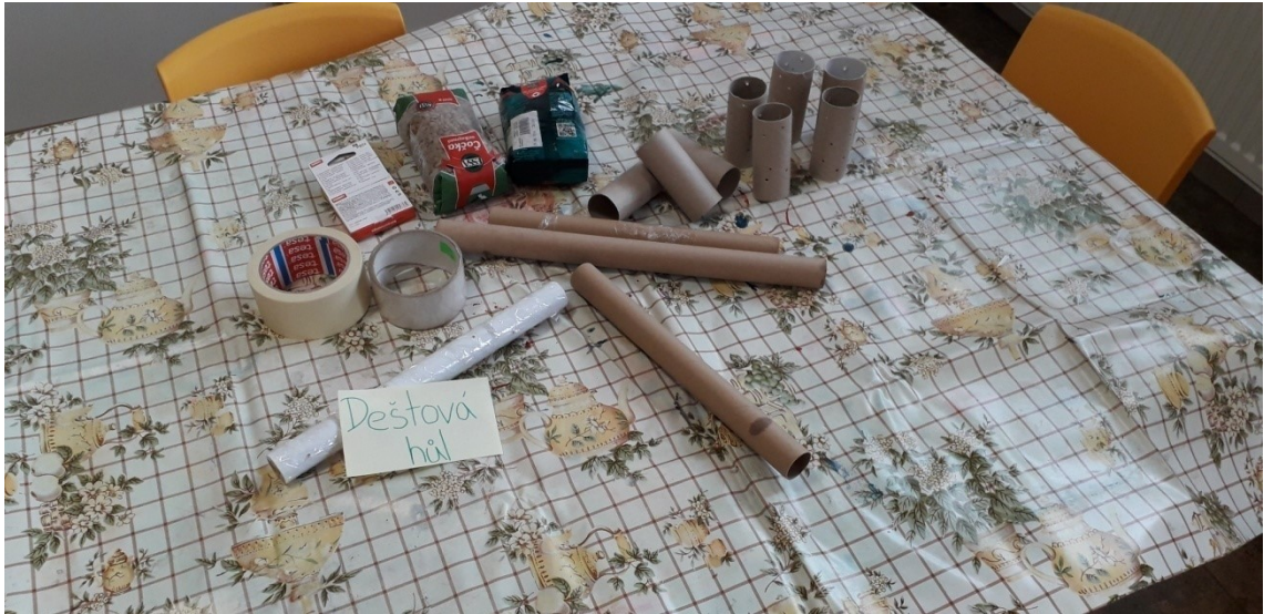
Obrázek 3 Dešťová hůl – pomůcky