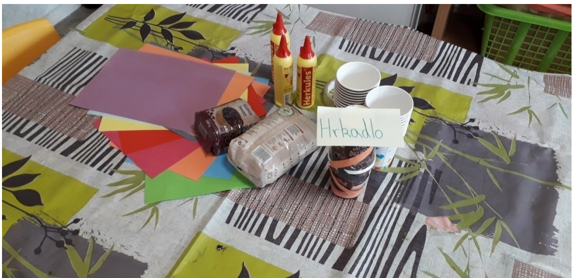
Obrázek 4 Hrkadlo - pomůcky

Doporučený postup: Nejdříve se papírové kelímky ozdobí dle vlastní fantazie. Poté se do kelímků nasype různé množství luštěnin. Třepáním kelímku se může vyzkoušet, jak právě nasypané množství luštěnin v kelímku zní. Pokud jsme se zvukem spokojeni, už se jen přilepí lepicí páskou dva kelímky hrdlem k sobě tak, aby ani z jednoho kelímku nic nevypadávalo.