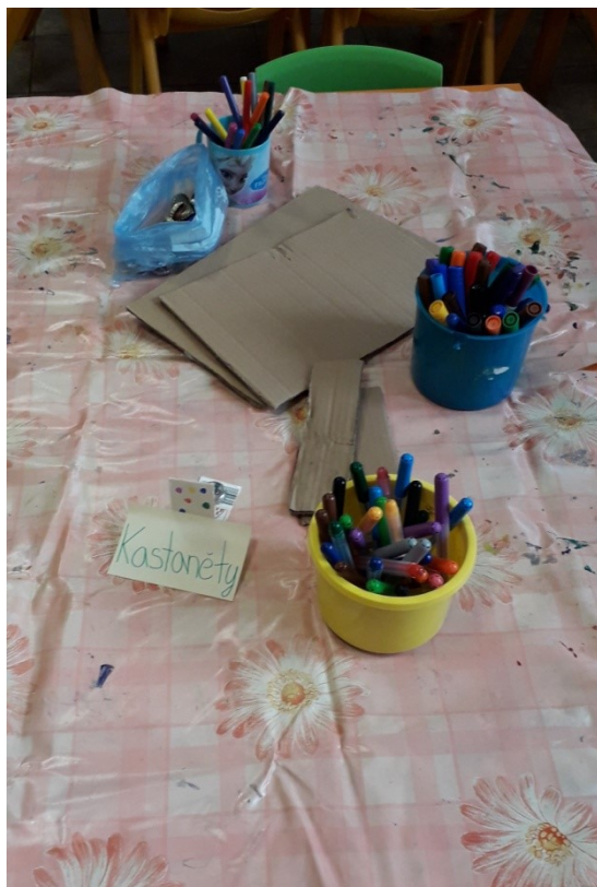
Obrázek 2 Kastaněty – pomůcky