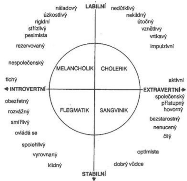
Obr. 1: Model osobnosti podle H. J. Eysencka (Říčan, 2007, str. 68)

Z výše uvedeného modelu systému temperamentových dimenzí osobnosti podle H. J. Eysencka lze vyčíst vztah ke klasickým temperamentovým typům. Vzorce osobnosti vznikají kombinací dvou faktorů: stability / lability a introverze / extroverze. Mezi vlastnosti jedince, jež je označován jako stabilní introvert (flegmatik) patří obozřetnost, ve vztazích se umí ovládat, je na něj spolehnutí, nevyvolává konflikty, je smířlivý. Stabilní extrovert (sangvinik) bývá ve vztahu vůdčí osobnost, je společenský, hovorný a bezstarostný. Oproti tomu labilní extrovert (cholerik) bývá v partnerských vztazích označován jako velmi impulzivní, útočný, rád vyvolává konflikty a je poměrně nedůtklivý. Labilní introvert (melancholik) může mít ve vztahu problém s vlastní náladovostí, přehnaným pesimismem, úzkostlivostí a rigiditou.