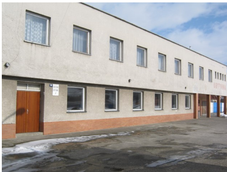
Obrázek 2 Turistická ubytovna Hluk

Náklady: 1 026 724 Kč – cena je za rekonstrukci budovy, respektive úpravy vnitřních prostor a platů, jako jsou například dělníci nebo stavbyvedoucí