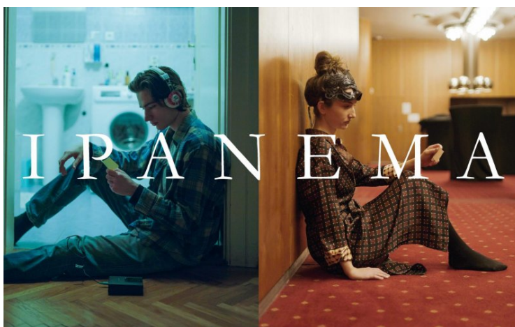
Obrázek 3 Plakát Ipanema

Ipanema je hraný krátkometrážní film, který vypráví paralelní příběh dvou mladých lidí, Ester a Olivera. Jedná se o drama plné hudby, tance a hledání. Ester je profesionální tanečnice, která tancuje pod vedením své matky. Oliver je zamlklý chlapec pracující v čistírně a k čistým oděvům, které lidem vrací, píše krátké vzkazy. Díky lístečkům cestujícím v kostýmech z divadla do čistírny spolu začnou komunikovat a jejich životy se propojují. Tím začíná jejich cesta ke hledání osobní svobody a překonání svých bariér.