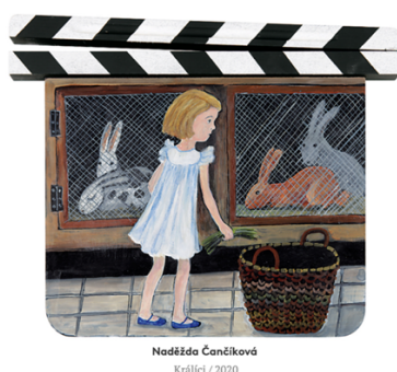
Obrázek 2 Ukázka filmové klapky s názvem Králci (Čančíková, 2020)

Podstatou projektu Salon filmových klapek, je umělecké ztvárnění dřevěných filmových klapek, které se následně v rámci konání Zlín Film Festivalu vydraží a získané peníze putují právě na podporu projektů mladých filmařů. Vydražená suma se mezi jednotlivé přihlášené projekty rozděluje na základě soutěže, kdy odborná porota vybere několik projektů, které finančně podpoří. Za dobu, co fond existuje, vzniklo již 2 624 filmových klapek, díky kterým se podařilo vydražit částku přes 38 miliónů korun a tím podpořit více než 350 filmových projektů. (O projektu, [2020])