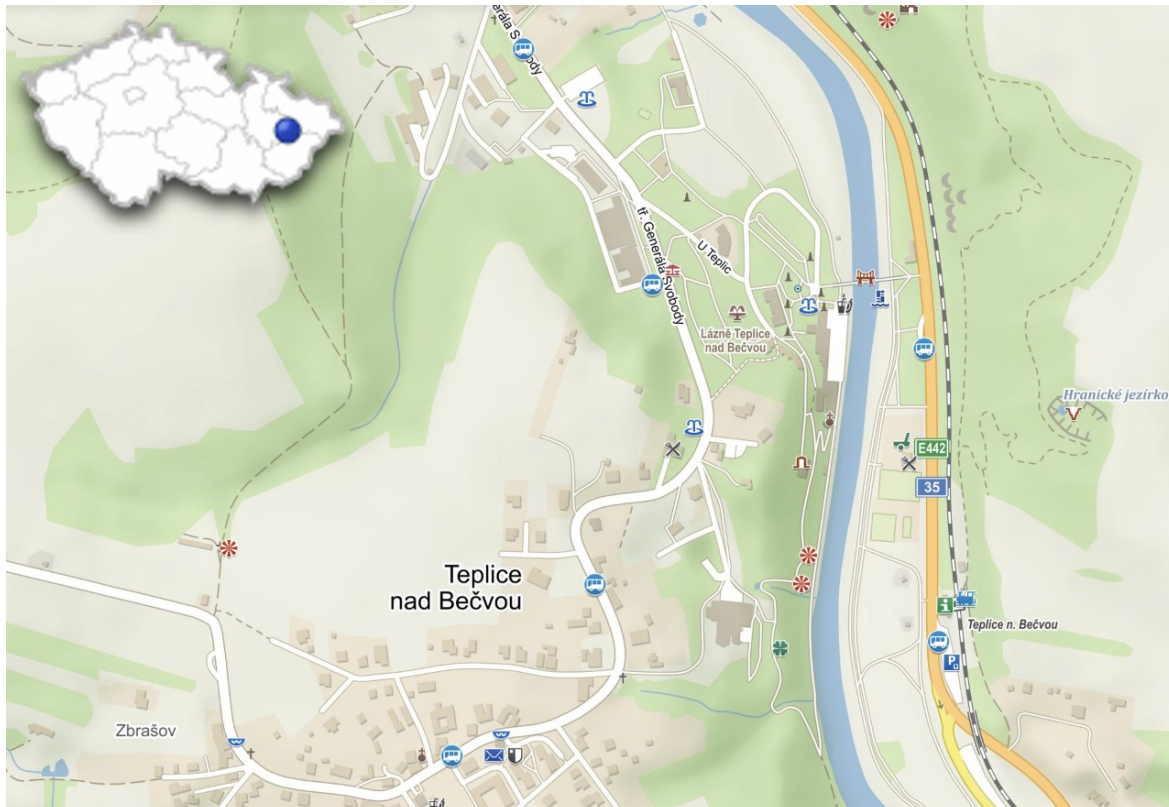
Obrázek 1 – Umístění obce Teplice nad Bečvou (Seznam.cz, © 2022)

Mezi hlavní ekonomické subjekty na území obce patří společnost Lázně Teplice nad Bečvou a.s. spolu s Kamnářstvím Jakubka. V obci se také nachází řada drobných živnostníků. Ekonomický život obce spolu s administrativou je úzce spojen s městem Hranice, které plní roli správního obvodu obce s rozšířenou působností.