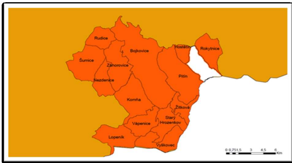
Obrázek 2 MAS Bojkovsko

Obec Pitín, Obec Rokytnice, Obec Rudice, Obec Starý Hrozenkov, Obec Šumice, Obec Vápenice, Obec Vyškovec, Obec Záhorovice.