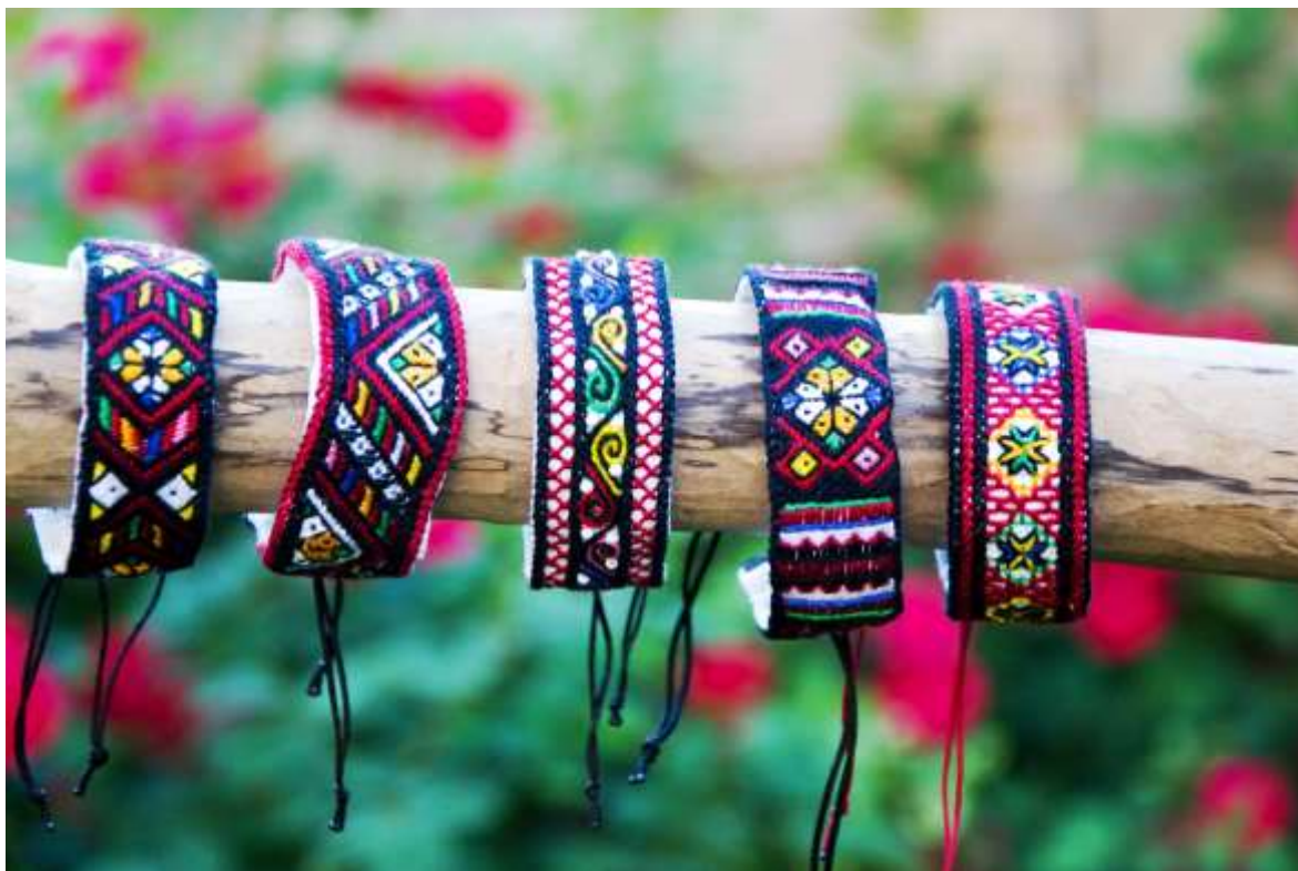
Obrázek 1 Užití kopaničářské výšivky

(Zdroj: Foto Helena Michalčíková, vytvořila Bc. Evženie Chovancová ©2021)