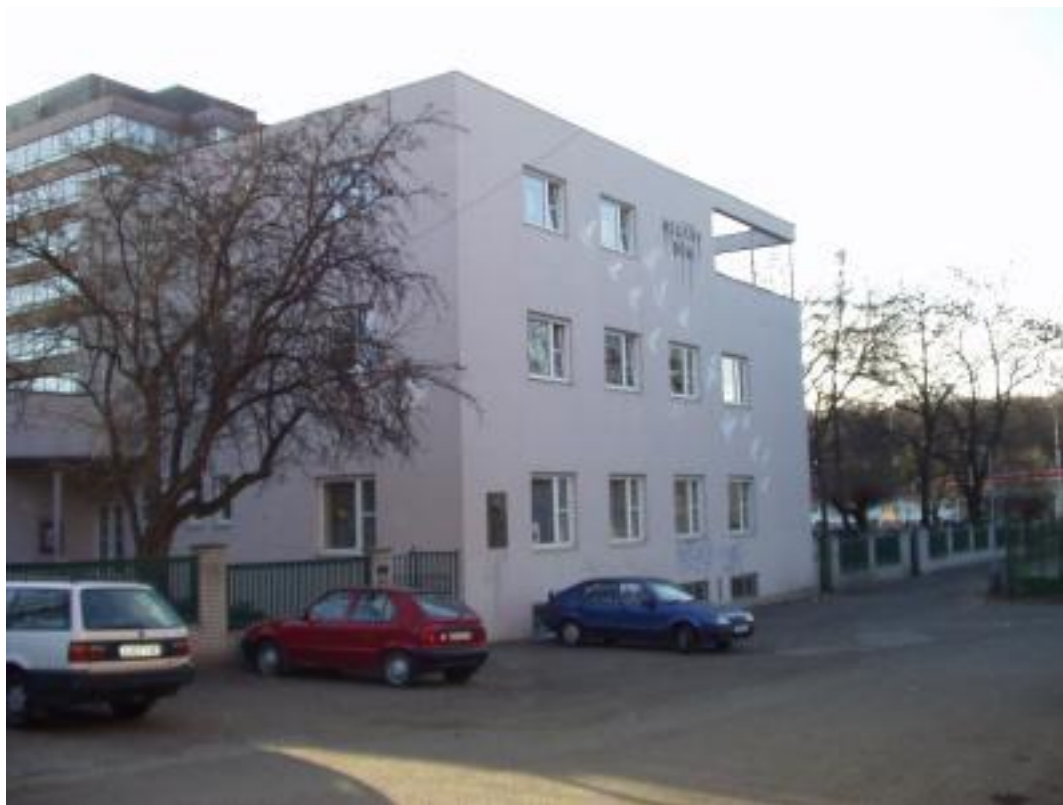
Obrázek č. 1: Milíčův dům v Praze, současná podoba, 2022

Židovské děti ukrýval Přemysl Pitter se svými spolupracovníky také v Mýtě u Rokycan, zde byla v roce 1938 otevřena ozdravovna a tábořiště. Činnost Milíčova domu byla obnovena po druhé světové válce a pod vedením Přemysla Pittra fungoval Milíčův dům až do únorového převratu v roce 1948, kdy jej převzal Ústřední národní výbor v Praze a provozoval jej až do roku 1950, kdy se z něj stala „družina“ a poté mateřská škola, která funguje v Milíčově domě dodnes. Od roku 1941 posílal Přemysl Pitter mnoha transportovaným židovským lidem a rodinám potravinové balíčky do koncentračních táborů. V období od května 1945 do května 1947 se postaral o 810 dětí na čtyřech již výše uvedených konfiskovaných zámcích (Holocaust.cz, 2022).