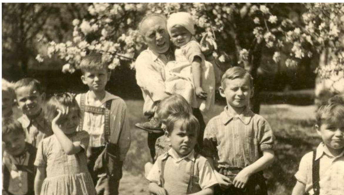
Obrázek č. 2: Přemysl Pitter, 2022

Dále je to také dokument „Židovské děti“, který byl připraven Národním pedagogickým muzeem a knihovnou J. A. Komenského k 75. výročí osvobození naší vlasti jako stříhový pořad Židovské „děti“ vzpomínají na Přemysla Pittra. Tento dokument je zacílen zejména na mladou generaci, aby si uvědomily, co tyto děti zažily během druhé světové války. Řada dětí, které se vracely z koncentračních táborů nevěděla nic o své rodině, o blízkých (Pitter, 2022).