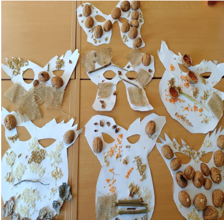
Obrázek 9 Schnutí masek před zafixováním