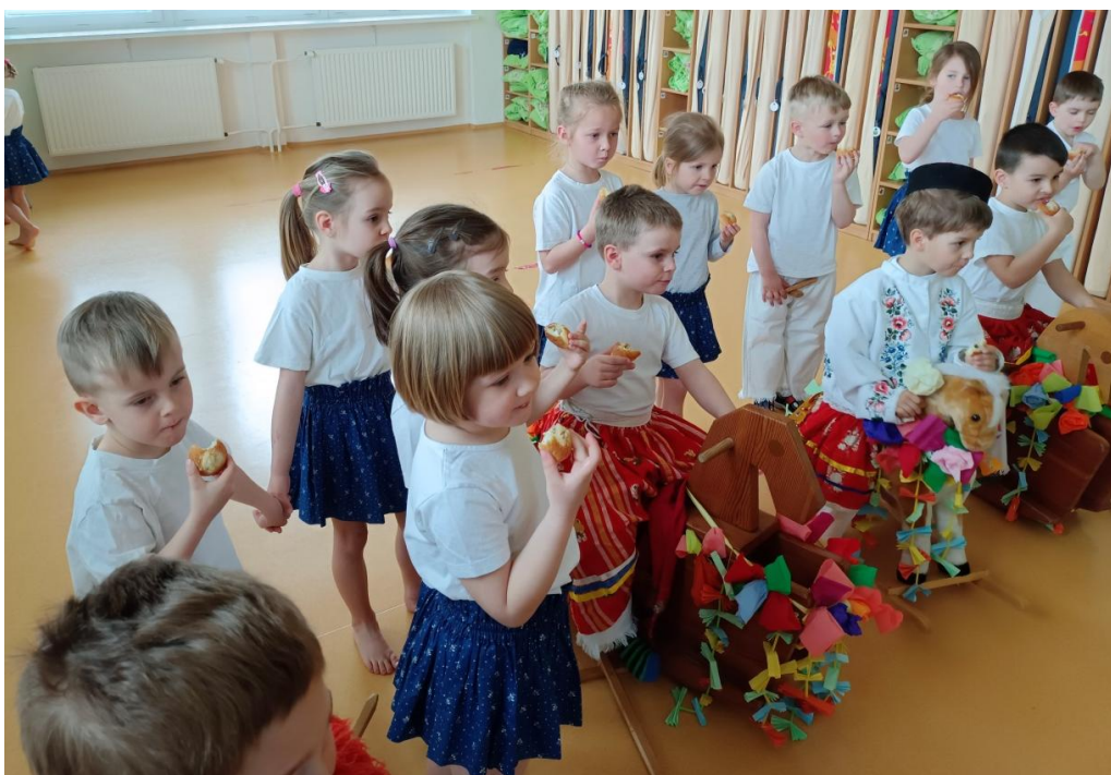
Obrázek 40 Občerstvení královské družiny vlčnovskými vdolečky