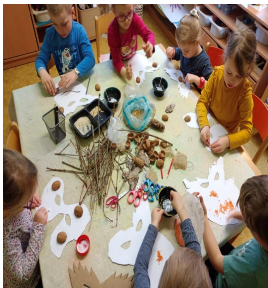
Obrázek 7 Lepení přírodnin na podklad

Organizační formy a metody byly zvoleny vhodně. Při samotném vyrábění masek se prostřídala skupina sedmi dětí. Během činnosti jsem děti co nejvíce podporovala k samostatnosti. Když bylo potřeba dopomoci danému dítěti s dílčím úkolem, tak jsem se snažila nejdříve jen poradit, jak by se dalo postupovat. Dopomoc byla potřeba při stříhání pytloviny a s přilepením tavnou pistolí větších větviček, které se opakovaně nedařilo dětem přilepit lepidlem. Zpočátku byly děti zdrženlivější, nemají tolik příležitostí a zkušeností s tvořením z přírodních materiálů. Taktéž jsou více zvyklé používat vzorové šablony, kdy si převážně vybírají mezi dvěma druhy, které si poté vybarví nebo dolepí chybějící části. Takhle měly možnost si každý dle své fantazie vytvořit vlastní masku. Po kompletaci masek – připevnění kloboukové gumičky a zafixování lakem na vlasy si děti ztvárnily s hrou na orffové nástroje samotný průvod. Měly tak možnost si průvod masek v námětové inscenaci prožít. Masky podlepené tvrdším kartonem byla na obličejích dětem méně příjemná, protože je tvrdší a při upevnění na obličejích hůř držela. Nebyla tolik ohebná na obličejích. Bylo by také vhodné použít pevnější kloboukovou gumu, která udrží vrstvu nalepených přírodnin na masce a nesklouzává z obličejích. Kladně hodnotím využití přírodnin a odpadového materiálu. Po rozhovoru s paní učitelkou jsem zjistila, že dětem není tak často nabízena tvorba z přírodnin.