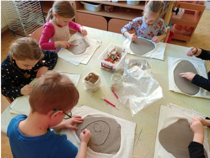
Obrázek 19 Práce s keramickou hlinou