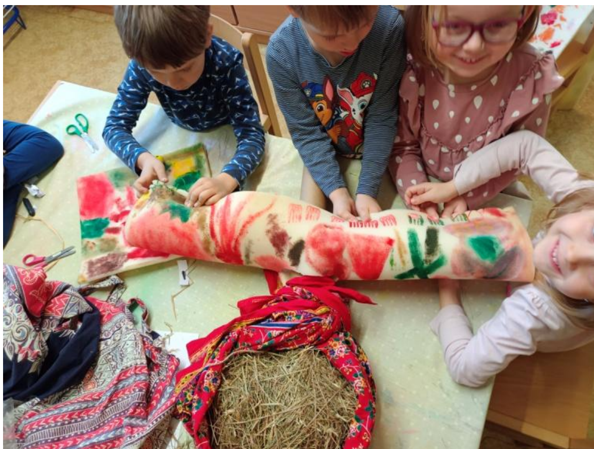
Obrázek 23 Sešívání molitanového pásu – vytváření rukou