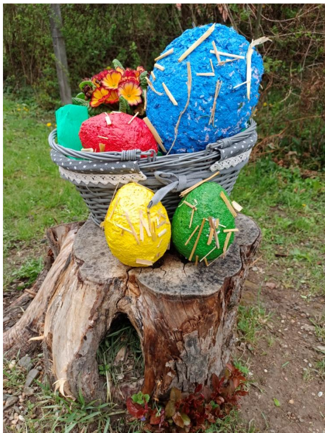
Obrázek 28 Zhotovená vejce se slámovým zdobením