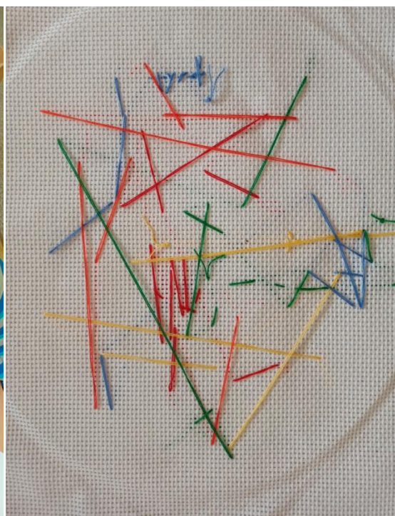
Obrázek 31 Zhotovená výšivka