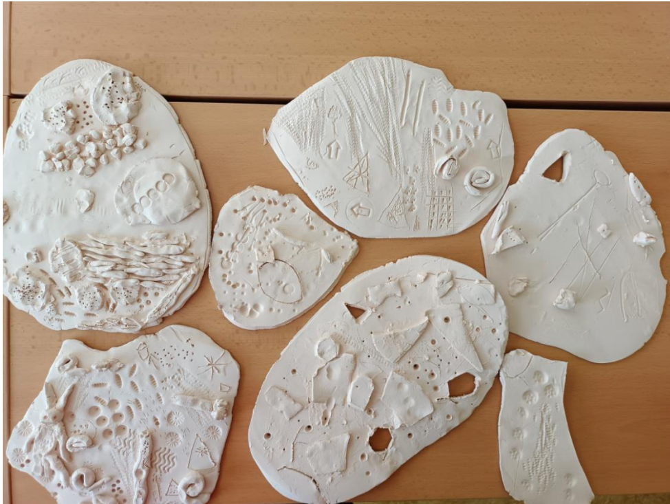
Obrázek 21 Kachle z keramické hlíny