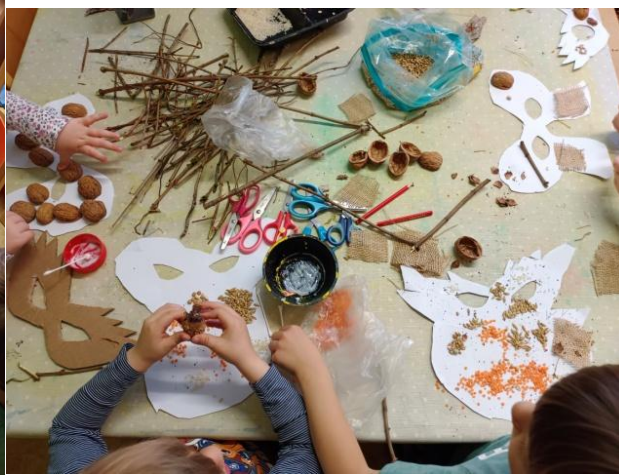
Obrázek 8 Realizace masky z přírodnin