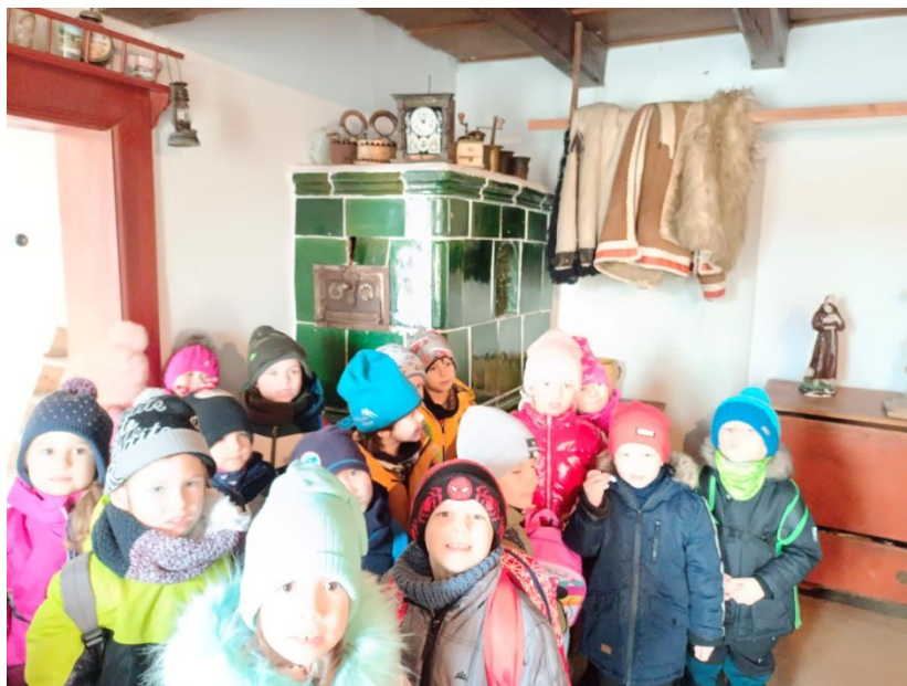
Obrázek 6 Slovácká jizba