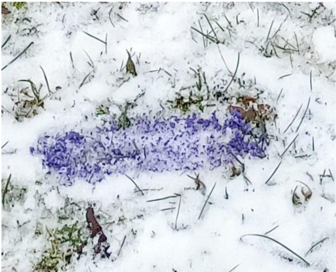
Obrázek 17 Detail stopy