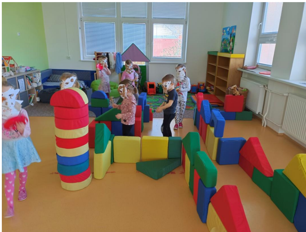
Obrázek 11 Hra na masopustní průvod