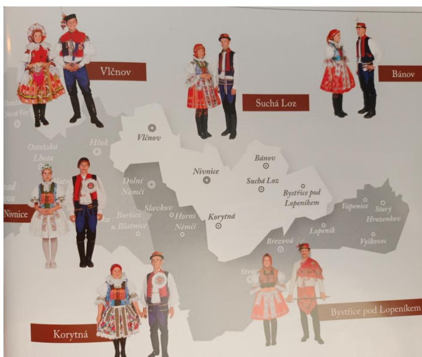
Obrázek 2 Vymezení oblasti regionu, které se budu věnovat v bakalářské práci

Ke každému regionu se vážou jednotlivé lidové tradice, které mohou mít stejný původ, jako je období v kalendářním roce, kdy se uskutečňují, ale liší se drobnými specifiky, které jsou rozhodující pro oblast Slovácka. Ve své práci budu vycházet ze způsobu realizace lidové tradice, jak je zaznamenána a dodržována v regionu Slovácka. Využívání lidové kultury ve výchově dětí přináší pozitivní výsledky při budování vztahů v rodinách, ve společnosti a přebírání hodnot z odkazu našich předků. Má tedy i potenciál využitelný v předškolním vzdělávání.