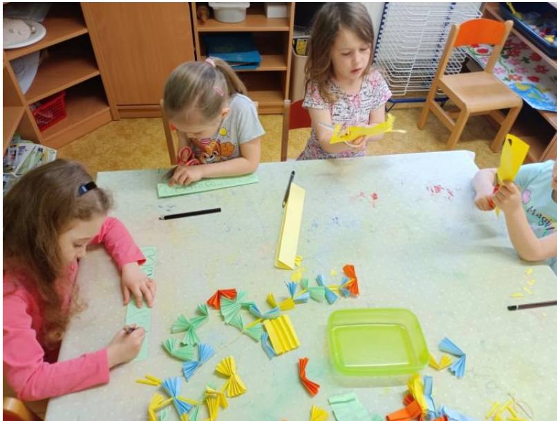
Obrázek 35 Zhotovování výzdoby na ocas koně