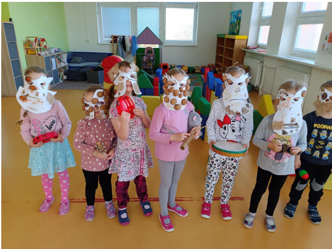
Obrázek 10 Přehlídka zhotovených masek