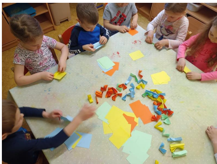
Obrázek 34 Skládání mašliček na třásně