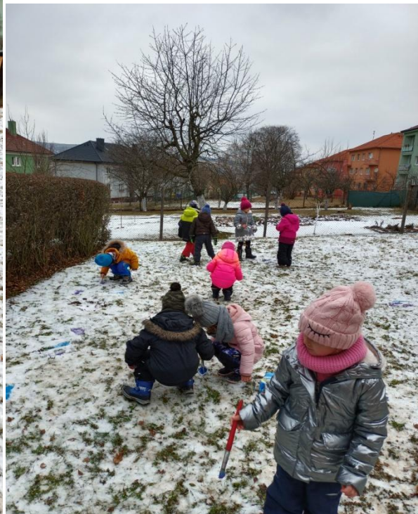
Obrázek 16 Výtvarný experiment, malba na sněh