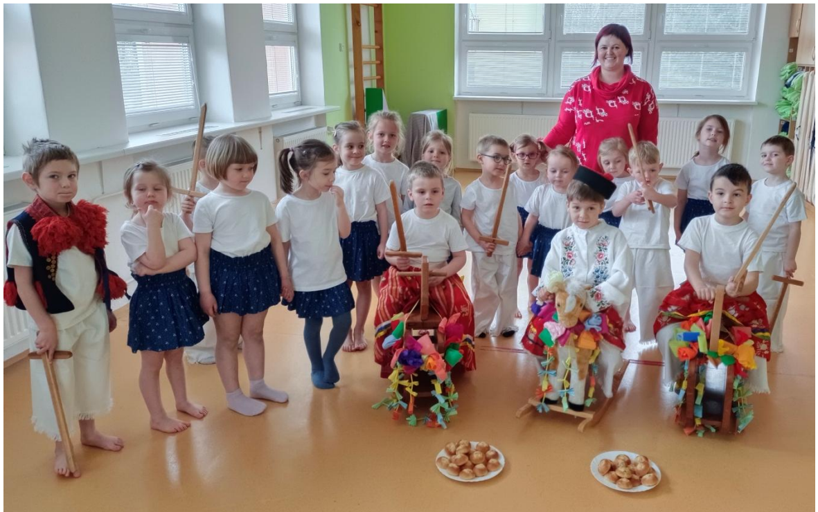
Obrázek 37 Příprava na hru jízdy králů