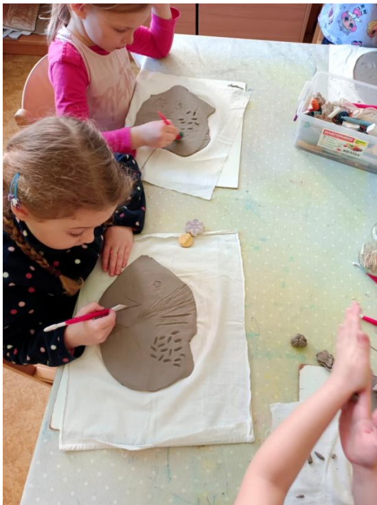
Obrázek 20 Soustředění dívky na práci