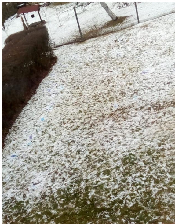
Obrázek 18Náhled na stopy z okna herny