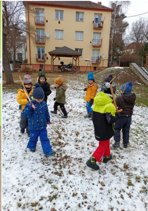
Obrázek 13 Vytváření otisků stop ve sněhu