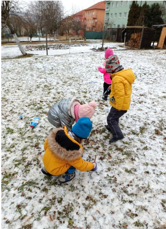
Obrázek 15 Malba na sněh