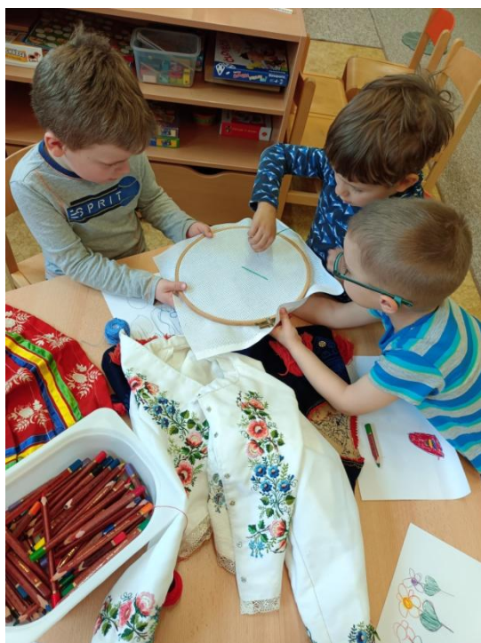
Obrázek 30 Vyšívání chlapců