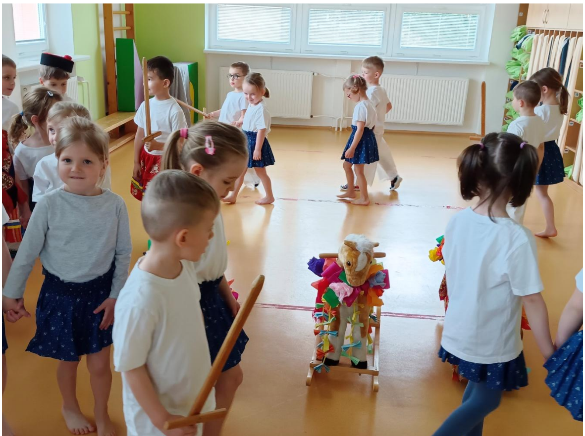
Obrázek 38 Obchůzka s krále a jeho družiny