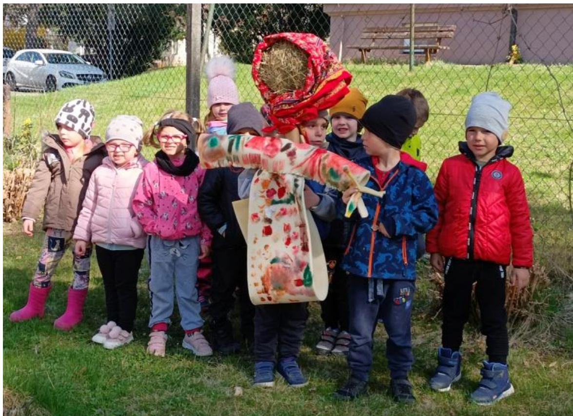
Obrázek 24 Vítání jara, průvod s kralovničkou