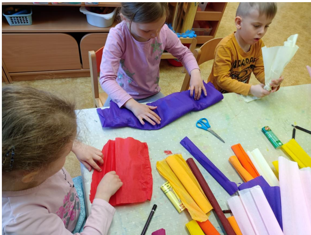
Obrázek 33 Tvorba růží na koně

králů, kdy děti vytvořily královskou družinu a touto závěrečnou hrou jsem moji aplikační část uzavřela. Tuto aktivitu bych zhodnotila kladně, jen byla potřeba děti motivovat k dokončení jednotlivých částí činností, aby mohl vzniknout celý celek. Děti si tak samotnou tradici mohly pomocí námětové hry prožít. Možná bych příště i zvolila rozvržení přípravy zdobení mezi dvě třídy, kdy každá třída připraví jednotlivou část a poté zkompletují výzdobu pro jednoho koně. My jsme nakonec zhotovily koně tři.