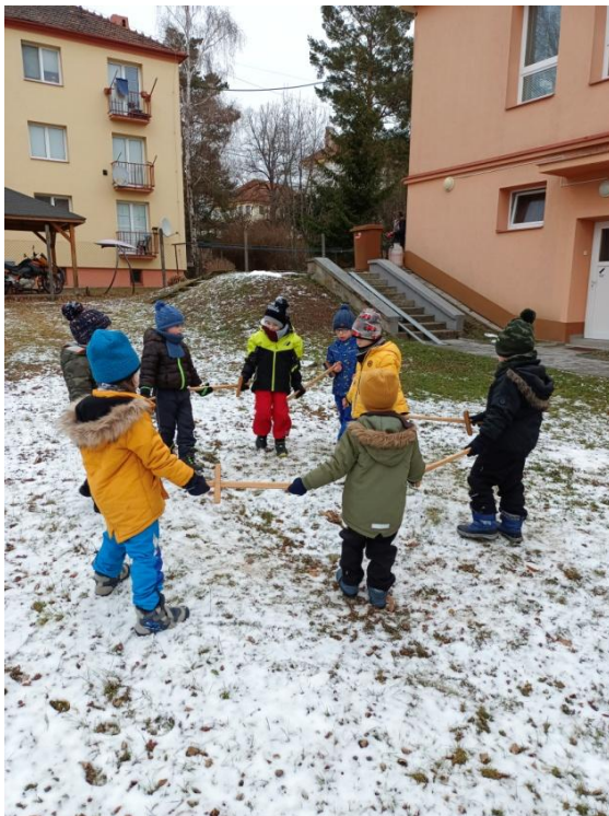
Obrázek 14 Zvětšování a zmenšování kruhu při tanci