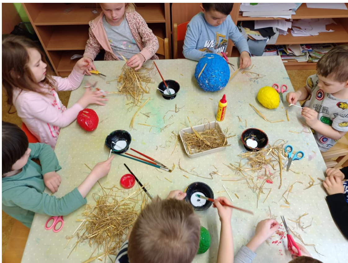
Obrázek 27 Zdobení vejce slámou