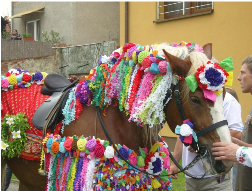
Obrázek 39 Tradiční zdobení koně ve Vlčnově