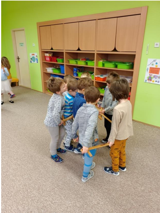
Obrázek 12 Tanec chlapců ve třídě