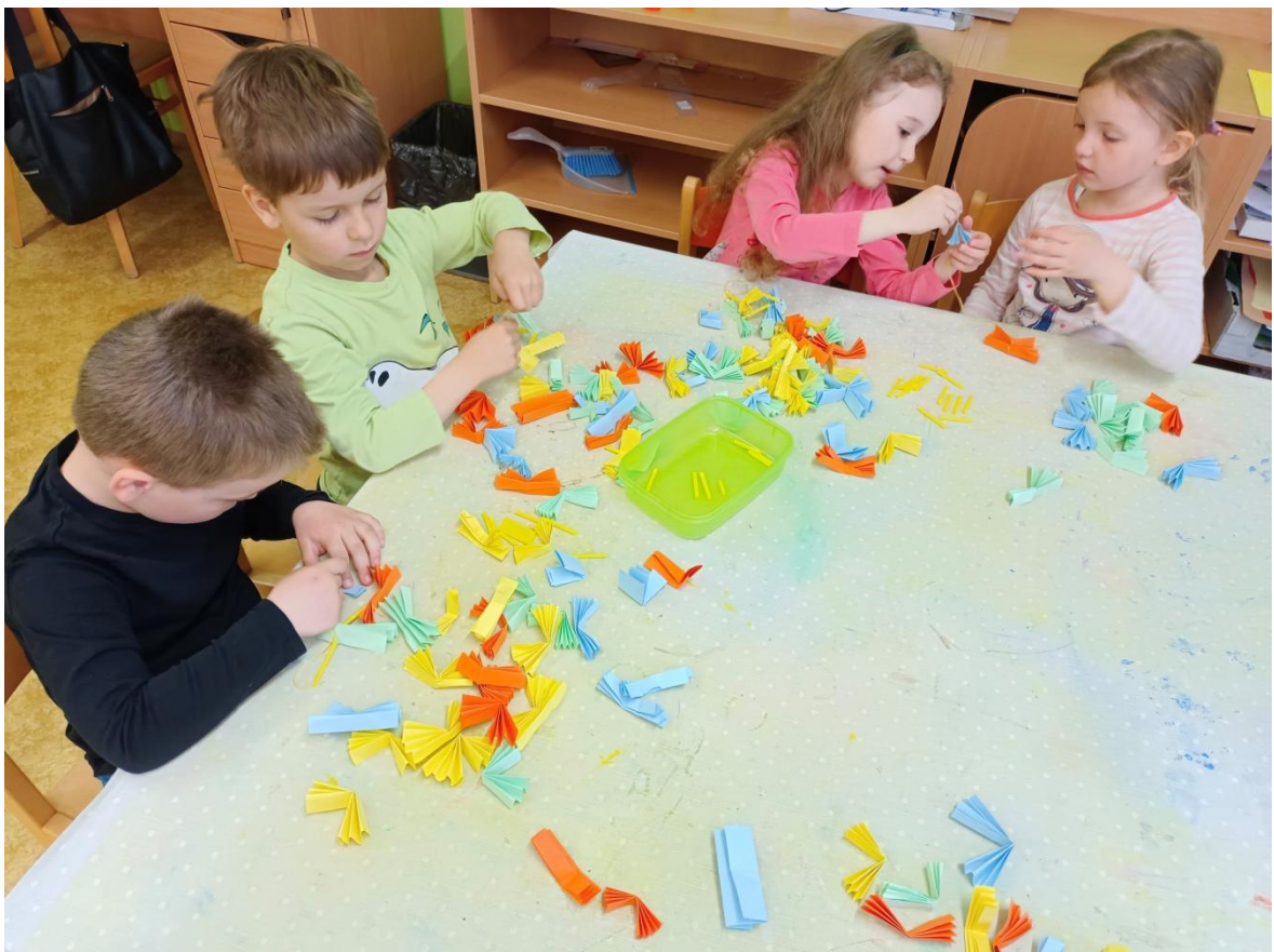
Obrázek 36 Navlékání třásní