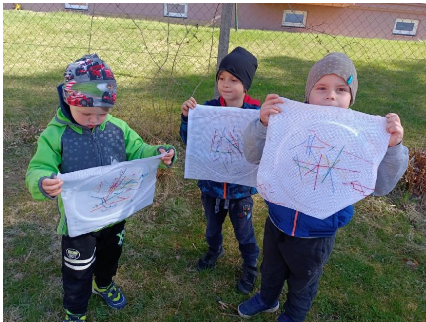
Obrázek 32 Zhotovené výšivky