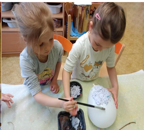
Obrázek 26 Výroba vejce - kašírování