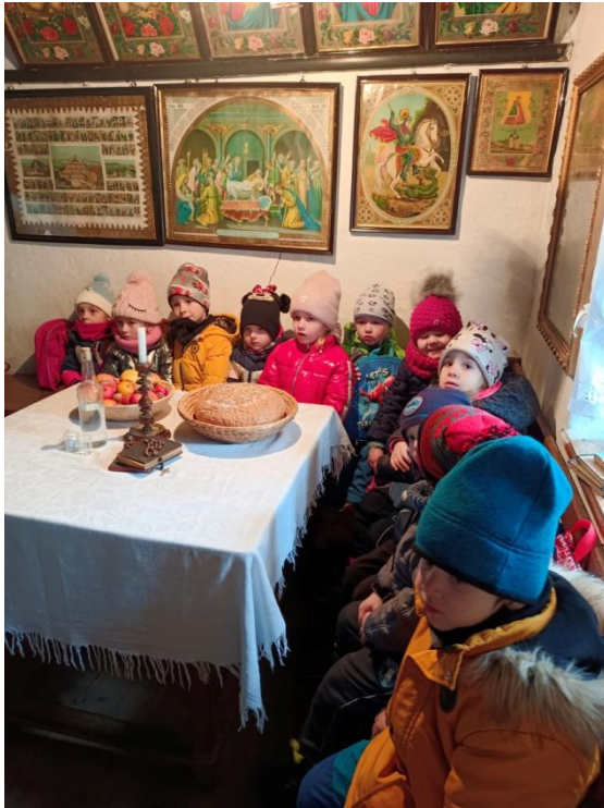
Obrázek 4 Svatý kout