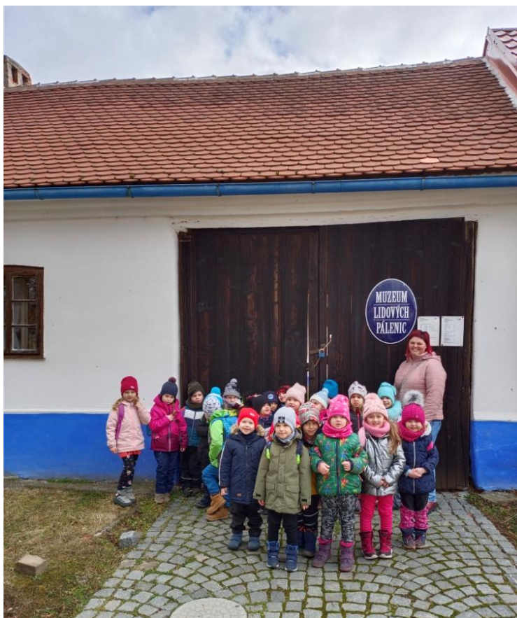
Obrázek 5 Usedlost číslo 65