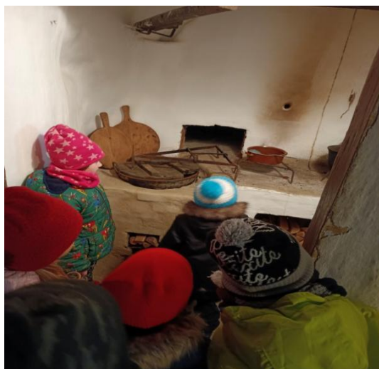
Obrázek 3 Černá kuchyň