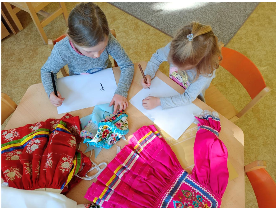
Obrázek 29 Příprava návrhu výšivky