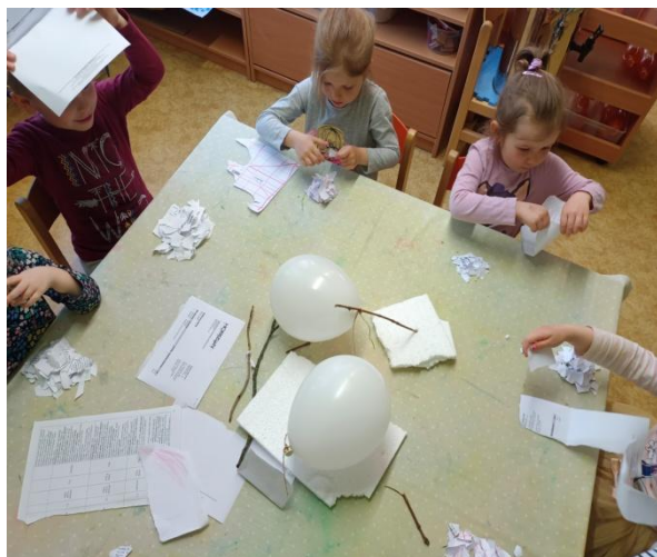
Obrázek 25 Příprava hmoty na kašírování

nikdy tuto techniku s dětmi nezkoušela, protože je časově více náročná.