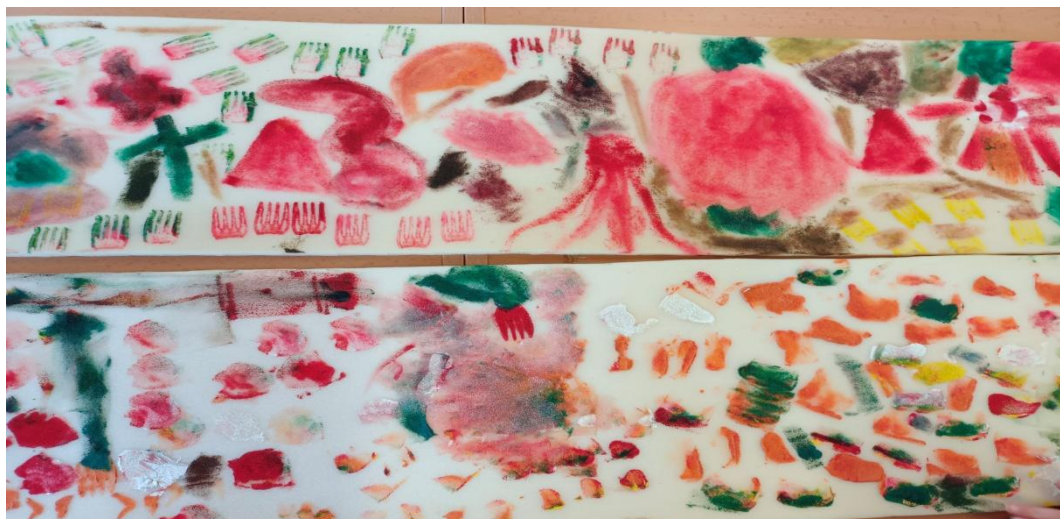
Obrázek 22 Podklad z malby na molitan