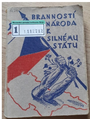
Obrázek 5 Příručka Československého Orla z roku 1934

by ji tak mohlo svým obsahem využít jako výraznou pomoc učitelům při výuce. Ukázkovým příkladem z historie je příručka Československého Orla z roku 1934, která je svým obsahem až nečekaně blízko dnešní době.