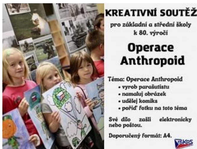
Obrázek 2 Soutěž POKOS pro ZŠ a SŠ (pokos.army.cz)

Na zmíněných platformách pravidelně probíhají vědomostní a tematické soutěže o věcné ceny. Ty jsou pojmenovány #PoznejPOKOS. Dle emailové komunikace s kontaktní osobou pro akce na veřejnosti a na školách paní Ing. Danielu Hölzelovou se soutěží účastní kolem 200 žáků.