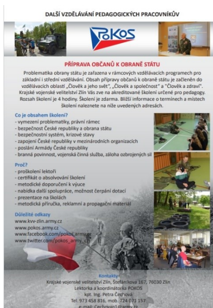
Obrázek 1 Pozvánka na akreditační školení (zkola.cz)

Na školení jsou pedagogům představena stěžejní témata problematiky přípravy občanů k obraně státu, která jsou obsahem rámcového vzdělávacího programu pro základní vzdělávání (Gerhát, 2018).