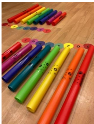
Obrázek 2 - Boomwhackery

V hlavní části výstupu jsem dětem řekla, že pomocí těchto boomwhackerů jsou schopni zahrát i samotnou písničku. Na magnetickou tabuli jsem připnula vytištěné barevné noty. Noty byly v barvě boomwhackerů, aby pro děti bylo jednodušší rozeznat (pochopit), kdy mají hrát. Vybrala jsem písničku: Sedí liška pod dubem , neboť se jedná o jednu z jednodušších dětských písniček. Vyzvala jsem pět dětí, aby si sedly před tabuli a každému jsem rozdala příslušné trubky. První a poslední dítě mělo nejtěžší úkol, jelikož muselo bouchnout vícrát. Dětem jsem vždy dávala pokyn, kdy mají hrát. Následně jsme ke hraní přidali i zpěv. Poté se před tabulí vystřídala druhá skupina dětí. Postupovala jsem stejně jako u první skupiny. Dětem jsem vždy dala pokyn, kdy mají hrát. Po několika opakování již děti hrály písničku bez větších problémů. Nakonec se před tabulí vystřídala i třetí skupina, se kterou jsem postupovala stejně jako u dvou předchozích skupin.