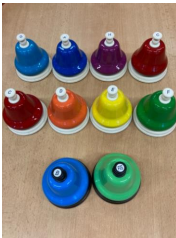
Obrázek 5 – Sada hracích zvonků

zazvonit, a zvoník určil, zda intervaly k sobě ladí či neladí. Pokud ano, dítě z domku se zvedlo a obcházelo další domy se zvoníkem. Pokud ne, dítě zůstalo v domku sedět. Takto se poté na pozici zvoníka vystřídal více dětí. Děti také měnily pozici v domech.