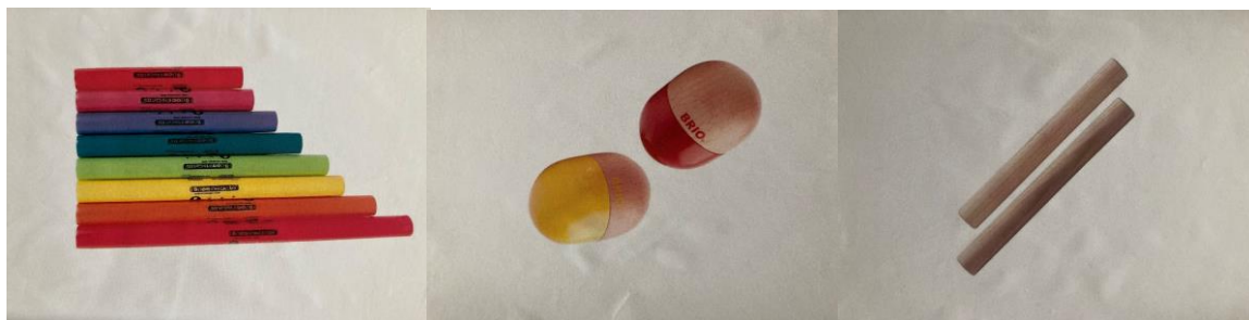
Obrázek 6 – Obrázky hudebních nástrojů