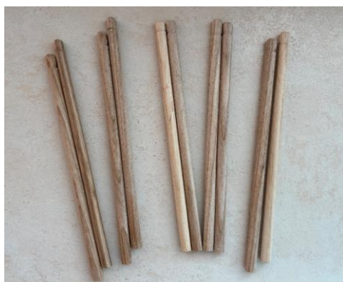
Obrázek 4 – Bubenické paličky

jim předvedla. Nejprve jsem tedy zahrála určitý rytmus a děti jej musely zopakovat. Bubnovali jsme o zem. Mladší děti nejprve nepochopily, že mají rytmickou stopu opakovat hned, jakmile dohrajú já. Tato aktivita byla pro ně dost náročná. Starší děti omylem bubnovaly i ve chvílích, kdy měly být v klidu. Začala jsem jednoduchými a lehce zapamatovatelnými úryvky. Dále jsem zvyšovala obtížnost. Na závěr jsem předváděla rytmus nejen bubnováním o zem, ale také například dvěma paličkami o sebe, nebo jen jednou paličkou o zem, abych provedla jistou obměnu.