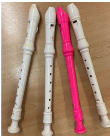
Obrázek 7 - Flétny

pouze tón G. Další flétny měly dírky na flétnách zalepeny tak, aby vydávaly pouze tóny A, H a vysoké C. Děti jsem seřadila vzestupně podle not. Pokud jsem na dítě ukázala jednou, znamenalo to, že má do flétny jednou fouknout, pokud dvakrát, dítě mělo do flétny fouknout dvakrát atd. Začali jsme tedy hrát. Děti se velmi snažily, a na hru se soustředily. Ostatní děti, které zrovna neměly flétny, písničku zpívaly. S každou skupinou jsme písničku zopakovali alespoň dvakrát, pro důkladnější procvičení.