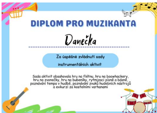
Obrázek 8 - Diplom

Jelikož se jednalo o poslední aktivitu z celé sady, nachystala jsem pro děti odměnu. Jakmile jsme dohráli na flétny, řekla jsem dětem, aby si sedly do třídy na koberec. Sedla jsem si před ně a začala jsem vysvětlovat, že dnes jsem ve třídě naposled, protože jsem realizovala všechny aktivity. Dále jsem se dětí ptala, zda si pamatují, jaké všechny aktivity jsme spolu absolvovali. Nejvíce dětí si vzpomnělo na exkurzi na kostelními varhany, hru na boomwhackery, ale také poznávání zvuků hudebních nástrojů nebo rytmizace básně. Dětem jsem poděkovala za jejich spolupráci a začala jsem postupně rozdávat diplomy a sladkou odměnu. Dětem jsem také popsala, co vše je napsáno v diplomu. Nakonec jsme se rozloučili. Děti se mě neustále ptaly, zda ještě někdy přijdu znova. Slíbila jsem, že je určitě ještě přijdu navštívit.