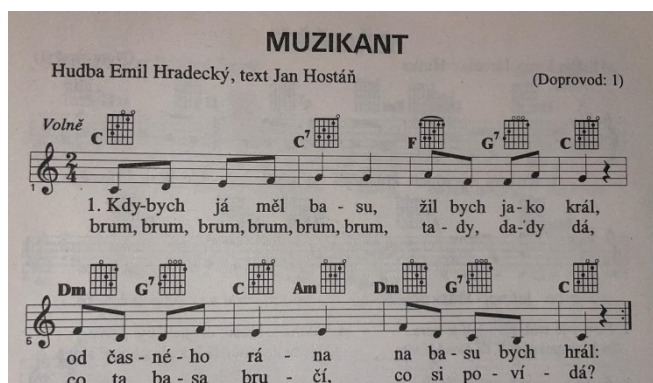
Obrázek 4 Píseň Muzikant

Průběh činnosti: Před zahájením nácviku písně jsme si ukázali nejprve, jak na správné dýchání (str. 38-39, Ucházející balónek), zařadila jsem také artikulační cvičení (str. 41, Muzikanti) a rozezpívání (str. 44-45, Hudební nástroje). Poté jsem zazpívala první sloku písně u klavíru. Následně děti vždy po dvou taktech opakovaly formou ozvěny. Tímto způsobem jsme dozpívali písničku až do konce. Následně jsme si to zkusili znovu. Poté jsem dětem rozdala Orffovy nástroje a jejich úkolem bylo pomocí nástrojů zachytit při zpěvu metrum písně. Děti jsem rozdělila do dvojic a postavila je tak, aby stály všichni podle toho, v jakém pořadí budou hrát. Děti zpívaly společně, při refrénu hrála vždy pouze daná dvojice. První dvojice hrála na ozvučná dřívka.