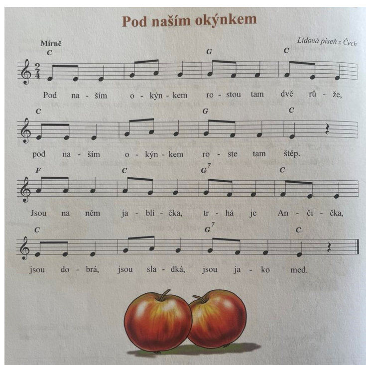
Obrázek 3 Píseň Pod naším okýnkem

Průběh činnosti: Pro nácvik písně jsem zvolila tradiční lidovou píseň Pod naším okýnkem . Před samotným nácvikem jsme provedli krátké dechové cvičení (str. 39, Vítr), aktivitu pro správný postoj (str. 42-43, Sbíráání jablek ze stromu) a rozezpívání (str. 43-44, Sbíráám jablíčka). Nejprve jsem dětem celou píseň zazpívala u klavíru. Poté jsem dětem předzpívala píseň po dvou taktech a děti opakovaly formou ozvěny. Následně jsme si píseň zkusili zazpívat znovu, avšak nyní už děti opakovaly po čtyřech taktech. Jakmile měly děti píseň více osvojenou, zkusili jsme zpěv propojit s pohybem. Děti se rozmístily po herně tak, aby kolem sebe měly dostatek místa. Stoupla jsem si čelem před ně a předevičovala kroky k písni a u toho zpívala a děti postupně opakovaly po mě. Poté jsme si celý proces zkusili znovu. Děti jsem vedla k tomu, aby se snažily pomocí pohybového doprovodu dodržet rytmus písně.