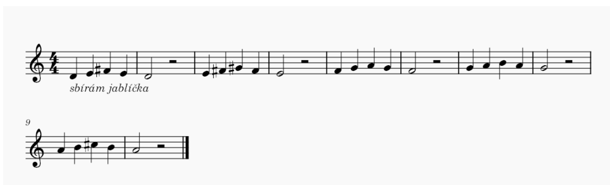
Obrázek 1 Rozezpívání – Sbírám jablíčka