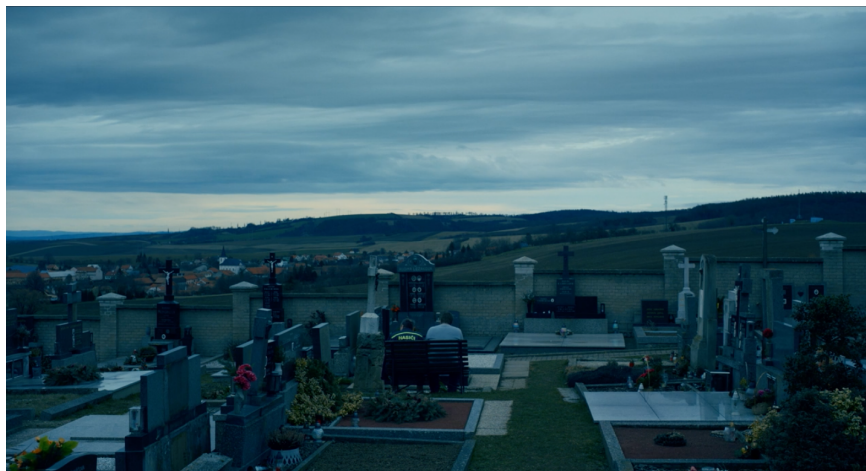
Obrázek 1 Poslední záběr úvodní sekvence na hřbitově (Koloman Rybanský, 2022)

Hned při roztmívačce na samém začátku filmu můžeme zaslechnout zvuky kohouta, vítajícího nadcházející den. Již to diváka přesvědčivě zanesse mimo město. Hřbitov na kopci a z něj výhled na přilehlou vesnici, kde ční kostel jako symbol českého venkova. Ten se vyskytuje i v následující scéně, exponující nám časoprostor filmu. Centrálně komponovaný, jako středobod tradičního konzervativního venkova a okolo něj náves, místo všeho společenského dění. Hned pak další záchytný bod, hospoda. A před ní hlavní postavy popíjející čepované pivo. Po těchto sekvencích již divák nemůže zapochybovat o prostoru, ve kterém se bude zbytek filmu odehrávat. V dalším průběhu snímku je nám postupně jasné, že se nenacházíme na venkově suburbánním, ale že se s největší pravděpodobností jedná o obec s malým počtem obyvatel na některé z periferií, kde je výrazně propojená venkovská komunita. Obyvatelé zde nejezdí moderními automobily a jejich obydlí jsou oprýskaná. Film se odehrává zhruba v čase, ve kterém byl natočen, tedy okolo roku 2022. Příběh je rámován obdobím velikonočních svátků, titulky divákovi vždy přesně sdělí den, ve kterém se následující scény dějí.