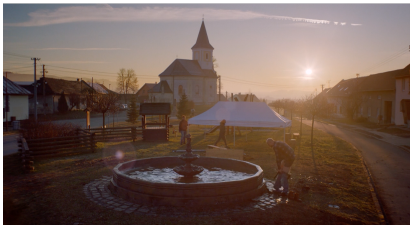
Obrázek 2 Kostel jako středobod a náves (Koloman Rybanský, 2022)