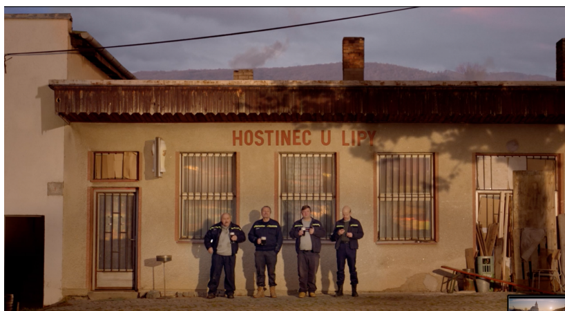
Obrázek 3 Hasiči před hostincem (Koloman Rybanský, 2022)