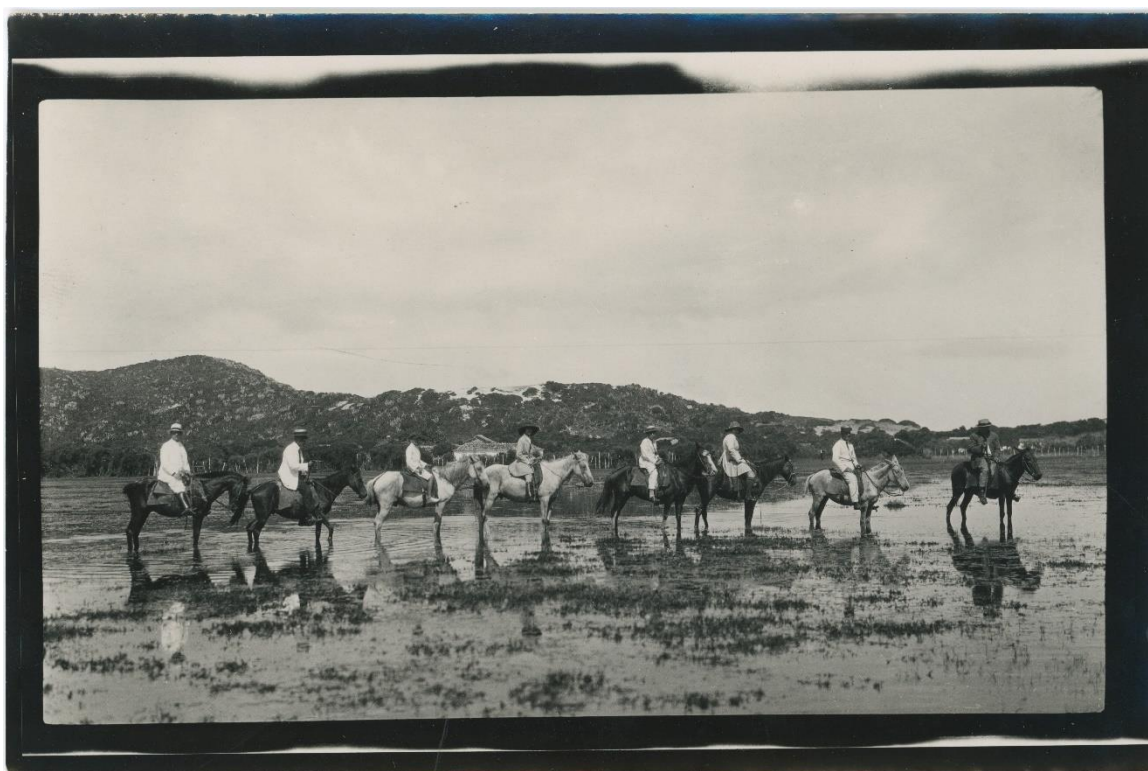
Obrázek 7 Ha 736, Elsie a další členové výpravy na koních, Brazílie, 20. léta

Havlasa potvrzuje, že fotografoje pouze na svitkový negativ, zamýšlí se nad negativem a jeho kvalitou a možnostmi, potvrzuje tak fotografické znalosti převyšující úroveň znalostí tehdejších amatérských fotografů, kteří se procesem vyvolávání filmů zvětšování fotografií sami nezabývali.