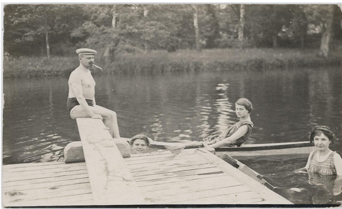
Obrázek 6 Ha 3695, U Dufků ve Světlé nad Sázavou, 1914

v Čechách, na Moravě i ve Slezsku, a tak měla Elsie poprvé v životě možnost poznat zemi, ze které její rodina odešla v polovině 19. stol. do USA. Zážitky a fotografie z cesty kolem světa byly pro Havlasu v následujících letech zdrojem inspirace při psaní románů i cestopisů. V jeho tvorbě se stále objevuje jedna technická nedokonalost, a sice časté zaostřování na pozadí, za fotografovaný námět. I tak je na dochovaných fotografiích vidět, jaký udělal jako fotograf za posledních několik let pokrok, jeho snímky velmi dobře obstojí ve srovnání s našimi dalšími cestovateli – fotografy. Po návratu z cesty kolem světa fotografuje hlavně svou ženu Elsie, rodinu a přátele při různých společenských událostech a výletech. Tyto fotografie mají osobní charakter a nesloužily nikdy k ilustrování knih nebo jako obrazový doprovod při přednáškách.