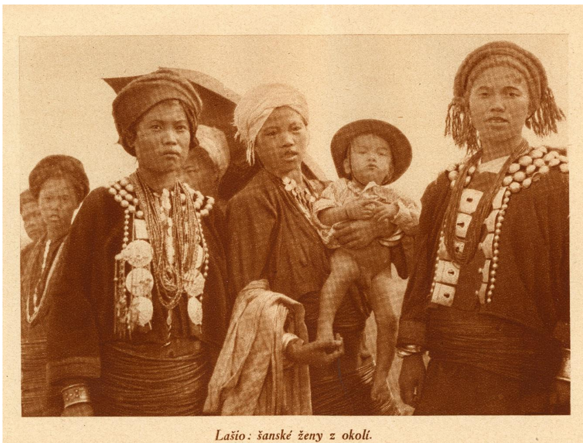
Obrázek 8 Země pagod (1932), s. 441