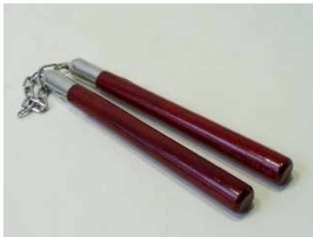
Obr. 2. Nunčaky