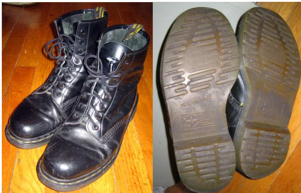
Obr. 5. Boty Dr. Marten's Classic 1460