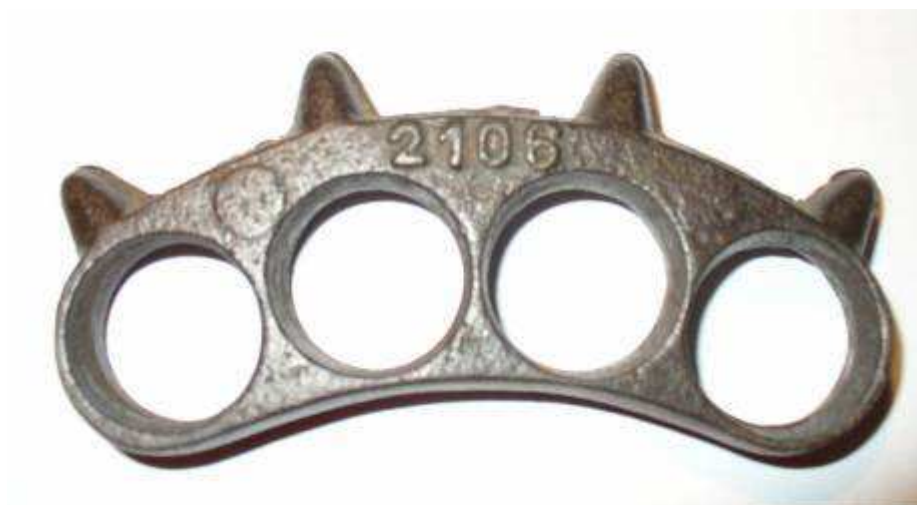
Obr. 4. Boxer na ruku