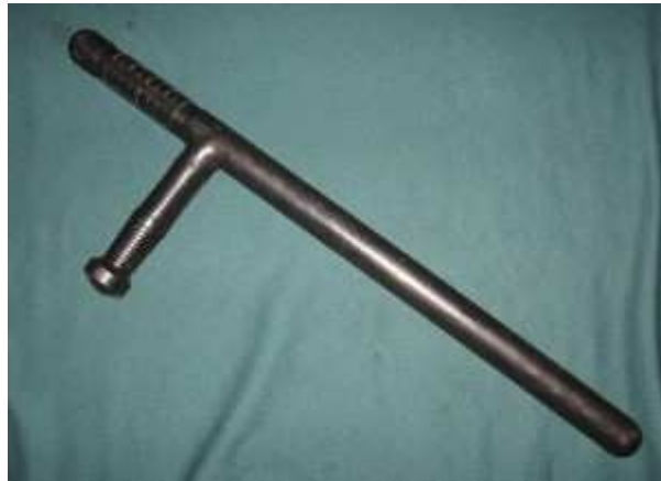
Obr. 1. Tomfa