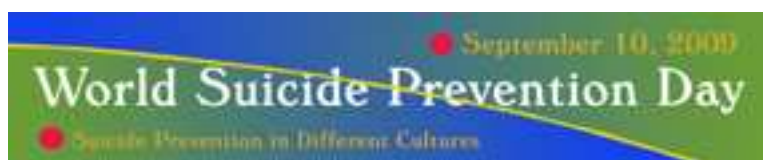
Obrázek 1: logo kampaně SUPRE

Sebevražda je stále velmi aktuálním tématem. Ročně ji na celém světě spáchá nejméně 1 milion lidí. Světová zdravotnická organizace (dále jen WHO) předpokládá, že v roce 2020 bude na celém světě 1.53 milionu spáchaných sebevražd. Právě WHO jí věnuje velkou pozornost, vytvořila plán preventivních opatření, známý pod pojmem SUPRE (suicide prevention= prevence sebevražd), který sestává ze seminářů na regionální a celostátní úrovni, sledování vývoje sebevražděnosti, technická podpora jednotlivým zemím (blíže nespecifikováno). 2