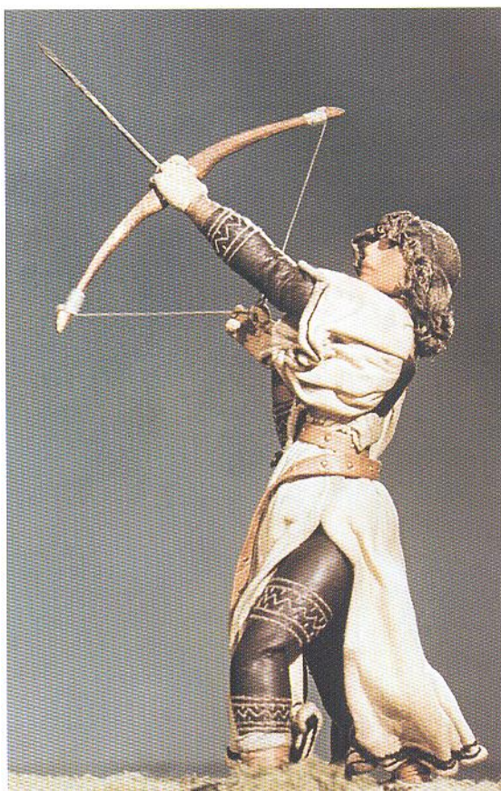
Postavy se Starých pověstí českých