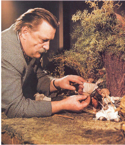
Jiří Trnka při práci