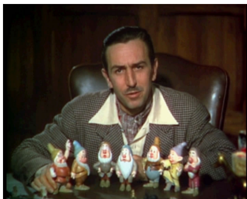
Walt Disney a sedm trpaslíků

Od prvního animovaného filmu uplynulo spousta času. Mnoho výborných animátorů a režisérů tvořilo různé druhy animovaných filmů. Od kreslené animace až po počítačovou.