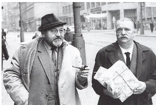
Jan Werich s Jiřím Trnkou